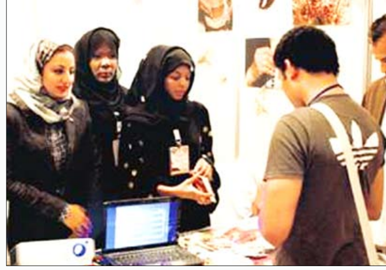
من فعاليات المعرض