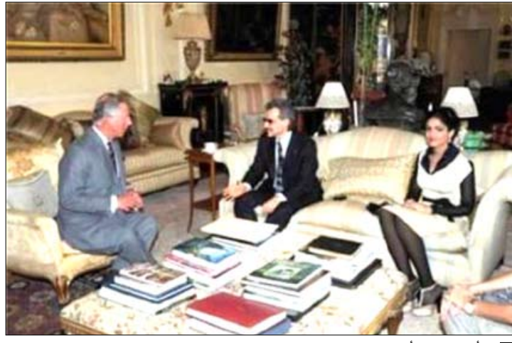
الأمير شارلز والأمير الوليد بن طلال وحرمة في قصر كلارنس