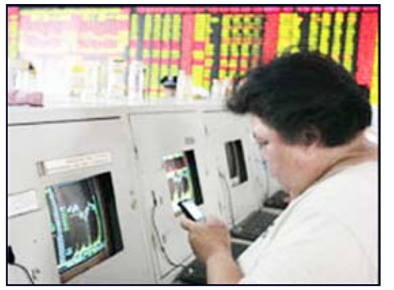
من أحد أسواق البورصة

وأدى تصريح إيجابي أدلى به مسؤول في بنك مركزي أوروبي حول تمويل البنوك الفرنسية إلى رفع مستوى المؤشرات. وقد شهدت الأسهم الأمريكية الكبرى ارتفاعاً قدره 1 في المئة، بينما ارتفعت المؤشرات الأوروبية بنسبة تزيد على 2.5 في المئة، وفي مدينة شنغهاي الصينية ارتفع مؤشر بورصة بنسبة 1.9 في المئة. وكانت مؤشرات الأسواق المالية قد انخفضت في الأسابيع الماضية بسبب مخاوف تتعلق بقوة القطاع البنكي الأوروبي والتعافي الاقتصادي العالمي. وقد تقدمت الأسهم الصينية الركب العالمي في الارتفاع بينما ينتظر المستثمرون الإعلان عن تعويم البنك الزراعي الصيني. وكذلك أدت بعض الاختبارات التي خضعت لها البنوك الفرنسية في مواجهة الضغوط والتوتر إلى ارتفاع المؤشرات الأوروبية، حيث ارتفع مؤشر فوتسي بنسبة 2.8 في المئة بينما صعد مؤشر كاك الفرنسي بنسبة 3.2 في المئة ومؤشر داكس الألماني بنسبة 2.6 في المئة. أما مؤشر داو جونز فقد ارتفع بشكل حاد في التداولات الأولى، ولم يعكس صفو الأجواء سوى الإعلان عن تباطؤ في نمو قطاع الخدمات الأمريكي عما كان متوقعاً له في شهر يونيو/حزيران. وبالرغم من هذا الارتفاع في مؤشرات الأسواق المالية العالمية إلا أن الخبراء حذروا من المبالغة في التفاؤل، حيث يرون أن هذا الارتفاع سببه زيادة بيع الأسهم وليس نقلة في توجهات المستثمرين.