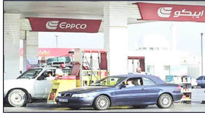
إحدى محطات البنزين في الإمارات