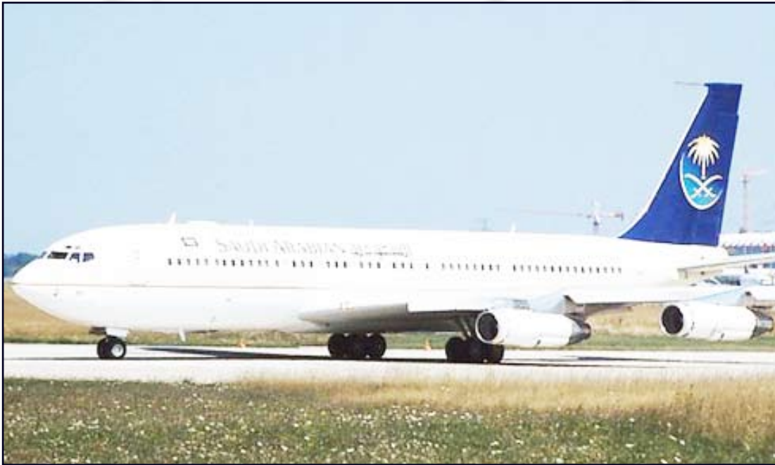
إحدى طائرات الخطوط السعودية

ويعمل المركز الإقليمي للملاحة الجوية في جدة على مراقبة وتوجيه الطائرات التي تحلق بالمستويات المنخفضة من المجال الجوي والواقعة بين ارتفاعي 15 و29 ألف قدم، في حين يقوم المركز الثاني في الرياض بالتحكم في الحركة الجوية التي يتجاوز ارتفاعها 29 ألف قدم عن سطح البحر. كما يضم المركز الإقليمي للملاحة الجوية بجهة أنظمة حاسبات آلية متطورة تقوم بمعالجة خطط الطيران والمعلومات الرادارية المستمدة من نحو 17 راداراً على نطاق السعودية، فضلاً عن 42 محطة اتصالات أرض/جوا نائية للتحكم. وفي السياق ذاته، أعلن الطيران المدني عن عزمه خلال شهر أغسطس (آب) المقبل تشكيل المبنى الجديد للطيران الخاص الذي تم تجهيزه لاستيعاب 50 نوعاً من الطائرات الحديثة على مساحة 176.4 ألف متر مربع تم تقسيمها إلى ثلاثة أجزاء، تضمن الجزء الجنوبي مساحة 2650 متراً مربعاً للمكاتب خدمات شركات الطيران الخاص والملاحة الأرضية، في حين تبلغ مساحة الجزء الثاني 750 متراً مربعاً لتتعلق منه عمليات التحكم في الوصول والمغادرة، فضلاً عن تخصيص الجزء الثالث لإدارة عمليات الطيران الخاص على مساحة 1300 متر مربع.