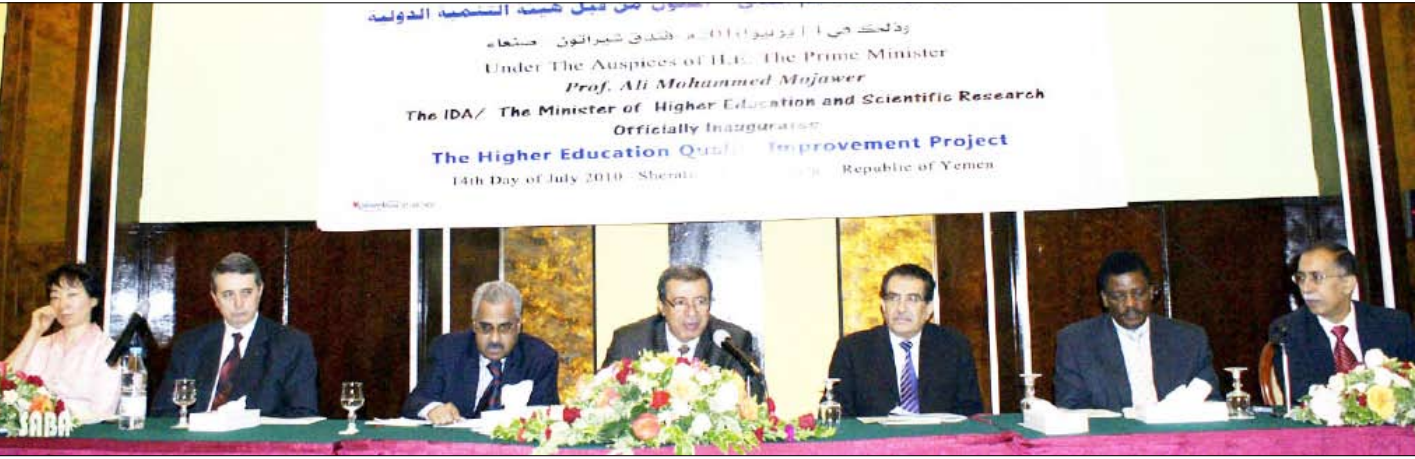
من حفل تدشين مشروع جودة التعليم العالي

ستهدف لتحسين جودة البرامج الدراسية، وإدخال برامج جديدة مطلوبة لسوق العمل فضلا عن بناء قدرات المعنيين في هذا المجال.