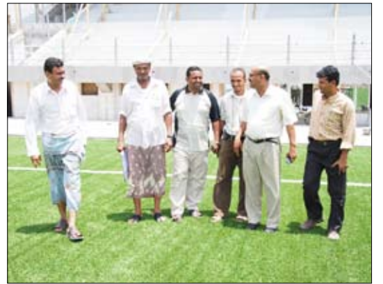
اليماني يزور ملعب التلال