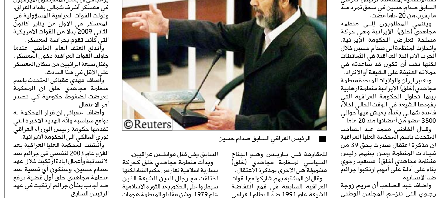
الرئيس العراقي السابق صدام حسين

على أهداف إيرانية. بينما أعدمت إيران عددا كبيرا من مسجونى منظمة مجاهدي خلق الإيرانية في نهاية الحرب الإيرانية العراقية. وفي العام الماضي قال العراق انه يرغب في أن يغادر المعارضون الإيرانيون في معسكر أشراف شمالي بغداد العراق وتولت القوات العراقية المسؤولية في المعسكر في الاول من يناير كانون الثاني 2009 بدلا من القوات الأمريكية التي كانت تقوم بحراسة المعسكر. وأندلع العنف العام الماضي عندما حاولت القوات العراقية دخول المعسكر وقتل سبعة إيرانيين من سكان المعسكر على الأقل في هذا الحادث. وأضاف مهدي عقباتي المتحدث باسم منظمة مجاهدي خلق ان المحكمة تعرضت لضغوط حكومية كي تصدر أمر الاعتقال. وأضاف عقباتي ان قرار المحكمة له دوافع سياسية وانه الهدية الأخيرة التي تقدمها حكومة رئيس الوزراء العراقي نوري المالكي الى الحكومة الإيرانية. وأُنشئت المحكمة العليا العراقية بعد الغزو عام 2003 لتتقصى في جرائم ضد الإنسانية وأعمال إبادة ارتكبت خلال عهد صدام حسين. وستكون أي قضية ضد منظمة مجاهدي خلق أول قضية ترفع ضد اجانب بشأن جرائم ارتكبت في عهد الرئيس السابق.