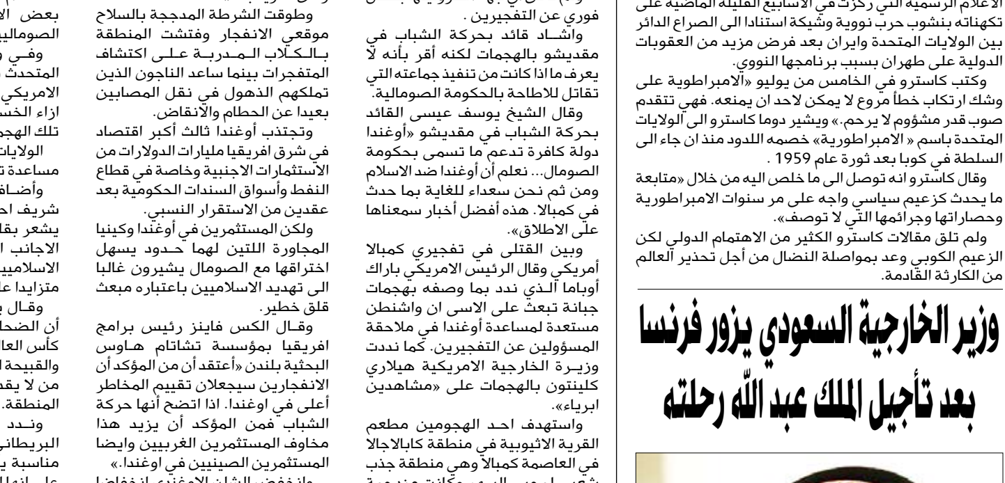
الامير سعود الفيصل