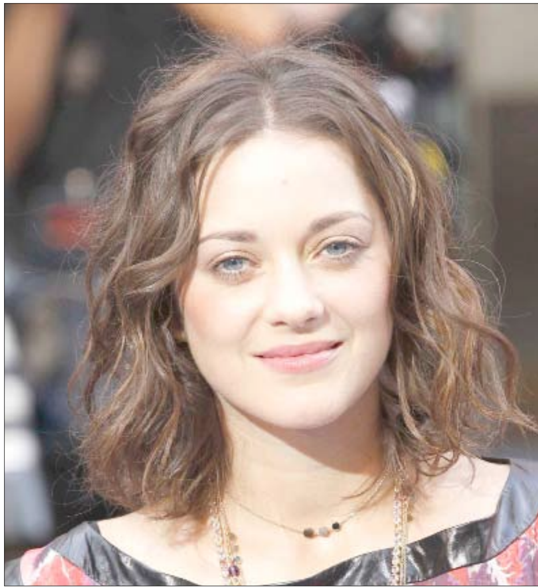
الممثلة الأمريكية ماريون كوتيراد أثناء حضورها العرض الأول للفيلم (التوقع) في (أودن) بلندن أمس

مختلف طرق محافظات الجمهورية توزعت على النحو التالي: 3355 حادث صدام سيارات، و 2311 حادث دهس مشاة، و 1008 انقلاب مركبات، و 79 حادث سقوط من على الياقات وأرجعت الإحصائية الحوادث المرورية إلى إهمال السائقين والمشاة والسرعة الزائدة والتجاوز الخاطيء، بالإضافة إلى عدم استخدام حزام الأمان، والتحدث عبر الهاتف أثناء القيادة، وأسباب أخرى.