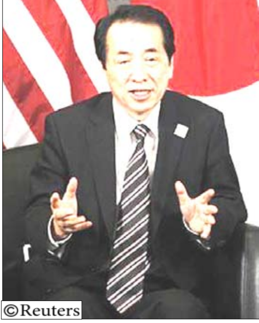
رئيس وزراء اليابان ناوتو كان يدلي بتصريحات في كندا يوم 27 يونيو حزيران 2010.

ويعارض شريك الحزب الديمقراطي الحالي أي زيادة في ضريبة المبيعات التي تبلغ نسبتها خمسة في المئة في أي وقت قريب كما يعارض الزيادة بعض الحلفاء المحتملين. وتوافق أحزاب أخرى معارضة على أن زيادة ضريبة المبيعات حتمية ولكنها ستتردد على الأرجح في المساعدة الحزب الديمقراطي المنفاس الذي لم يكشف بعد مقترحاته التفصيلية للإصلاح الضريبي.