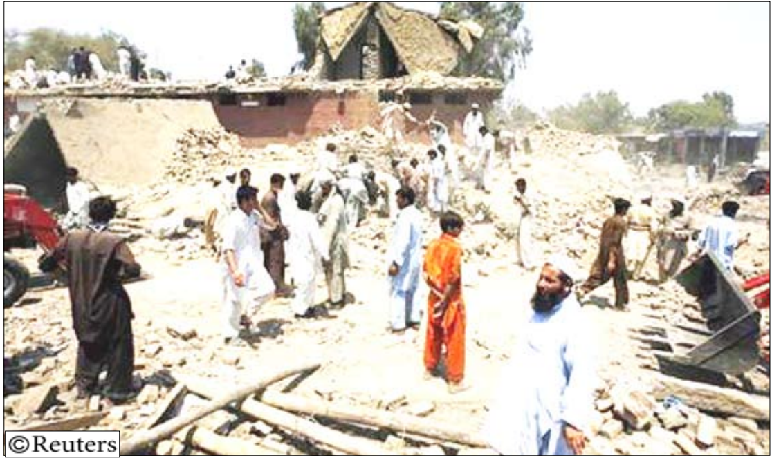
مسرح التفجير في شمال غرب باكستان يوم أمس الجمعة.

المكتب عندما سمعت الانفجار. لا أعلم كيف وقع لكن يمكنني أن أرى العديد من الجثث على الأرض وأرى كثيرين يجرون في كل الاتجاهات.