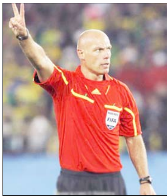
سيدير مباراة تحديد المركز الثالث بعد غد الثلاثاء والتي وأوروجواي.

ويأمل المنتخب الإسباني في ألا يكون تعيين ويب لإدارة هذه المباراة قلاً سبباً للفريق حيث سبق وأن أدار المباراة الأولى للفريق في البطولة الحالية وانتهت بفوز سويسرا 1/صفر. وأدار ويب مباراة المنتخبين الإيطالي والسلفواكي في الدور الأول للبطولة والتي منى فيها المنتخب الإيطالي حامل اللقب بالهزيمة ليخرج ميكرًا من البطولة. ولجأ مشجعو بولندا إلى تشويه صورة هذا الحكم بعدما منح ضربة جزاء للمنتخب النمساوي في الوقت بدل الضائع من مباريات الفريقين في يورو 2008 ولكن ويب أكد أنه اتخذ القرار الصائب كما حظي بمساندة تامة من الاتحاد الأوروبي للعبة (يوفيفا).