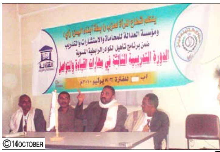
أثناء اختتام دورة تنمية المهارات النسائية في إب

إب / 14 أكتوبر: اختتمت أمس في محافظة إب فعاليات الدورة التدريبية الخاصة بمهارات القيادة والتواصل للفتيات نظمتها قطاع المرأة لحزب رابطة أبناء اليمن (أري)، بالشراكة مع مؤسسة العدالة للمحاماة والاستشارات والتدريب في محافظة تعز.