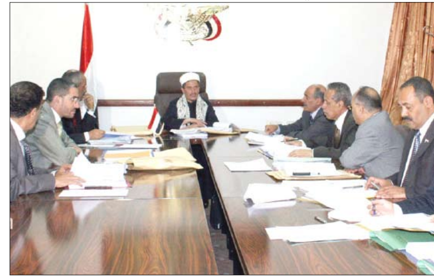
مجلس القضاء في اجتماعه الأسبوعي أمس

أقر مجلس القضاء الأعلى في اجتماعه الأسبوعي أمس، برئاسة رئيس المجلس رئيس المحكمة العليا القاضي عصام عبدالوهاب السماوي تعيين 14 قاضياً في محاكم ابتدائية بينهم ستة رؤساء محاكم، وذلك بناءً على مقترح وزير العدل. وتضمن القرار تعيين رؤساء المحاكم الشيخ عثمان وصبرة بمحافظة عدن، والتعزية بمحافظة تعز، والشاهل والمفتاح بمحافظة حجة، والسبرة بمحافظة إب، على أن يعمل به اعتباراً من 12 يوليو الحالي.