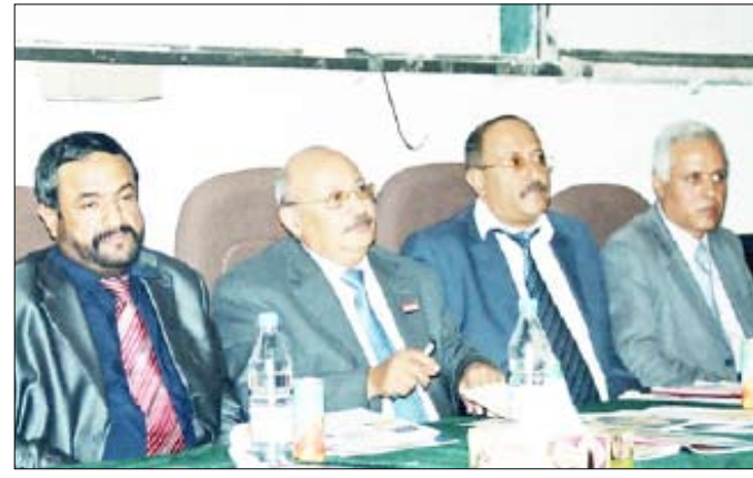
من فعاليات المهرجان الإعلامي الخامس لطلاب كلية الإعلام