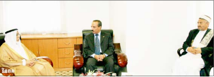
مباحثات يمنية كويتية في مجال الأوقاف والإرشاد

حكومة دولة الكويت ممثلة بوزارة الأوقاف والشؤون الإسلامية انطلقت من الرغبة المشتركة لتعزيز التعاون بينهما في ما يتعلق بالاهتمام بالقضايا والمستجدات الإسلامية المعاصرة والعمل من خلال إستراتيجية فعالة لخدمة الدعوة إلى الله ودعم التضامن الإسلامي وتوثيق روابط الصداقة والأخوة بينهما. وأوضح أنه تم الاتفاق على تعزيز التعاون الهادف لتعميق العلاقات الأخوية بين اليمن والكويت ومختلف جوانبها ومنطلقاتها. ونوه بما وصلت إليه العلاقات الثنائية بين البلدين من تطور بشكل عام وفي مجال الأوقاف والشؤون الإسلامية بوجه خاص. كما أعرب عن شكر اليمن لدولة الكويت أميراً وحكومة وشعباً على اهتمامهم وراعتهم للميمنين العاملين في دولة الكويت من خطباء وأئمة مساجد وغيرهم. وأشاد بقدور وجهود المعنيين الذين أسهموا في إعداد مذكرة التفاهم وتطوير التعاون بين البلدين الشقيقين وفي مقدمتهم سفير الكويت في اليمن سالم غصاب الزمانان والسفير اليمني في دولة الكويت خالد راجح شيخ، حيث شكلت تلك الجهود أساساً متيناً للتعاون المتميز بين البلدين خلال السنوات الماضية.