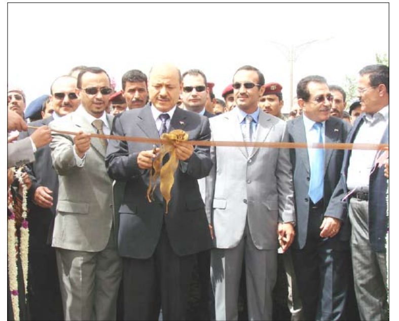
د. العليمي خلال تدشين مهرجان صيف صنعاء