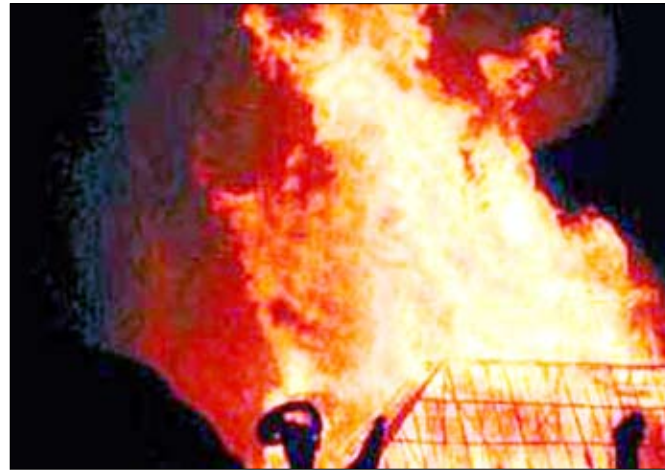
حوادث لحرائق مجهولة السبب تنتشر في قرى مصر

حارة عالية، مشيراً إلى أن هذه التفاعلات تقف وراء اندلاع الحرائق. وذكرت الصحفية أن حوادث اندلاع حرائق غير معلومة السبب تنتشر في قرى مصر بين الحين والآخر، وسرعان ما يرجعها الأهالي لقوى خفية، ثم تكذبها التقارير العلمية عند التحقيق في هذه الحوادث.