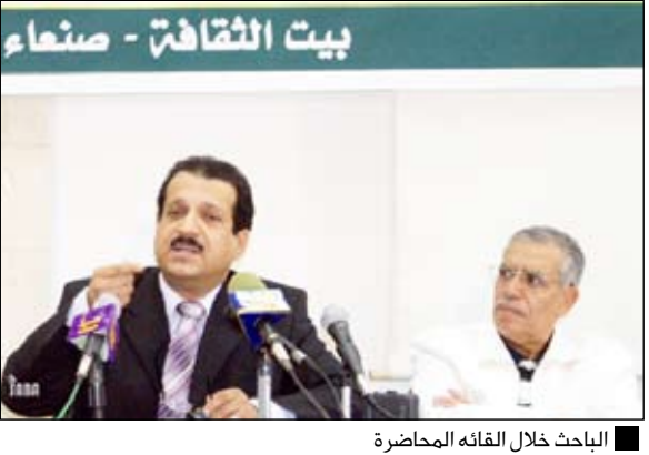
الباحث خلال القائه المحاضرة

خلال متابعته لمسار الملك عبدالعزيز في تأسيس وتوحيد المملكة العربية السعودية ما جعله مؤهلاً لبناء اللبننة الأساسية لوحدة الأمة من خلال توحيد الجزيرة العربية ودعوته للإمام يحيى آنذاك إلى التحالف بين اليمن والسعودية على طريق تحقيق الوطن الكبير من ربي آل سعود في تأسيس وتوحيد المملكة العربية السعودية ما جعله مؤهلاً لبناء اللبننة الأساسية لوحدة الأمة من خلال توحيد الجزيرة العربية ودعوته للإمام يحيى آنذاك إلى التحالف بين اليمن والسعودية على طريق تحقيق الوطن الكبير من ربي