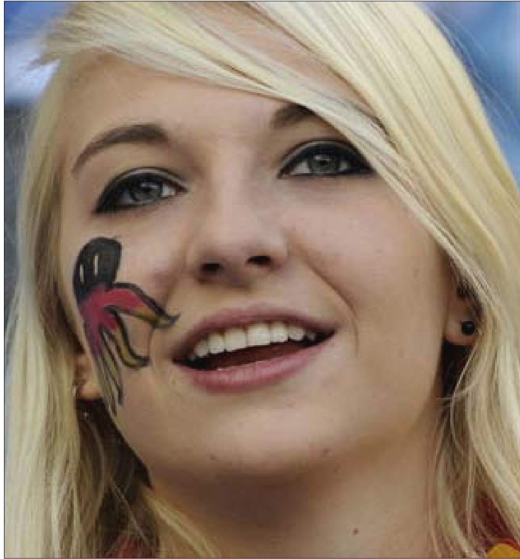
مشجعة رسمت الأخطبوط الألماني على وجهها في مباراة ألمانيا والأرجنتين بمونديال جنوب إفريقيا أمس

المهم أن أنا تشابمان، قبل نصف سنة فقط كما يؤكد معارفها في موسكو. وهناك أسست وكالة خاصة للخدمات العقارية تعمل بين روسيا والولايات المتحدة، وموجهة بالدرجة الأولى لخدمة العملاء الناطقين بالروسية. وبالنسبة إلى «جاسوسة» فإن حجم