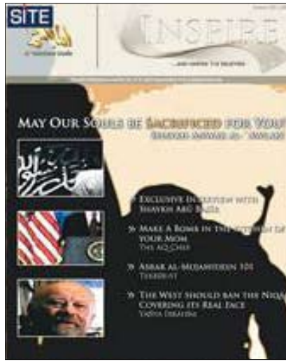
نسخة من المجلة التي تم تداولها على نطاق واسع

وجنوب آسيا، إنهم يستهدفون مجتمعاً صغيراً للغاية، ويأملون في الحصول على الانتحاري القادم أمثال الانتحاري الذي حاول تجسير ميدان التاميز، أو الميجور الذي نفذ عمليات قتل في قاعدة فورت هود العسكرية، لتنفيذ أعمال عنف واسعة النطاق».