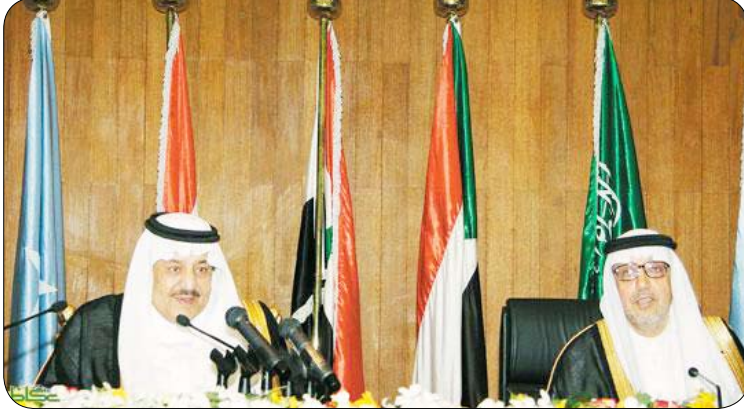
الأمير نايف بن عبد العزيز يتحدث في الخفل

وقال الأمير نايف بن عبد العزيز إن المملكة كانت المستهدفة الأولى من الإرهاب، مضيفا «وقد وقعت جرائم إرهابية ضد مرافق حكومية، وضد مرافق خاصة لمواطنين وضد إحدى المؤسسات والممتلكات الأجنبية وقتل في هذه الأحداث من قتل وأصيب من أصيب دون ذنب، ولكن قوات الأمن واجهت هذا الأمر وقبضت على الكثير من الإرهابيين، وقتلت البعض منهم دون استهداف للقتل بعدما وضعوا أنفسهم في مكان لا بد أن يصابوا فيه أثناء المواجهة والاعتقال».