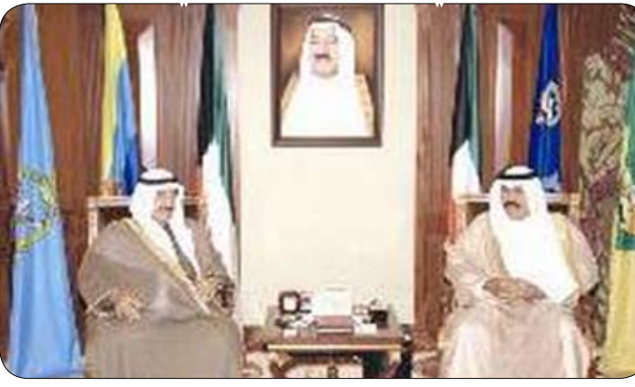
ولي العهد الكويتي يستقبل الشيخ ناصر المحمد

العاملة للجيش الفريق الركن الشيخ احمد الخالد الحمد لصباح. واستقبل سموه عبد المحسن جمال، كما استقبل سموه محمد رشود الرشود حيث أهدى سموه كتابا بعنوان (مجموعة القوانين الجزائية في دولة الكويت) وقد شكره سموه، مبارك صباح السالم. كما استقبل سموه حفظه الله رئيس الأركان