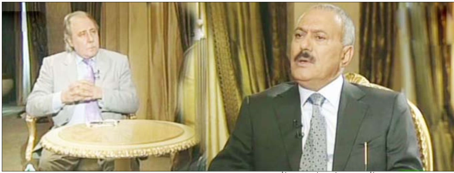
الرئيس يتحدث في برنامج ( أصحاب القرار ) بقناة (روسيا اليوم) أمس

القناة : السيد علي عبدالله صالح رئيس الجمهورية اليمنية شكرا جزيلاً لكم على هذه الإجابة.