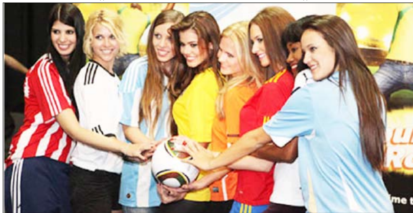
ميرلو رئيس الاتحاد الدولي للصحافة الرياضية

ميرلو رئيس الاتحاد الدولي للصحافة الرياضية حفل بكلمة معبرة نيابة عن الإعلاميين المشاركين في تغطية المونديال غربا عن عبق الشكر والامتنان لجنوب أفريقيا قيادة وشعبا ومساندته للإعلاميين وتوفير التسهيلات بغية قيامهم بواجبهم على أكمل وجه. واستعرض ميرلو أبرز الإنجازات التي حققها الاتحاد الدولي للصحافة الرياضية في الفترة الماضية بالإضافة إلى تطلعاته المستقبلية لتحسين وتفعيل دور الاتحاد على الساحة الدولية.