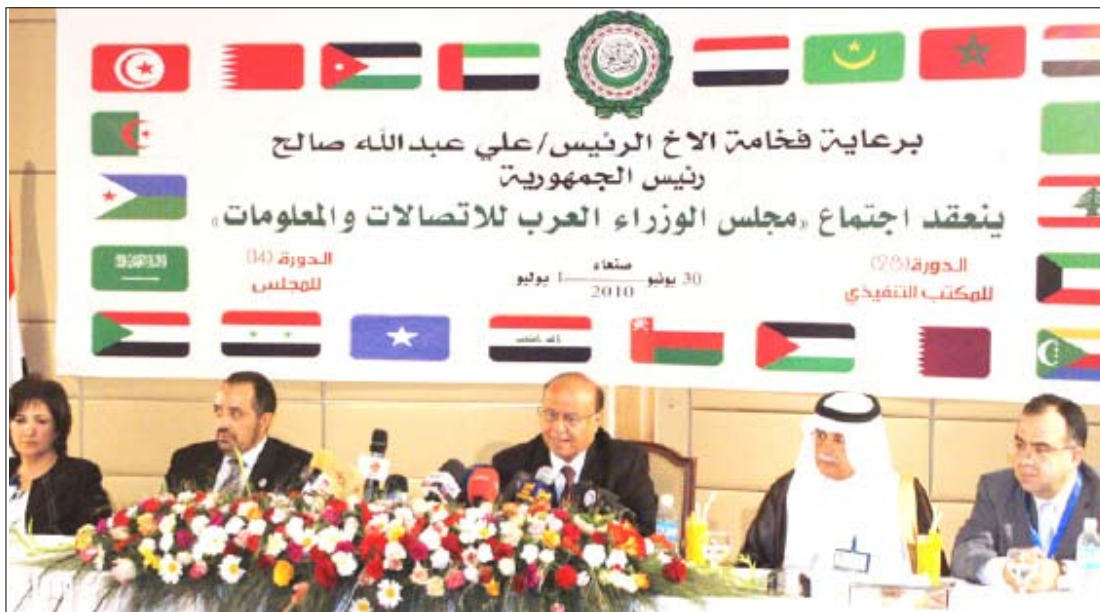
نائب رئيس الجمهورية يلقى كلمة في افتتاح أعمال مجلس الوزراء العرب للاتصالات