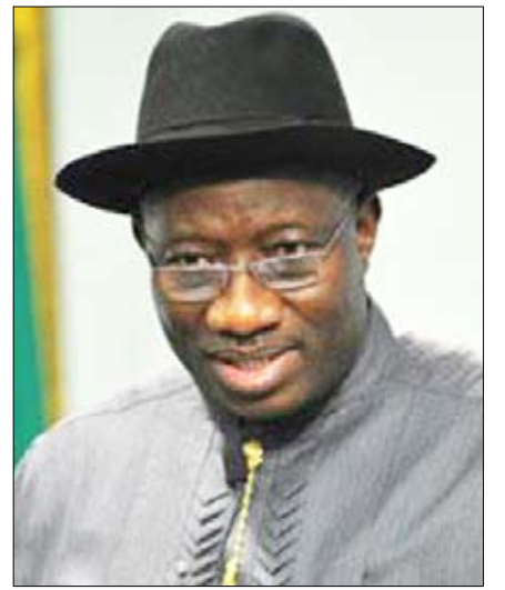
الرئيس النيجيري جودلاك جوناثان

14 أكتوبر / رويترز: قرر الرئيس النيجيري جودلاك جوناثان، إيقاف منتخب بلاده لكرة القدم عن المشاركات الدولية في العامين المقبلين بعد الأداء السيئ أثناء كأس العالم 2010. وقال إيما نيبورو وهو مستشار خاص للرئيس جوناثان "أصدر الرئيس تعليمات بانسحاب نيجيريا من كل المشاركات الدولية على مدار العامين المقبلين كي تستطيع إعادة تنظيم كرة القدم". وأضاف "هذا القرار لا غنى عنه بعد الأداء السيئ في كأس العالم". وخرجت نيجيريا من الدور الأول في النهائيات التي تستضيفها جنوب إفريقيا. وجاء قرار جوناثان بعد يوم واحد من اجتماع اللجنة التنفيذية للاتحاد النيجيري لكرة القدم لدراسة خروج الفريق من الدور الأول والحصول على نقطة واحدة فقط بعد أن حل المنتخب الوطني للبلاد في ذيل المجموعة التي تضم كوريا الجنوبية واليونان والأرجنتين. وقال بيان الاتحاد إنه يعتذر "للحكومة الاتحادية وجميع النيجيريين الذين يحبون كرة