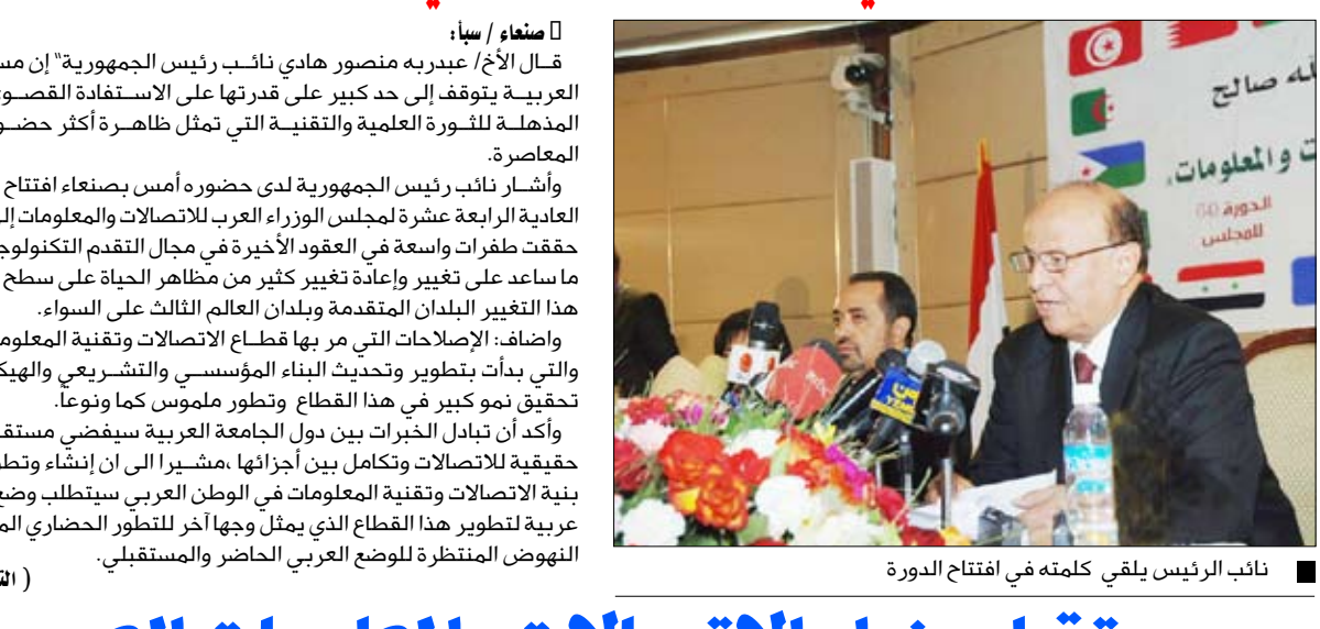
نائب الرئيس يلقي كلمته في افتتاح الدورة

قال الأخ/ عبديبه منصور هادي نائب رئيس الجمهورية " إن مستقبل الأمة العربية يتوقف على حد كبير على قدرتها على الاستفادة القصوى من النتائج المذهلة للثورة العلمية والتقنية التي تمثل مظهراً أكثر حضوراً في حياتنا المعاصرة. وأشار نائب رئيس الجمهورية لدى حضوره أمس بصنعاء افتتاح أعمال الدورة العادية الرابعة عشرة لمجلس الوزراء العرب للاتصالات والمعلومات إلى أن البشرية حققت طفرات واسعة في العقود الأخيرة في مجال التقدم التكنولوجي والمعرفي ما ساعد على تغيير وإعادة تغيير كثير من مظاهر الحياة على سطح الأرض شمل هذا التغيير البلدان المتقدمة وبلدان العالم الثالث على السواء. وأضاف: الإصلاحات التي مر بها قطاع الاتصالات وتقنية المعلومات في اليمن والتي بدأت بتطوير وتحديث البناء المؤسسي والتشريعي والهيكلي نتج عنها تحقيق نمو كبير في هذا القطاع وتطور ملموس كما ونوعاً. وأكد أن تبادل الخبرات بين دول الجامعة العربية سيفضي مستقبلاً إلى تنمية حقيقية للاتصالات وتكامل بين أجزائها، مشيراً إلى أن إنشاء وتطوير وتحسين بنية الاتصالات وتقنية المعلومات في الوطن العربي سيتطلب وضع إستراتيجية عربية لتطوير هذا القطاع الذي يمثل وجهاً آخر للتطور الحضاري المعبر عن حالة النهوض المنتظرة للوضع العربي الحاضر والمستقبلي.