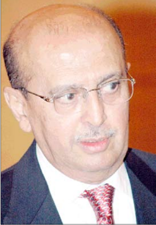
د. أبو بكر القربي

قدمنا (16) خطوة للانتقال من الجامعة العربية إلى الاتحاد العربي وستقدم إلى القمة الاستثنائية في أكتوبر لإقرارها