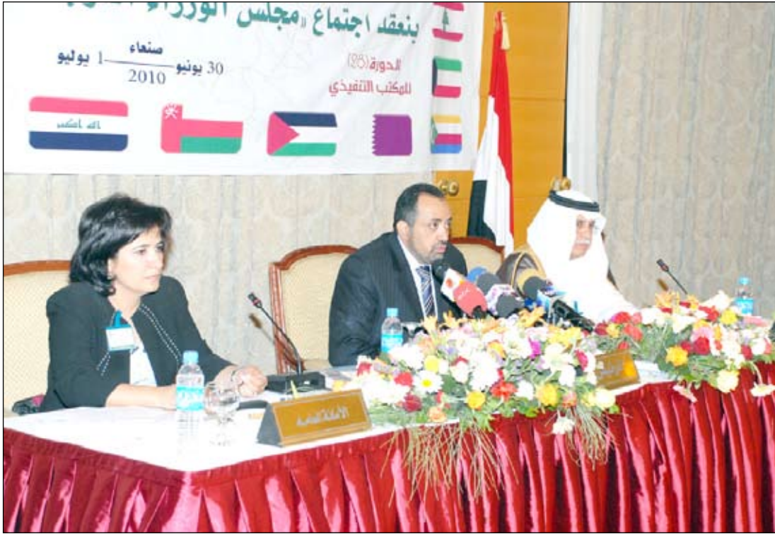
وزير الاتصالات خلال إختتام أعمال الدورة