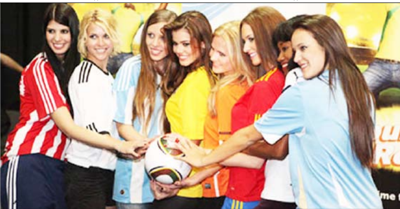
مباراة كرة قدم