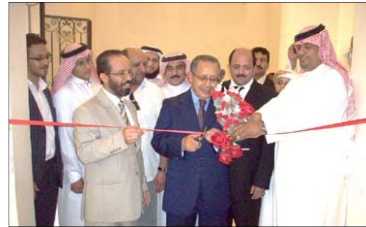
السفير القطيش خلال افتتاح المعرض

الاسلامية 2010م. كما اشتمل المعرض على أكثر من 400 صورة متنوعة عن اليمن تحكي العادات والتقاليد والثقافة والموروث، وجناح آخر عن المجسمات والأشغال اليدوية والحرفية. على التوالي على جناح مصور خاص بمدينة تريم أبرز أهم معالم المدينة التاريخية من قصور وأبواب وبن عماري ومكتبات وكذا موقعها ودورها التاريخي في خدمة الإسلام وهو ما يعكس اختيارها عاصمة للثقافة