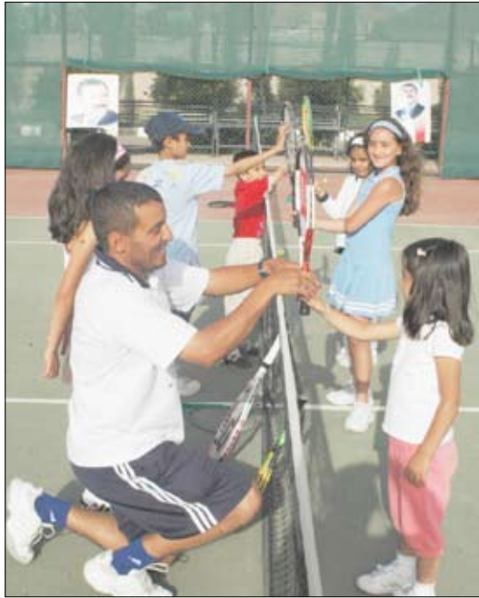
لقطة من تمارين البرامج