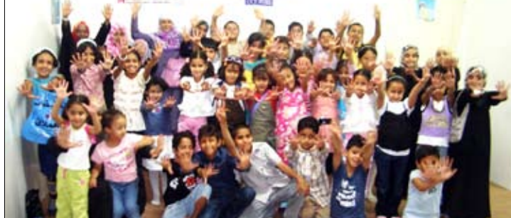
خلال تدريب الأطفال على حقوق الإنسان

صنعاء / صقر ابو حسن : ثلاثه أيام. واستهدفت الدورة الأولى 50 طفلاً وطفلة تحت شعار (الأطفال مدركين لحقوقهم) إضافة مدير مركز البحوث البيئية بجامعة حضرموت إلى مجموعة من أبناء المعتقلين ، بينما أقيمت الدورة الثانية في سجن الأجدات يومي 29 و 30 يونيو واستهدفت 50 طفلاً من النزلاء فيه.