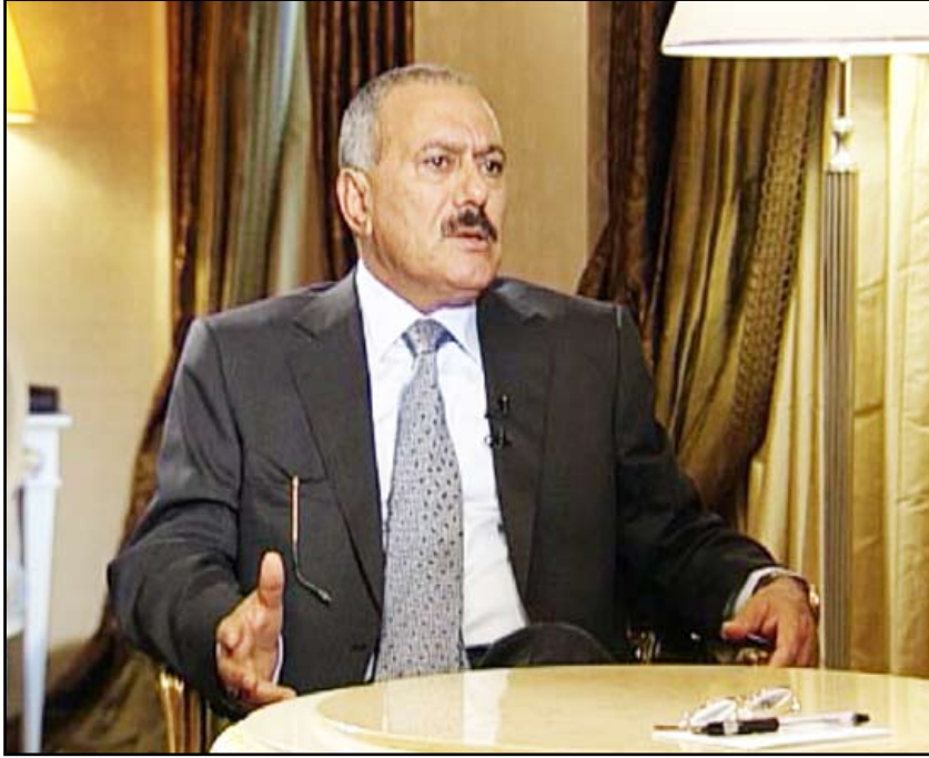
رئيس الجمهورية خلال مقابلة مع قناة (روسيا اليوم)