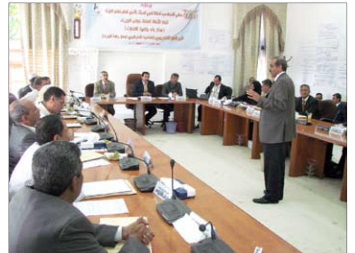
من فعاليات إختتام البرنامج التدريبي للتخطيط الإستراتيجي