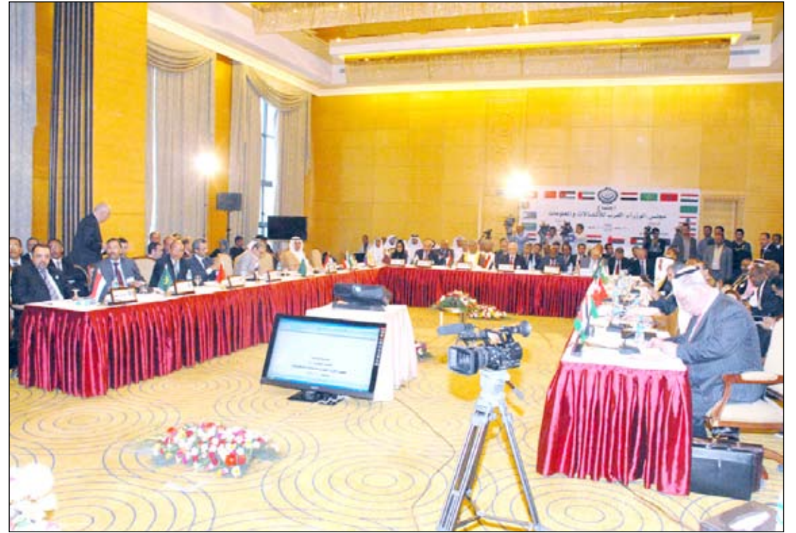
المشاركون في دورة مجلس الوزراء العرب للاتصالات والمعلومات

الفلسطيني، إلى جانب تبادل الإرساليات البريدية مع البريد الفلسطيني .