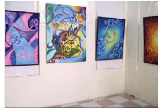
جانب من اللوحات الفنية للمعرض التشكيلي

المعرضة 50 لوحة تشكيلية ذات طابع فني ومهاري، وبأسلوب حسي ناضج من إبداعات طلاب بالجامعة ، وأثنى على تلك اللوحات الفنية والإبداعية في الخط العربي بحالته التشكيلية في إبداعات الخط العربي. بيت الفن بالحديدة شفاء محمد وعقب الافتتاح قال الدكتور حسين عمر قاضي رئيس جامعة الحديدة إن معرض الحرف العربي بيت الفن يعتبر أول عمل يقام في محافظة الحديدة وعلى مستوى اليمن.