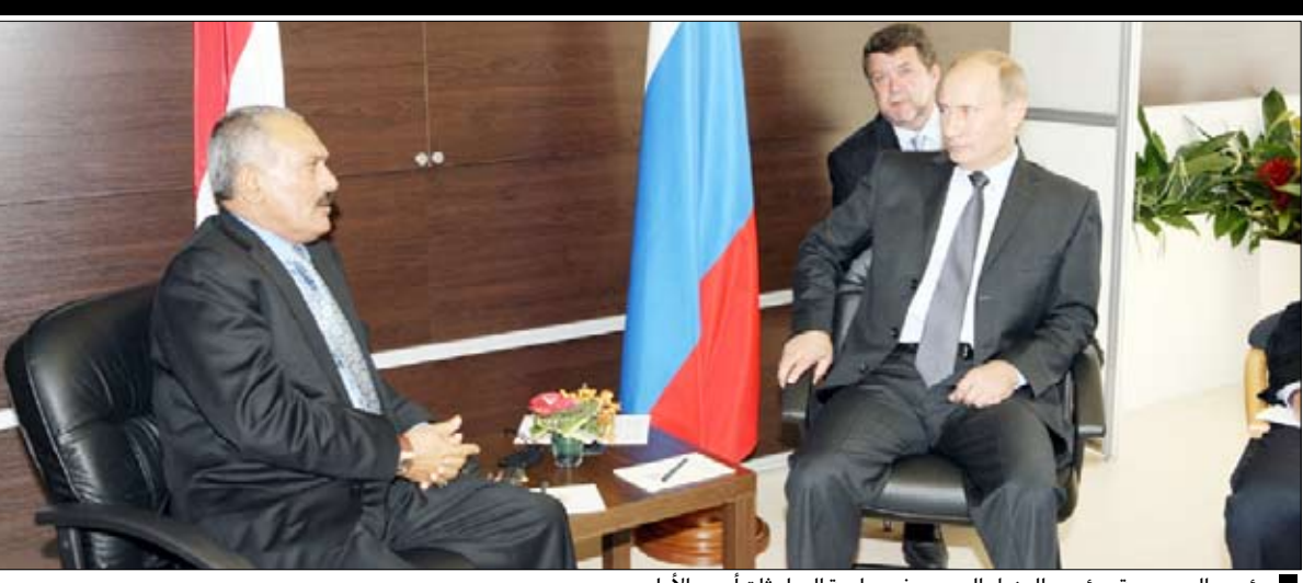
رئيس الجمهورية ورئيس الوزراء الروسي في جلسة المباحثات أمس الأول