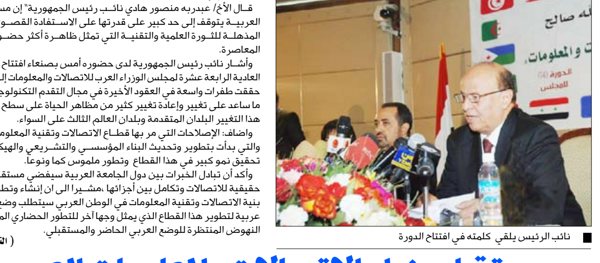
نائب الرئيس يلقي كلمته في افتتاح الدورة

صنعاء / سيا: قال الأخ عبدي بن منصور هادي نائب رئيس الجمهورية "إن مستقبل الأمة العربية يتوقف إلى حد كبير على قدرتها على الاستفادة القصوى من النتائج المذهلة للثورة العلمية والتقنية التي تمثل مظهراً أكثر حضوراً في حياتنا المعاصرة . وأشار نائب رئيس الجمهورية لدى حضوره أمس بصنعاء افتتاح أعمال الدورة العادية الرابعة عشرة لمجلس الوزراء العرب للاتصالات والمعلومات إلى أن البشرية حققت طفرات واسعة في العقود الأخيرة في مجال التقدم التكنولوجي والمعرفي ما ساعد على تغيير وإعادة تغيير كثير من مظاهر الحياة على سطح الأرض شمل هذا التغيير البلدان المتقدمة وبلدان العالم الثالث على السواء . وأضاف: الإصلاحات التي مر بها قطاع الاتصالات وتقنية المعلومات في اليمن والتي بدأت بتطوير وتحديث البناء المؤسسي والتشريعي والهيكلي نتج عنها تحقيق نمو كبير في هذا القطاع وتطور ملموس كما ونوعاً . وأكد أن تبادل الخبرات بين دول الجامعة العربية سيفضي مستقبلاً إلى تنمية حقيقية للاتصالات وتكامل بين أجزائها ،مشيراً إلى أن إنشاء وتطوير وتحسين بنية الاتصالات وتقنية المعلومات في الوطن العربي سيتطلب وضع إستراتيجية عربية لتطوير هذا القطاع الذي يمثل وجهاً آخر للتطور الحضاري المعبر عن حالة النهوض المنتظرة للوضع العربي الحاضر والمستقبلي . (نص المقابلة من 3)