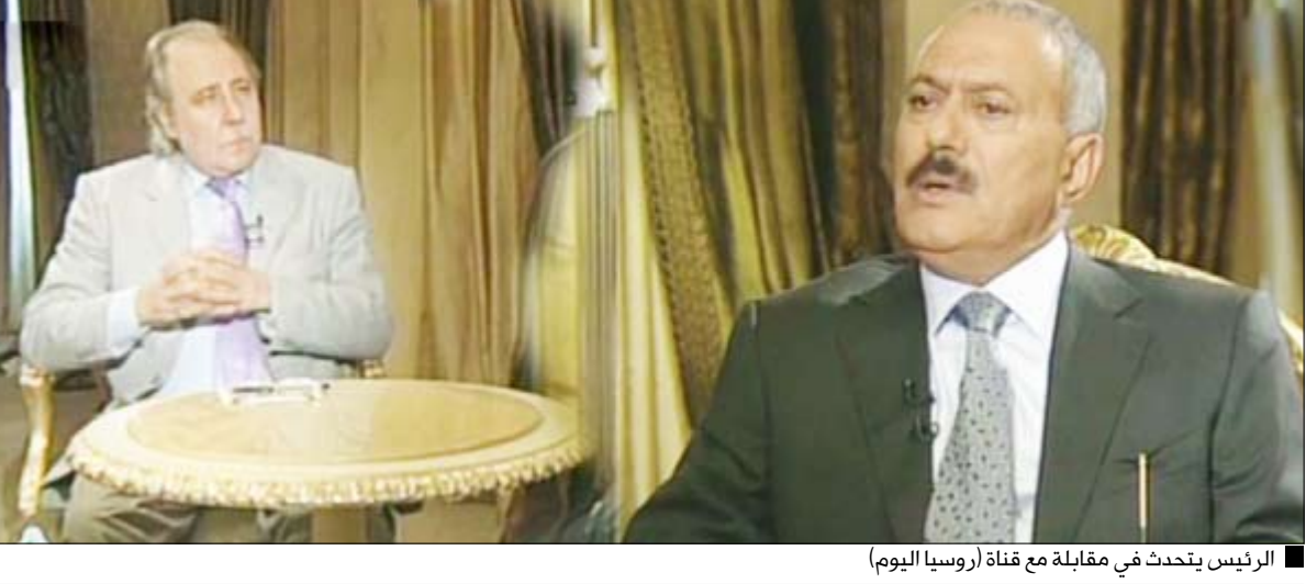
الرئيس يتحدث في مقابلة مع قناة (روسيا اليوم)

صنعاء / سيا: أكد فخامة الأخ الرئيس علي عبدالله صالح رئيس الجمهورية أن القمة العربية الخماسية التي عقدت في ليبيا مطلع الأسبوع الجاري بحثت تفعيل الاقتراح الذي قدمته اليمن خلال القمة العربية الـ 22 والمتعلق بإنشاء اتحاد عربي يحل محل جامعة الدول العربية . وقال فخامته في مقابلة خاصة مع قناة (روسيا اليوم) بثته في برنامجها الأشهر «أصحاب القرار» «شكلت القمة العربية لجنة من خمس دول لمتابعة المشروع الذي تقدمت به اليمن لإنشاء الاتحاد العربي بدلاً عن الأمانة العامة للجامعة العربية بما يواكب المتغيرات الدولية ويطور آلية العمل العربي في ضوء المستجدات». وأشار فخامة الأخ الرئيس إلى أن اللجنة الخماسية خلال اجتماعها في طرابلس بحثت هذا الموضوع وكان هناك تباين في وجهات النظر . وفيما يتعلق بالعلاقات اليمنية الروسية أكد فخامة رئيس الجمهورية أن العلاقات اليمنية الروسية علاقات صداقة جيدة ومتنامية .. معتبراً روسيا شريكاً أساسياً لليمن في مختلف المجالات ومنها المجال العسكري كما أن اليمن مستورد رئيسي لمختلف المعدات الروسية ومنها العسكرية. وحول جهود مكافحة القرصنة في خليج عدن وما يمكن أن تقدمه