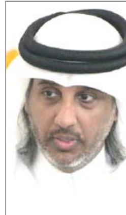
الشيخ حمد بن خليفة بن أحمد آل ثاني

منهم تقديم تقاريرهم حول استعدادات اليمن للبطولة. وأوضح رئيس اتحاد الكرة أن أمين سر اللجنة الأولمبية الكويتية ليس مطلعاً على لوائح البطولة، مؤكداً أن الاجتماع الذي عقد للمكتب التنفيذي للجان الأولمبية جاء بناء على طلب رؤساء اللجان الأولمبية للاطلاع على استعدادات اليمن وبالتالي أنه ليس من حق أحد أن يتحدث عن التأجيل أو نقل البطولة. وأضاف سعادة رئيس اتحاد الكرة: «اللجنة المكلفة بمتابعة استعدادات اليمن لاستضافة خليجي 20 من السعودية والإمارات وعمان، وليس كما ذكر العنزي الذي قال أنه اطلع على تقرير اللجنة المكلفة بمتابعة استعدادات اليمن للبطولة وذكر اسم قطر والبحرين وهما ليس من أعضاء اللجنة المكلفة بمتابعة استعدادات اليمن لاستضافة البطولة. وشدد سعادة الشيخ حمد بن خليفة بن أحمد آل ثاني على أن خليجي 20 ستقام في موعدها وفي حالة تعذر استضافة اليمن للبطولة ستقام البطولة في موعدها في الدولة التي عليها الدور طبقاً لنظام دورات كأس الخليج.