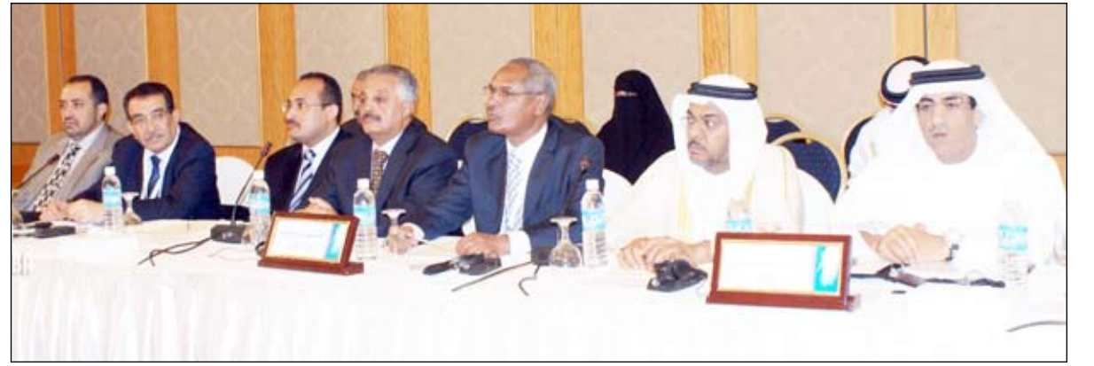
جانب من المشاركين اليمنيين والعرب

والصديقة، ومناقشة التحديات الراهنة للقطاع السياحي وكيفية عمل خطة الإنعاش السياحي في الشرق الأوسط. رئيس جمعية وكالات السياحة والسفر الأردنية بعمان شاهر حمدان أشار إلى أن اجتماع صنعاء لمنظمة السياحة العالمية سيعد بالنفع على اليمن حكومة وشعباً من خلال الترويج للسياحة وتعريف العالم بأن اليمن بلد الجمال والأمن والاستقرار وصنعاء حاضرة التاريخ والمعالم السياحية الأثرية والبساطة التي تظهر على سكانها وأهلها الطبيعيين والفن المعماري الجميل المحافظ على التراث الحضاري للفتحات المتعاقبة.