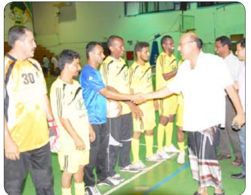
من افتتاح البطولة