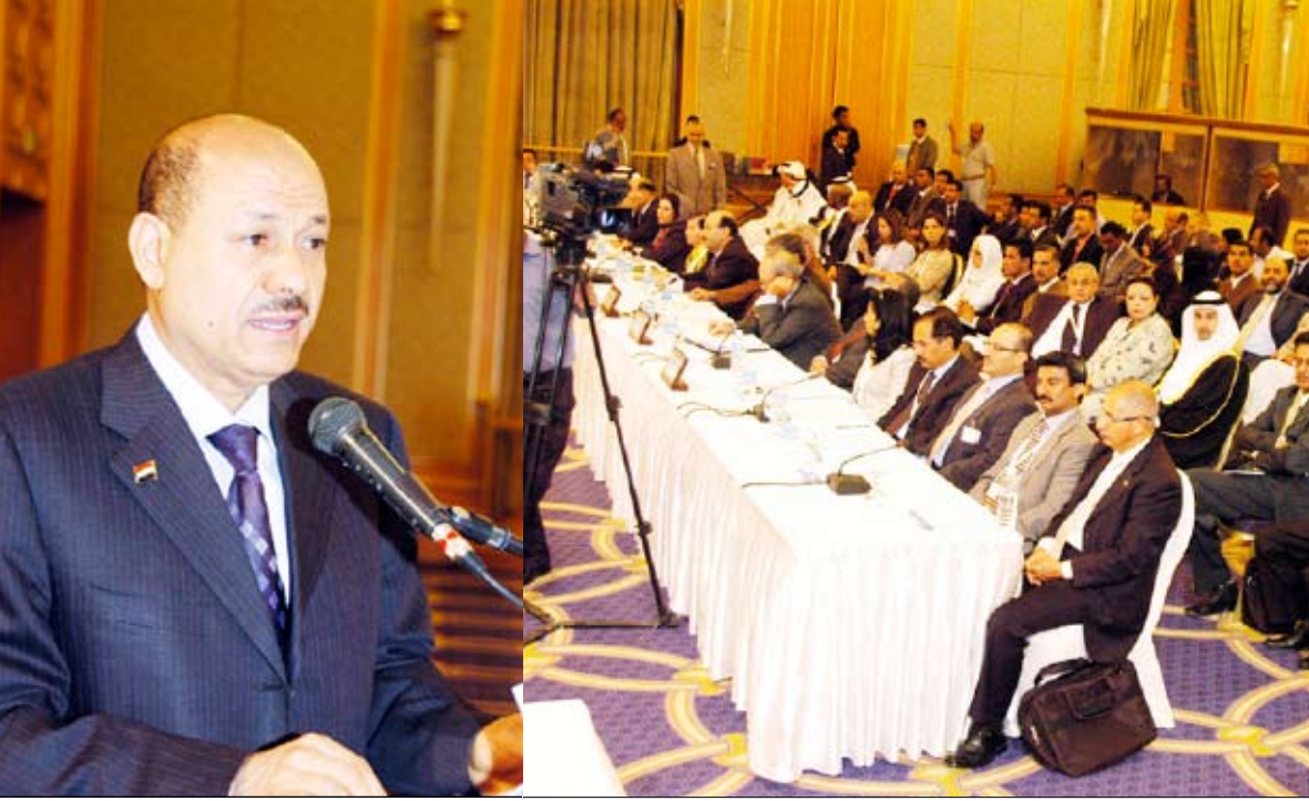
العلمي يلقي كلمته في اجتماع لجنة منظمة السياحة العالمية

صنعاء / سيا : أبدى خبراء ومراقبون دوليون استغرابهم من الصورة الإعلامية المضللة التي تحاول بعض وسائل الإعلام المغرضة رسمها عن اليمن وحقيقة الأوضاع الأمنية فيه.. مشيرين إلى أن الحقيقة على أرض اليمن منافية تماماً لتلك الصورة المبالغ والمضللة والمغلوطة، وأن اليمن بلد ينعم بالأمن والاستقرار على عكس ما تتعمد صنعه وتسويقه وسائل إعلامية امتهنت التهويل والإثارة والتضخيم وتحريك الفتن.