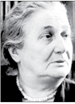
الشاعرة الروسية أنا أخماتوفا