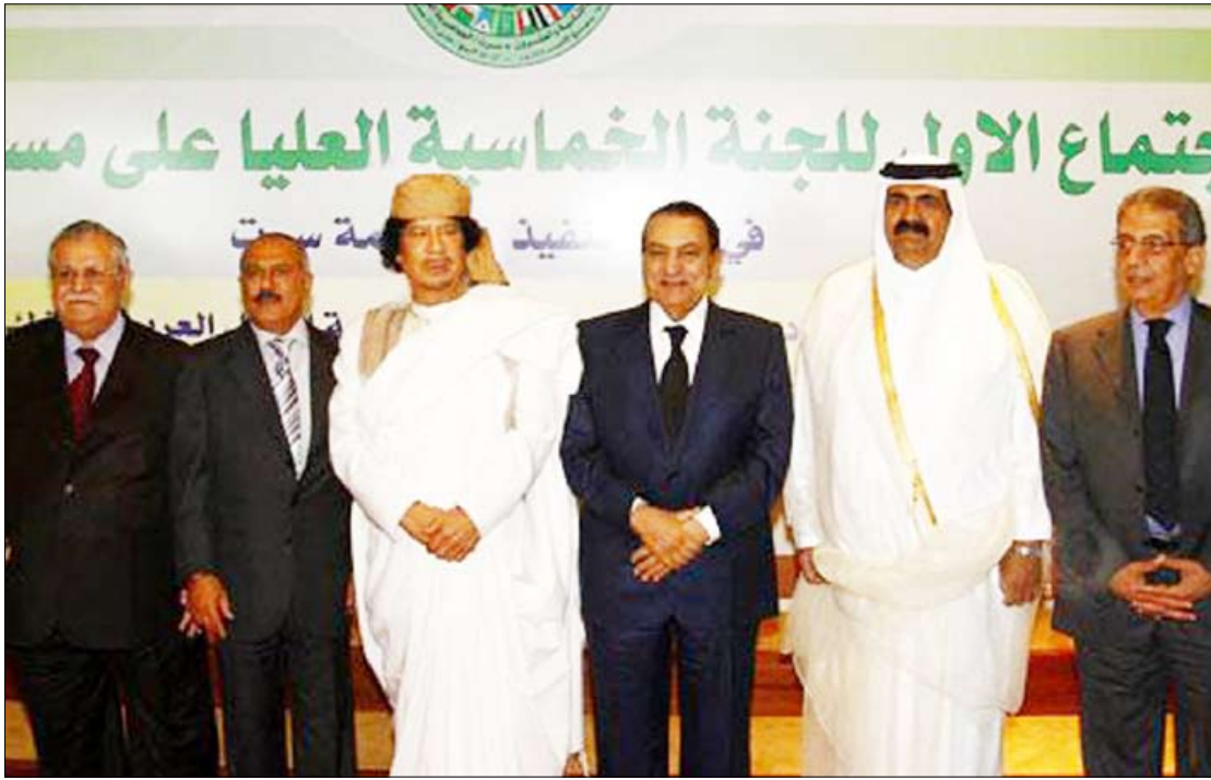
قادة القمة الخماسية