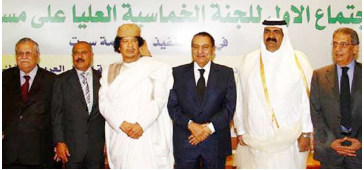
القادة العرب الأعضاء في اللجنة الخامسة مع أمين عام جامعة الدول العربية في صورة جماعية

القاهرة - طرابلس / سبأ: وصل فخامة الأخ الرئيس علي عبدالله صالح رئيس الجمهورية إلى القاهرة مساء أمس في زيارة بعد أن شارك في أعمال القمة العربية الخامسة التي انعقدت في العاصمة الليبية طرابلس وضمنت كلا من العقيد معمر القذافي قائد ثورة الفاتح من سبتمبر الليبية وفخامة الرئيس محمد حسني مبارك رئيس جمهورية مصر العربية وسمو الشيخ حمد بن خليفة آل ثاني أمير دولة قطر وفخامة الرئيس جلال طالباني رئيس جمهورية العراق. وقد اختتمت أمس بالعاصمة الليبية طرابلس اجتماعات اللجنة الخامسة لقادة الدول الأعضاء في اللجنة المكلفة بإعداد مشروع وثيقة تطوير منظومة العمل العربي المشترك تنفيذاً لقرار قمة سرت العربية الثانية والعشرين. وقد صدرت عدد من التوصيات في اجتماعات اللجنة التي حضرها فخامة الأخ الرئيس علي عبدالله صالح رئيس الجمهورية والعقيد معمر القذافي قائد ثورة الفاتح من سبتمبر الليبية وفخامة الرئيس محمد حسني مبارك رئيس جمهورية مصر العربية، وسمو الشيخ حمد بن خليفة آل ثاني أمير دولة قطر، وفخامة الرئيس جلال طالباني رئيس جمهورية العراق بالإضافة إلى الأمين العام لجامعة الدول العربية عمرو موسى. وكان فخامة الأخ الرئيس علي عبدالله صالح رئيس