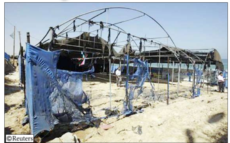
بقايا المعسكر الصيفي بعد اندلاع النار فيه