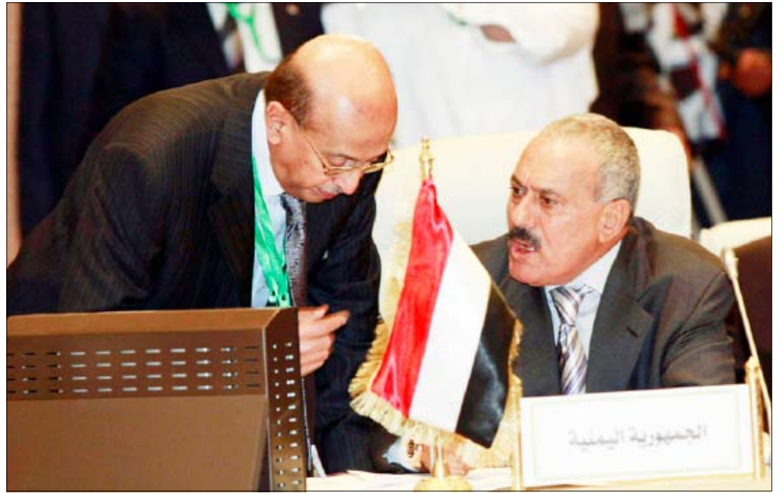
رئيس الجمهورية في القمة العربية الخماسية