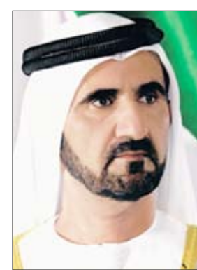
محمد بن راشد آل مكتوم

أسميه تحدياً، كل يوم كان تحدياً بالنسبة لنا، تحدياً لنجد المياه وتحدياً لنجد الطعام، وكل يوم هو تحد جديد الحياة تصبح مملعة إن لم تكن فيها تحديات». وأضاف سموه في مقابلة تبثها الشبكة في الثانية عشرة منتصف ليل الجمعة المقبل بالتوقيت المحلي «تريون أن سموه ركوداً، أو أن سموه مهما كان، نحن في الإمارات العربية المتحدة؛ دبي وأبوظبي وباقي الإمارات بخير. نحن نعرف أن هناك ركوداً اقتصادياً عالمياً، ونعرف أننا في تحد، ولكننا نتعامل مع الأمر».