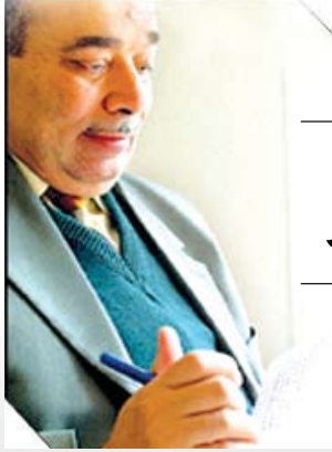
بقلم الشيخ الدكتور / أحمد صبحي منصور

• ثمة مذاهب وضعية تصادر الحرية الدينية التي فطر الله تعالى الناس عليها حين أعطاهم حرية الاختيار بين الإيمان والكفر، وبين الطاعة والمعصية. أما الاستفادة من مصادرة الحرية فهو الكهنوت الذي يخلق له سلطاناً من خلال مذهب وضعي يتسلط به على الناس. ويحوّل الدين إلى احترام و تكسب اقتصادي وجاه اجتماعي و سيطرة سياسية، وبهذا (يعلو) الكهنوت في الأرض مع أن (العلو) يجب أن يكون لله تعالى وحده.