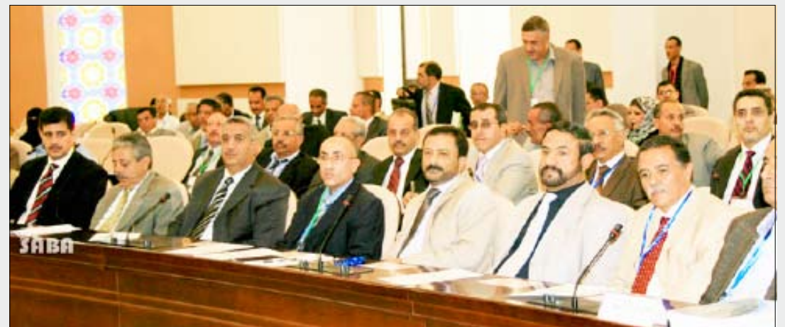
جانب المشاركين في اللقاء