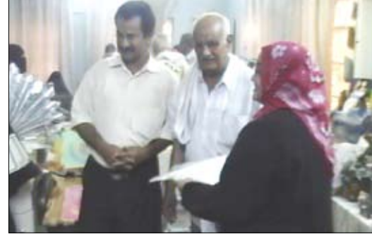
من فعاليات ورشة تدوير المخلفات الصلبة