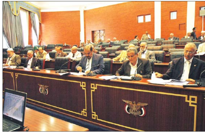
جانب من أعضاء مجلس الشورى