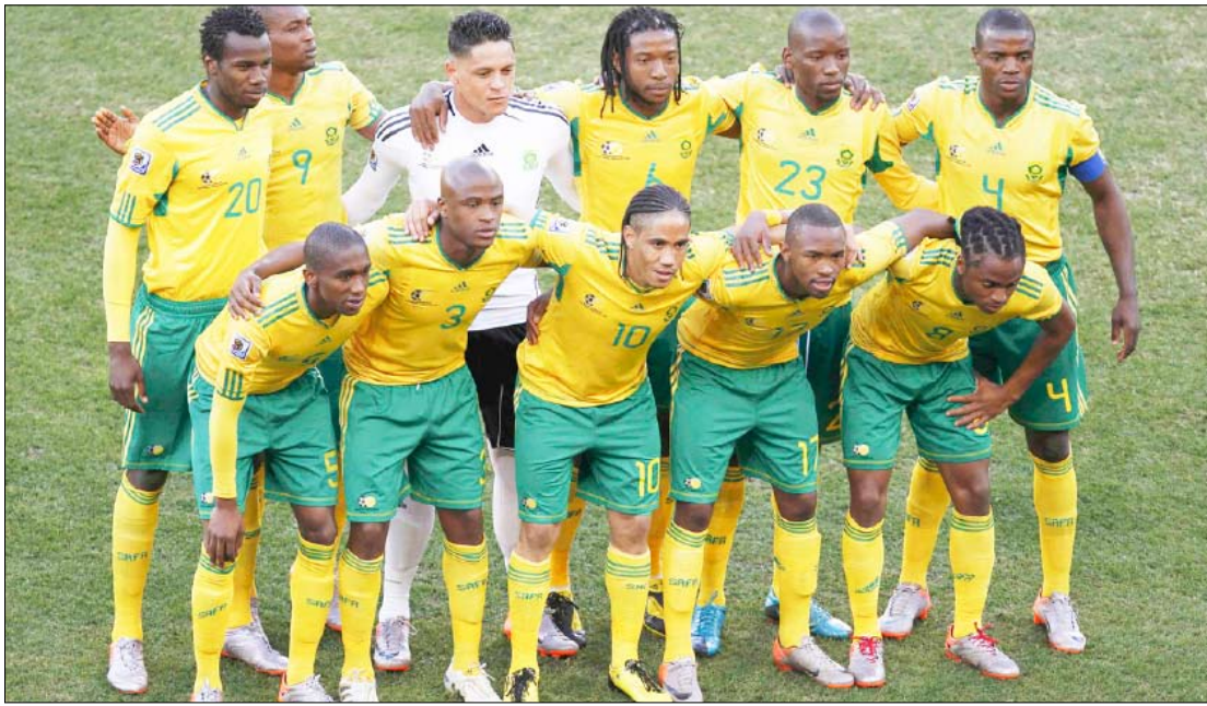
منتخب جنوب أفريقيا