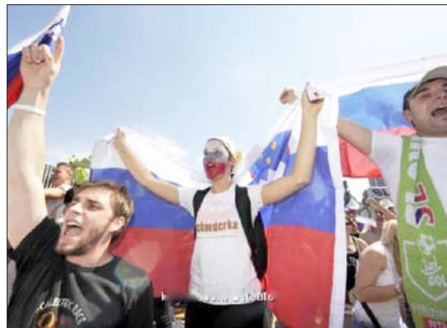
لدى استقبال المنتخب السلوفيني

جنوب أفريقيا / 14 أكتوبر / مآبغات : وجد المنتخب السلوفيني الذي خرج من الدور الأول (دور المجموعات) ببطولة كأس العالم 2010 المقامة حاليا بجنوب أفريقيا، استقبالا حافلا لدى عودته إلى بلاده يوم أمس السبت. واحتشد أكثر من ألفي مشجع هنقوا للمنتخب صباح أمس في مطار ليوبليانا كما احتشد عشرة آلاف آخرين لتحية الفريق في وسط المدينة. وركع المشجعون شعارات ورسائل تحمل