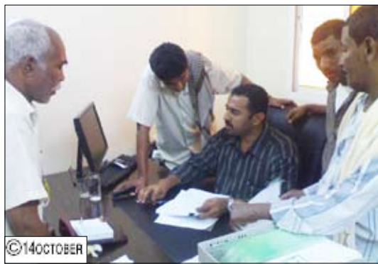
مدير صندوق التعويضات يفحص ملفات المتضررين

تجدر الإشارة إلى أن صندوق الإعمار بساحل حضرموت عمل بتوجيهات رئيس الجمهورية فيما يخص إغلاق ملف عدد من القطاعات المتضررة ومنها السمكي والكلبي والجزني .