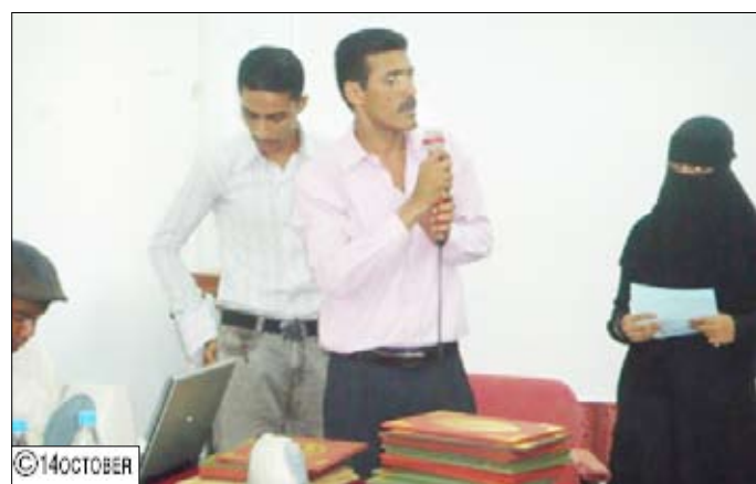
مدير برنامج الإيدز يلقي كلمة

وحضر في ختام الحفل تكريم السلطة المحلية بالمحافظة والمديرية ومكاتب التربية والصحة ومدير المعهد الصحي ومدربي المدارس الثانوية التي شارك طلابها وطلقاتها في الدورة والمدربين والمتدربين