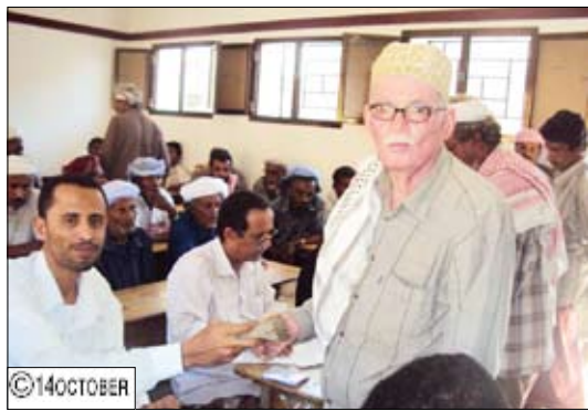
توزيع التعويضات للمتضررين