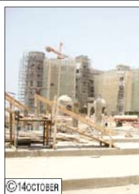
مشروع فندق القصر

تستكمل قبل الموعد المحدد لعملية الفحص والتشغيل للمشروع . وأشار مهندس المشروع إلى أن المشروع يتكون من (119) شقة بأنماط ثلاث غرف وغرفتين وتشتمل كل شقة خدمة المطبخ والحمامات وصالة المعيشة كما يحتوي المشروع على مطعم تقدم فيه الأكلات الشرقية والمأكولات المختلفة كما يوجد ضمن المشروع الملاعب والصالات الرياضية والحمامات البخارية . بالإضافة إلى امتلاك المشروع مسجداً سعة ألفي متر مربع وملعب الجولف والمساحات الخضراء وكل ما يمكن أن يقدمه مشروع (5) نجوم .