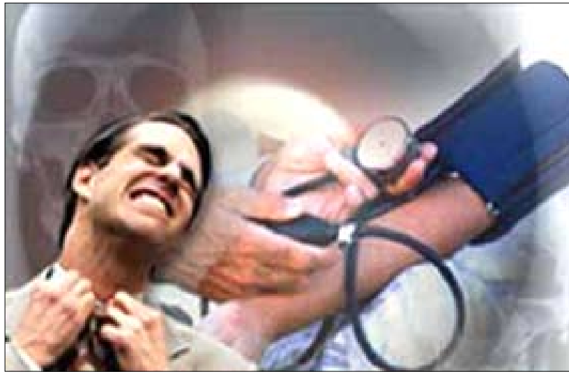
التدخين يسبب الأزمات القلبية والدخات الصدرية