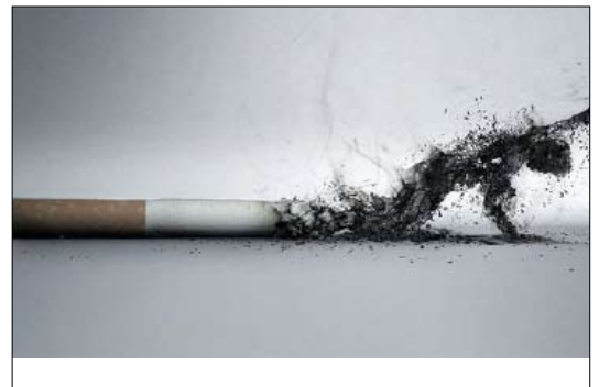
هذه هي حياتك وهذا اختيارك

ويعد هذه المعاناة، يجيب الحلالي عن قصة إقلاعه بإرادة خفية لا بمبادرة ذاتية وبعد عشرين عاما من الارتباط بالتدخين وعذب السيجارة قرر أخيراً الإقلاع عنه بعد عتاب حاد وتهديد بظهور الأزمات الصدرية المتتالية على حياته واقتراح محتمل لموت الشاب الحلالي الذي يتمتع بروح مرحة وخيال طموح لبناء مستقبل