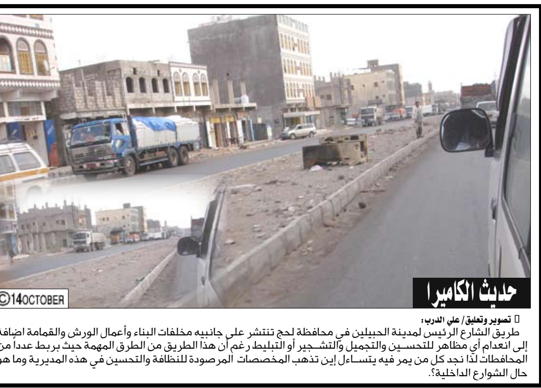
حدث الكاميرا: طريق الشارع الرئيس لمدينة الحبيلى في محافظة لبح تنتشر على جانبيه مخلفات البناء وأعمال الورش والقمامة اضافة إلى انعدام أي مظاهر للتحسين والتجميل والنشجير أو التبليط رغم أن هذا الطريق من الطرق المهمة حيث يربط عددا من المحافظات لذا نجد كل من يمر فيه يتساءل أين تذهب المخصصات المرصودة للنظافة والتحسين في هذه المدينة وما هو حال الشوارع الداخلية؟