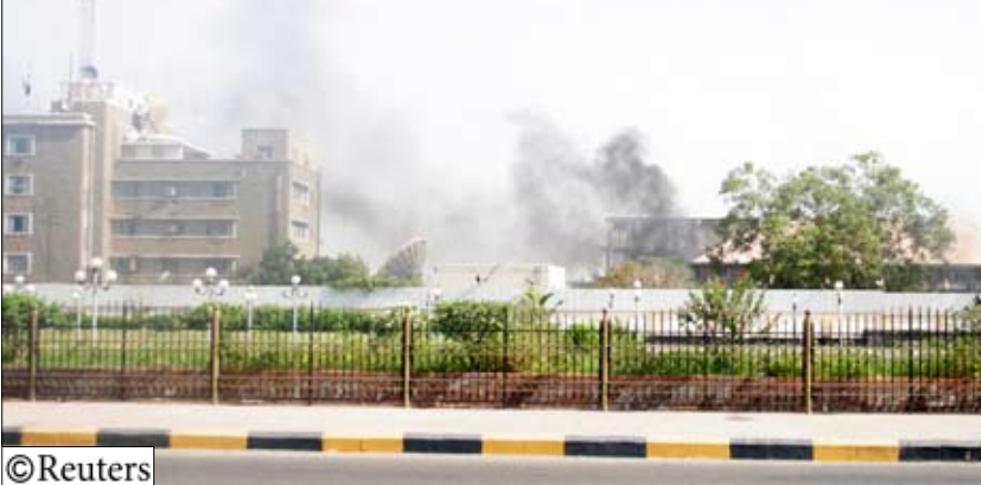
الدخان يتصاعد من مبنى الأمن السياسي بعدن أمس

■ صنعاء / سبأ : عقدت اللجنة الأمنية العليا أمس اجتماعا لها ناقشت فيه العديد من القضايا المتعلقة بالأمن السياسي بالمحافظة وأطلقت الرصاص والقنابل على الحراسات الأمنية. وأثناء تبادل إطلاق النار استشهد سبعة أفراد من الأمن و3 نساء وطفل عمره سبع سنوات ابن إحدى موظفات مكتب الأمن، حيث أقدمت العناصر الإرهابية على إطلاق الرصاص مستهدفة الحراسات وعشوائيا على من كانوا بجانب ودخل المبنى.