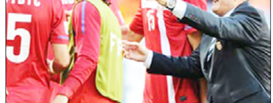
رادومير أنتيتش مع لاعبي المنتخب الصربي

وختم "على الرغم من كل شيء، فإني واثق من قدرة فريقنا على بلوغ الدور الثاني".