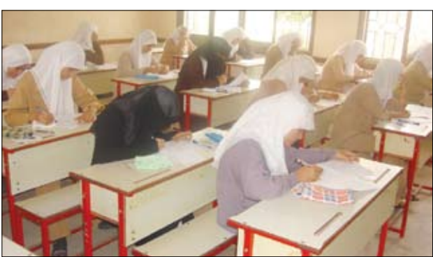
من الامتحانات في مدارس التعليم الأساسي