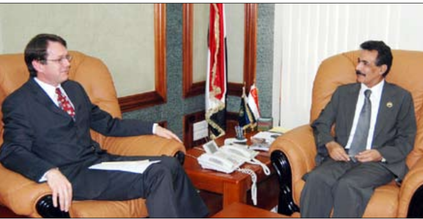
وزير الداخلية لدى لقائه السفير البريطاني

البريطاني واليمني المشترك في إعداد الدراسات لهذا المشروع المهم.. وكذا بمستوى التعاون والدعم الذي تقدمه بريطانيا لليمن في الجانب الأمني، وفي مختلف المجالات التنموية. مؤكداً أن هذا الدعم يحظى بتقدير الحكومة والشعب اليمني.