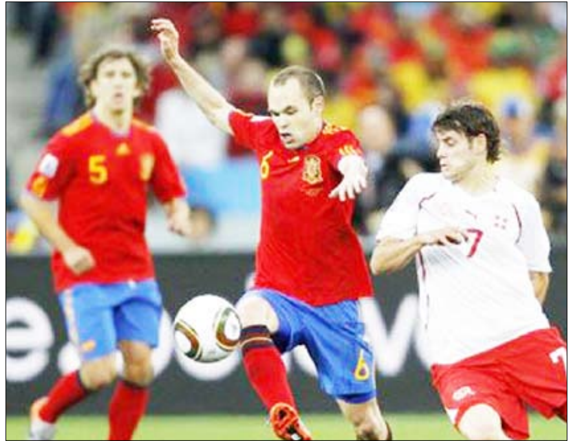
لقطات من مباراة سويسرا وإسبانيا