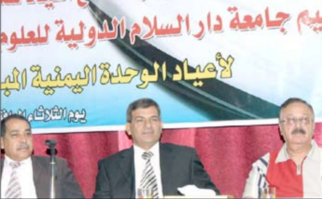
مهرجان شعري بمناسبة العيد الوطني بجامعة دار السلام

صنعاء / سبأ: نظمت جامعة دار السلام الدولية أمس بصنعاء مهرجانها الشعري السنوي الأول بمناسبة العيد الوطني الـ 22 للجمهورية اليمنية (22 مايو). وفي المهرجان تغنى 12 شاعراً يمينياً وعراقياً من طلبة الجامعة بالوحدة اليمنية والانتخابات التمهيدية التي تحققت للشعب اليمني خلال العقدين الماضيين في ظل قيادة باني نهضته الحديثة فخامة الأخ الرئيس علي عبدالله صالح رئيس الجمهورية. وأكد الشعراء أن الوحدة اليمنية هي البنية الأساسية للوحدة العربية ويجب الحفاظ عليها من المؤامرات التي تحاك لها، وإنها تعد مصدر قوة للعرب في ظل الأوضاع العربية الحالية. وفي الحفل أكد رئيس الجامعة بالوكالة الدكتور كريم زغير أسبود أن الوحدة اليمنية عام 90م جاءت كمؤشر لبعث الأمل في إعادة طرح المشاريع الودودية العربية خاصة مع ظهور التكتلات الإقليمية والدولية والمتغيرات في موازين القوى الدولية والتحديات الإقليمية التي تواجهها الدول العربية. وقال «إن الوحدة اليمنية أرضاً وشعباً هي ضرورة وطنية لا يستطيع الشعب اليمني أن ينعم بالاستقرار والرخاء إلا وأن يحتفظ بسيادته الحقيقية الكاملة إلا في ظلها بقيادة باني نهضة اليمن فخامة الرئيس علي عبدالله صالح رئيس الجمهورية». مستعرضاً توحيد الشعب اليمني عبر تاريخه القديم، إذ تميز اليمن بوحدة البناء الاجتماعي والحضاري والثقافي والديني. ورفع المشاركون في المهرجان برقية شكر وتقدير لفخامة الأخ رئيس الجمهورية لرعايته للإبداع والمبدعين ودعمه للتعليم العالي وما تحقق لليمن في عهده من مكاسب ومنجزات تنموية وديمقراطية.