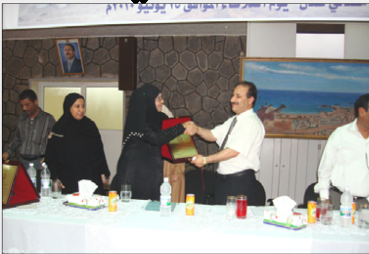
تكريم مدير ونائب مدير مصافي عدن