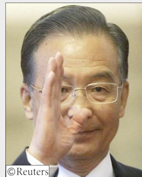
رئيس الوزراء الصيني ون جيا باو