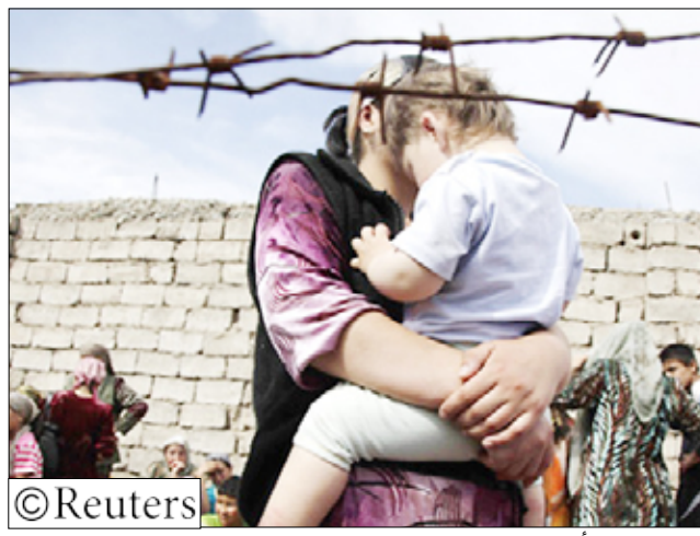
سيدة أوزبكية بقرغيزستان تنتظر مع طفلها السماح بالمرور إلى أوزبكستان