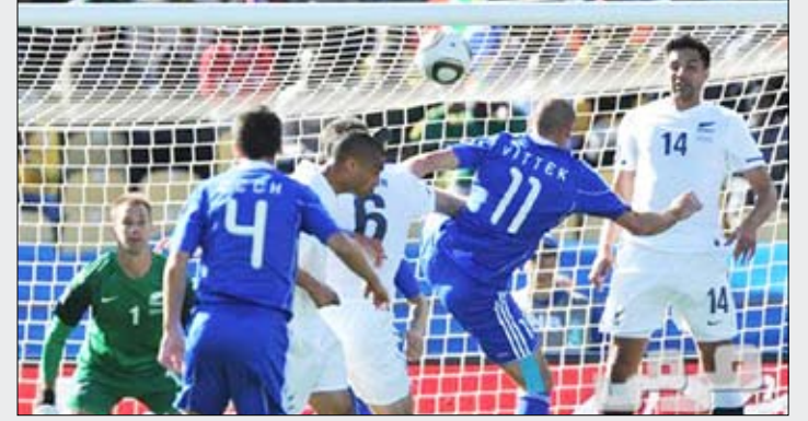
لقطات من مباراة منتخب نيوزيلندا وسلوفاكيا