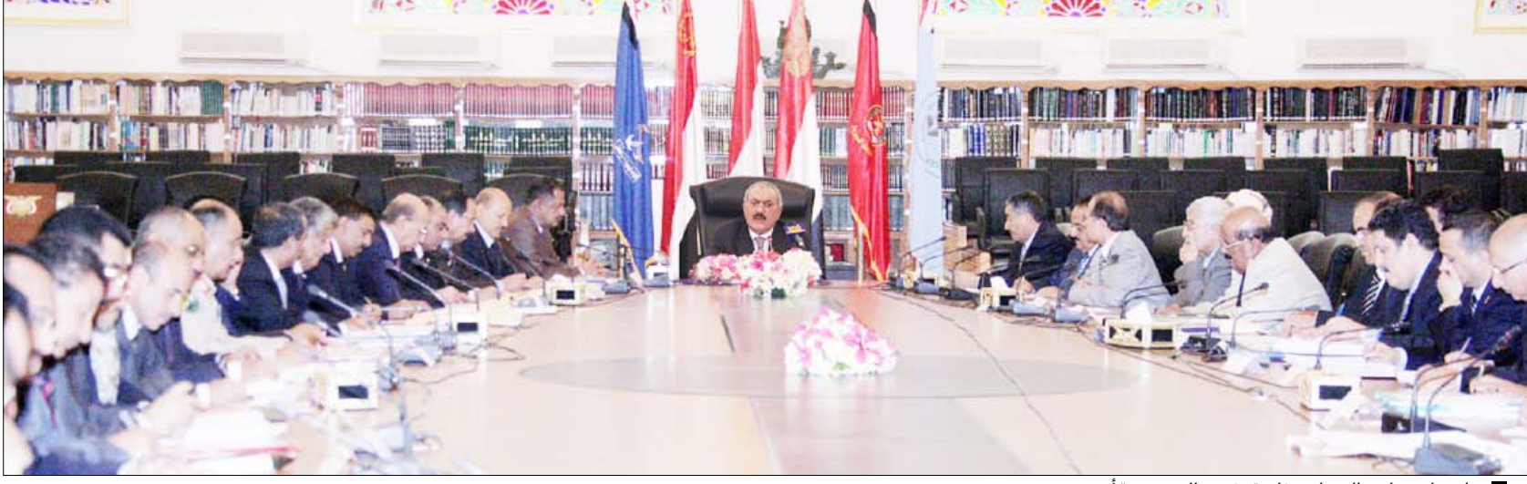
اجتماع مجلس الوزراء برئاسة رئيس الجمهورية أمس

صنعاء / سيا: رأس فخامة الأخ الرئيس علي عبدالله صالح رئيس الجمهورية اجتماعاً لمجلس الوزراء بحضور رئيسي مجلسي النواب والشورى وعدد من مستشاري رئيس الجمهورية. وفي الاجتماع أكد فخامة رئيس الجمهورية على أهمية المضي قدماً في جهود الإصلاحات الاقتصادية والإدارية والعمل على ترشيح الإنفاق في كافة المجالات وضرورة قيام الحكومة بتقديم دراسة علمية متكاملة حول سياسة دعم المشتقات النفطية والتي يبلغ حجم الإنفاق فيها حالياً أكثر من 510 مليارات ريال سنوياً. ووجد فخامته دعوته إلى الحوار الجاد والمسؤول ولما يخدم مصلحة الوطن مؤكداً أن الحوار سيظل هو الوسيلة