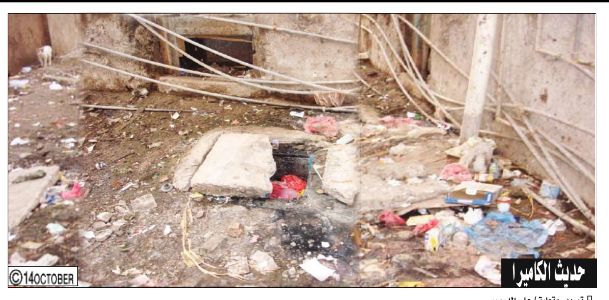
تصوير وتعليق / علي الدرب : هذه المناظر منتشرة داخل جلالى من البنايات القديمة في عدن وهذه الصور لبعض منها في شارع الشهيد مدرم بالمعلا وسببها اصرار بعض السكان على رمي القمامة والمخلفات فيها إضافة إلى إهمال الجهات المختصة والمسؤولة عن صيانة توصيلات المياه والمجاري ونقاط توزيع المجاري التي أصبح أغلبها بدون أغشية تنمى أن نرى حملة واسعة لإصلاح وترميم توصيلات المياه والمجاري رحمة بالسكان والبنايات وعمال النظافة الذين يبذلون جهوداً كبيرة للتخفيف من مضاعفات ذلك.