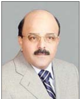
علي حسن الشاطر

القرار والفعل الوطني، وتؤكد على هيبة وقوة الدولة ككيان مؤسسي جامع لكل شرائح المجتمع، وقائم على التطور والنهوض الحضاري المتواصل واستغلال الطاقات والقدرات والإمكانات المادية والروحية للمجتمع، ومثل هذا التوجه إنما يؤكد على أهمية البعد الوطني في معالجة القضايا الوطنية ودخل الأرض اليمنية.. ويقطع بشكل مبكر - الطريق أمام مساعي بعض الأطراف الداخلية والخارجية لتدويل الإشكالات الداخلية ومحاولة البعض من أصحاب الأصوات النشاز الاستقواء بالخارج لتحقيق مكاسبه ومشاريعه الخاصة على حساب مصالح الوطن وبالتالي إغلاق كافة القنوات أمام التدخلات الخارجية التي غالباً ما تكون مشروطة بأهداف مريبة ووفق أجندة ومصالح قوى التدخل الخارجي.. فالانتماء الوطني الحقيقي يرفض التبعية والإملاءات والتدخلات الخارجية أياً كان شكلها أو سلوكها وأدواتها العملية، فهي مدعاة للخلة وحدة النسيج الوطني وتمرير المشاريع الصغيرة، ويستفحل خطرهما على المجتمع وتجعل قواه في حالة استلاب دائم وغير متفاعلة مع قضايا الوطن بشكل مباشر.. فالمبادرة في هذا المجال لها بعدان رئيسيان: - الأول: فتح المجال واسعاً أمام كل القوى الوطنية للمشاركة في حوار وطني مسؤول. - الثاني: قطع الطريق أمام المزادات والدعوات الانتهازية التدميرية التي تجعل كلمة الحوار ستاراً لأهدافها؛ ومنعاً للصفقات السياسية التي تكون على حساب الوطن أو بعض الأطراف الوطنية.