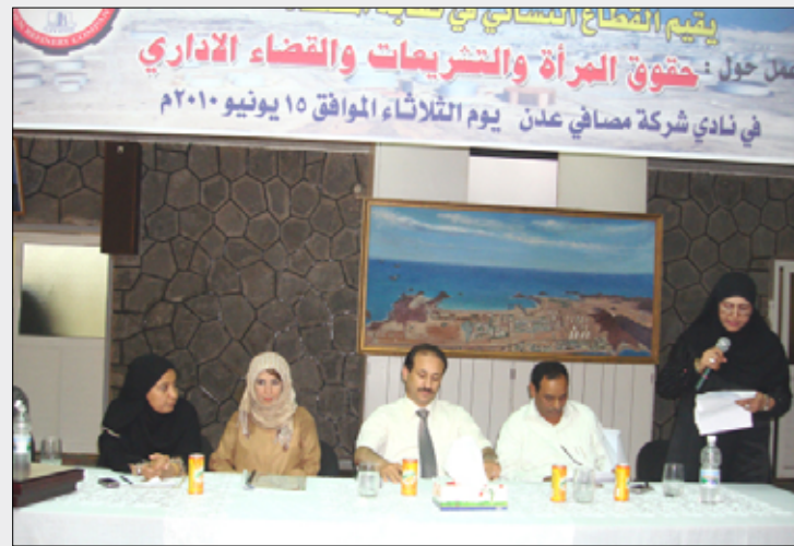
خلال افتتاح الورشة