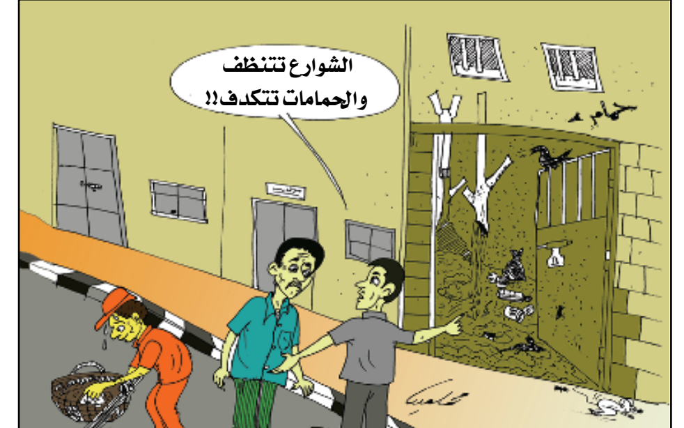
الشوارع تتنظف والحمامات تتكدف !!