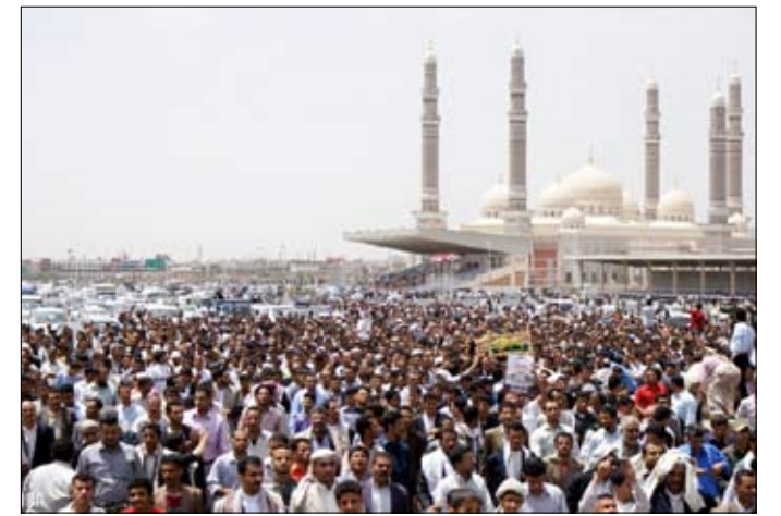
خلال تشييع جثمان الإعلامي يحيى علاو