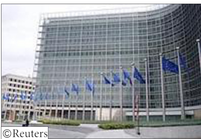
مقر الاتحاد الاوربي

بسياسة الإغلاق أمل بشدة أن تحصل في الأيام القادمة على الالتزام الذي نطلبه من حيث المبدأ، ثم يتم اتخاذ خطوات أيضا، في إشارة إلى الخطوات الإسرائيلية لتخفيف الحصار.