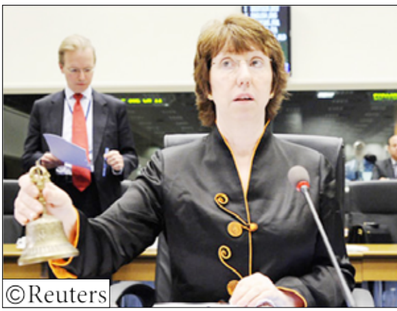
أشتون عرضت إجراء محادثات مباشرة مع إيران ولوحث بفرض مزيد من العقوبات