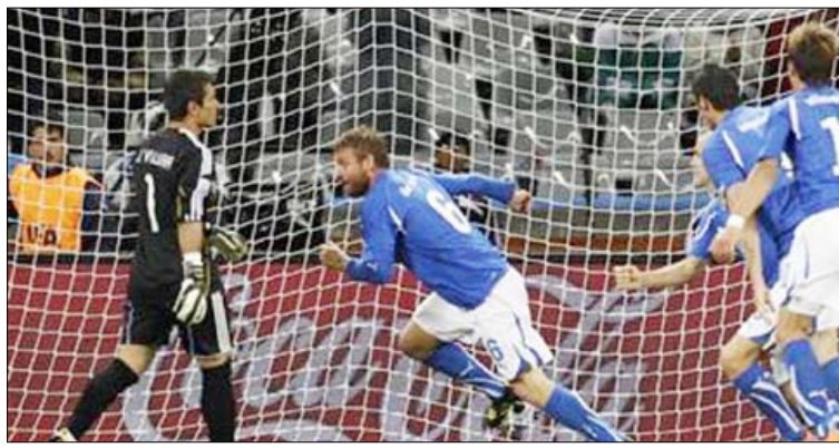
هدف التعادل الإيطالي في مرمرى الباراجواي