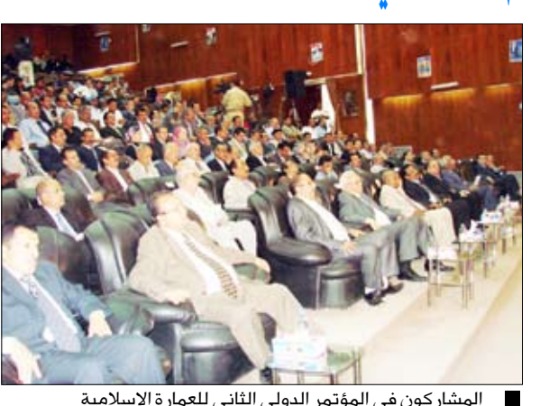
المشاركون في المؤتمر الدولي الثاني للعمارة الإسلامية أعظم أمانيتها في وحدة راسخة ونهضة شاملة وديمقراطية حقيقية. كما نقدر عاليًا وعيكم الكبير واستجابتكم للنداء العلمي الذي

رفع المشاركون في المؤتمر الدولي الثاني للعمارة والفنون الإسلامية الذي اهتم أعماله أمس بصنعاء برفية شكر وعرفان إلى فخامة الرئيس علي عبد الله صالح رئيس الجمهورية على جهوده المشهودة في خدمة الأمة ووعايتة الكريمة للمؤتمر الذي نظمته رابطة الجامعات الإسلامية واستضافته جامعة صنعاء لمدة يومين، جاء فيها: "فخامة الرئيس علي عبد الله صالح رئيس الجمهورية: ونحن ننتهي أعمال المؤتمر الدولي الثاني للعمارة والفنون الإسلامية الذي انعقد في صنعاء عاصمة الجمهورية اليمنية ذات التاريخ العريق ومدينة الثوابت الراسخة الثورة والجمهورية والوحدة والديمقراطية ونظمتها رابطة الجامعات الإسلامية وجامعة صنعاء، نتوجه إلى فخامتكم