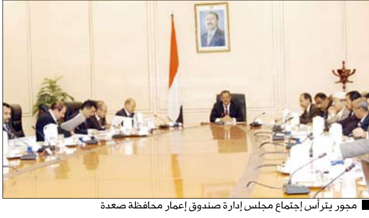
مجور يترأس إجتماع مجلس إدارة صندوق إعمار محافظة صعدة

استعرض مجلس إدارة صندوق إعمار محافظة صعدة في اجتماعه أمس برئاسة رئيس مجلس الوزراء الدكتور علي محمد مجور تقرير الإدارة التنفيذية للصندوق عن نشاطه في مختلف الجوانب الإجرائية والفنية ذات الصلة بعملية إعادة الإعمار وذلك وفقاً للمهام والوظائف المحددة في قرار إنشائه. وأشاد المجلس بالأعمال الميدانية والفنية التي ينجزها الصندوق في إطار عملية إعادة إعمار ما خلفته فتنة التمرد. وجدد المجلس التأكيد على البدء الفوري بإعادة إعمار مدينة صعدة في ضوء نتائج الحصر النهائي واعتبارها الأولوية في نشاط الصندوق خلال هذه الفترة إلى جانب إعادة إعمار المرافق الحكومية وفي المقدمة مقرات السلطة المحلية. وافق المجلس على المقترحات الخاصة بتعزيز الصلاحيات للإدارة التنفيذية للصندوق وإعطائها المرونة اللازمة في عملها اليومي.. مشدداً على الإدارة التنفيذية الالتزام الكامل بالوظيفة الرئيسية للصندوق المتمثلة في إعادة إعمار ما خلفته حرب الفتنة وعدم الدخول في أي مجال خارج هذا الهدف.