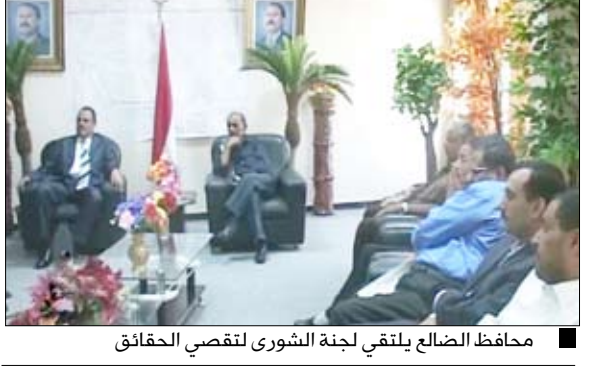
محافظ الضالع يلتقي لجنة الشورى لتقصي الحقائق

كرس اللقاء المكلف من مجلس الشورى بالتحقيق وتقصي الحقائق عن الأحداث التي وقعت في مدينة الضالع الاثنين الماضي مع قيادة المحافظة والهئية الإدارية للمجلس المحلي برئاسة المحافظ علي قاسم طالب المناقشة أسباب وتدابير تلك الأحداث والإجراءات العملية والتنفيذية لتقصي الحقائق ومعرفة المتسببين فيها. واستمعت لجنة الشورى برئاسة