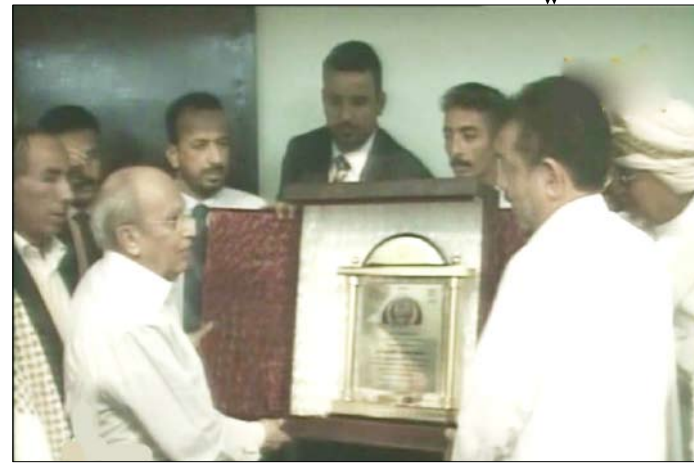
د. الإيراني يكرم بعض المستثمرين

أشاد المستشار السياسي لرئيس الجمهورية الدكتور عبد الكريم الإيراني بـ دور القطاع الخاص في محافظة حضرموت وإسهاماته الإيجابية في حركة الاستثمارات في مختلف القطاعات الواعدة.