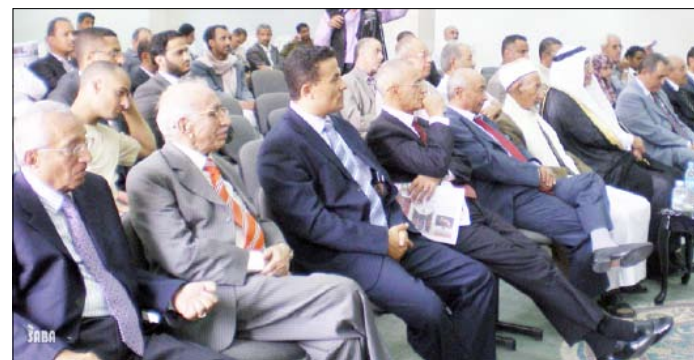
جانب من المشاركين خلال التوقيع على الكتاب

من حيث الإخراج والطباعة. ويتناول الكتاب الذي جاء في 390 صفحة من القطع المتوسط وصدر عن منتدى النعمان وأحتوى الكتاب على تقديم مقدم من الرئيس علي عبدالله صالح مدير أمن محافظة عدن أشار فيه إلى أنها أول دراسة علمية أكاديمية تاريخية متخصصة تصدر في اليمن تتناول بالدراسة والتحليل الدور القيادي الذي