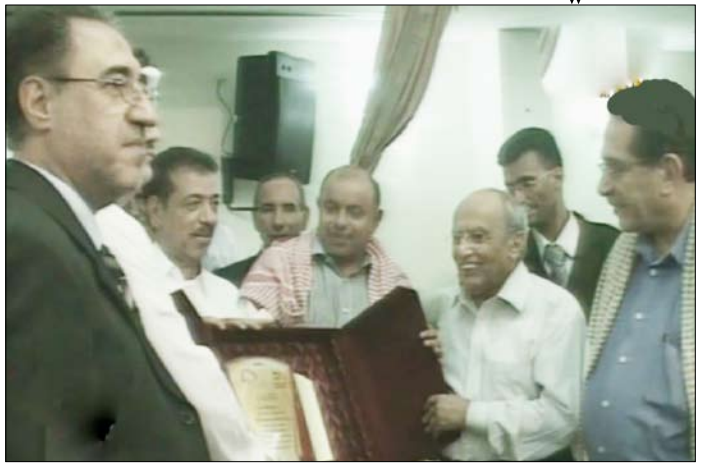
د. الإيراني يكرم بعض المستثمرين

وأثنى على المشروع الاستثماري (الملأ مول) الذي سيكون من أكبر المشروعات التجارية والتسويقية في الوطن بعد