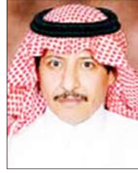
محمد عبد اللطيف آل الشيخ

يفعله أو يقوم به سواء من الأيوبي أو المحاميين أو الوسطاء (السماسرة)، مؤكدا أن الأب الذي يزوج ابنته القاصر لرجل في عمر جدها يعتبر (فأسقا)، وتسقط ولايته على أبنائه). والمحسن والمؤسف في الوقت ذاته أن كثيرا من فقهاءنا (المتكسبين) ما زالوا يصرون على أن زواج القاصرات شرعي، وأن مجرد تقييده بسن معينة (خطأ) ولا يستقيم مع تعاليم الدين؛ والفتاوى في هذا الشأن مشهورة. وكانت سمو الأميرة حصة بنت سلمان بن عبدالعزيز، الناشطة في حقوق الإنسان، قد نشرت قبل فترة بحثا مؤصلا راعيا عن زواج القاصرات، طالبت فيه بوضع حد لمثل هذه الممارسات التي لا تمت للإنسانية بصلة، وقد لاقى هذا البحث أصداء إيجابية واسعة.