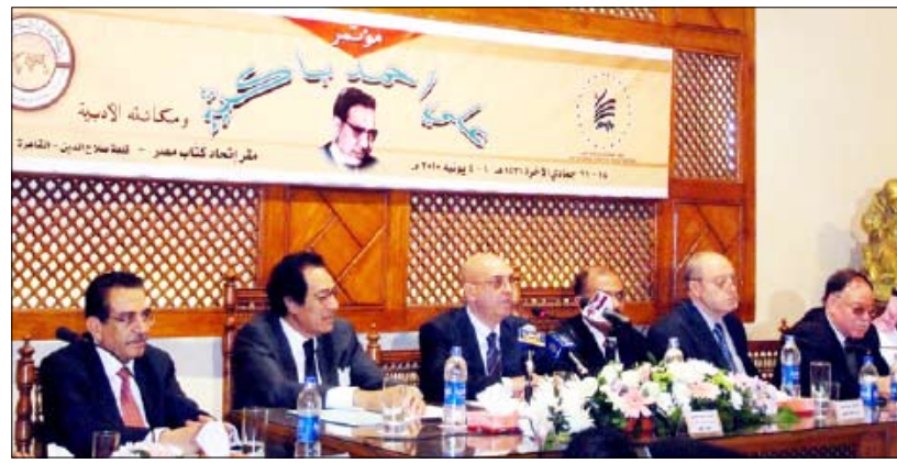
وزير الإعلام والثقافة خلال المؤتمر الدولي للذكرى المئوية لميلاد باكثير

عاد إلى صنعاء يوم أمس الجمعة وزير الإعلام حسن أحمد اللوزي بعد مشاركته في المؤتمر الدولي للذكرى المئوية لميلاد الشاعر والروائي والكاتب الكبير علي أحمد باكثير الذي عقد بالقاهرة. وقال اللوزي إن المؤتمر شهد مشاركة واسعة من عدد كبير من كبار المفكرين والأدباء العرب وغيرهم وأن فعاليات المؤتمر كانت متعددة يتعدى جوانب شخصية المحقق به خاصة فيما يتعلق بفكره وإنتاجه المتنوع سواء على صعيد الشعر والمسرح والرواية وكذا كتاباته الصحفية. معتبرا أن هذه التظاهرة مثلت واحدة من صور الوفاء والتقدير للرجال الأفاضل الذين قدموا الكثير إلى مسيرتنا الثقافية وأسهموا في التنوير في فترة عصيبة من تاريخ الأمة.