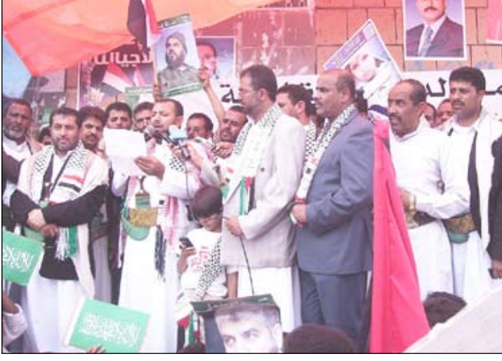
تظاهرات جماهيرية احتجاجية حاشدة بالاعتداء على أسطول الحرية