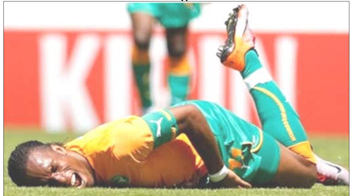
الإيفواري دروغبا يتألم بعد سقوطه