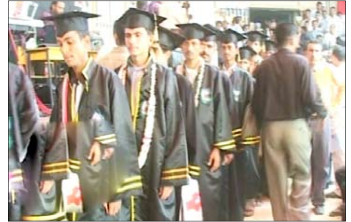
جانب من خريجي كلية المجتمع بعنس

واستقراره. إلى ذلك دشّن وزير التعليم الفني والتدريب المهني ومحافظ حجة فعالبيات المعرض العلمي الثقافي الأول للإبداع والمبدعين، الذي تنظمه كلية المجتمع على مدى أسبوع.