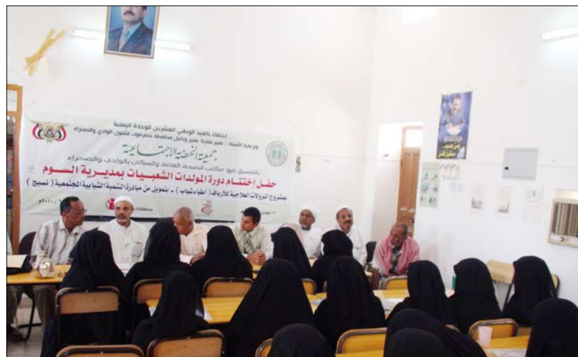
خلال دورة القبالات