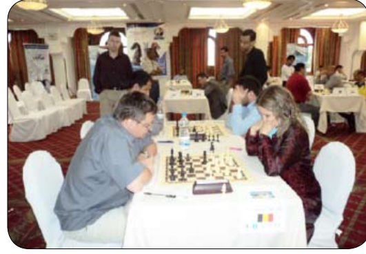
لقطات من منافسات البطولة