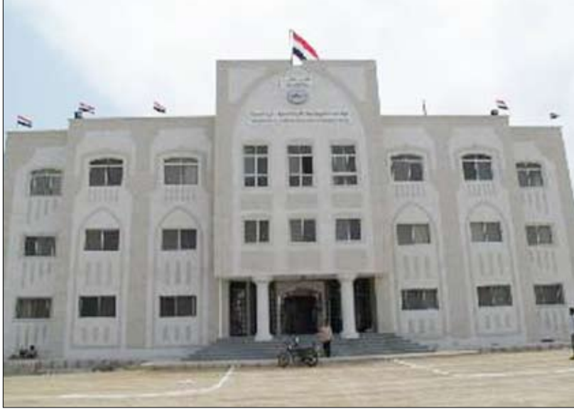
مبنى هيئة المساحة الجيولوجية في المكلا

التعدين في اليمن المرحلة الثانية الذي ينفذ بالتعاون مع مؤسسة التمويل الدولية التابعة للبنك الدولي.