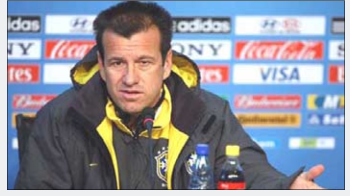
المدرّب البرازيلي دونغا