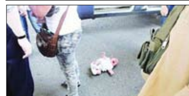
مروعة حيث رمت بطفلها على الأرض

كانت تلك لحظة مروعة للغاية عندما قذفت امرأة اتهمت بسرقة هاتفها جوال في الصين بطفلها على الأرض ودأست عليه في مدينة زينغهاو باقليم هونان الشرطي وحاول تهدئة السيدة المتهمة وهي تحمل طفلها ووقع الحادث البشع بعد أن اتهمت طالبة بالثانوية المرأة وصديقتها وكانت كل منهما تحمل طفلًا عينا بسرقة هاتفها الجوال وتحولت المواجهة إلى تشارك بالأيدي بعد استدعاء الشرطة التي وصلت بصحبة بعض أقارب الطالبة. وقام أحد الأقارب بدفع إحدى المتهمتين واستجابت المتهمة بطريقة