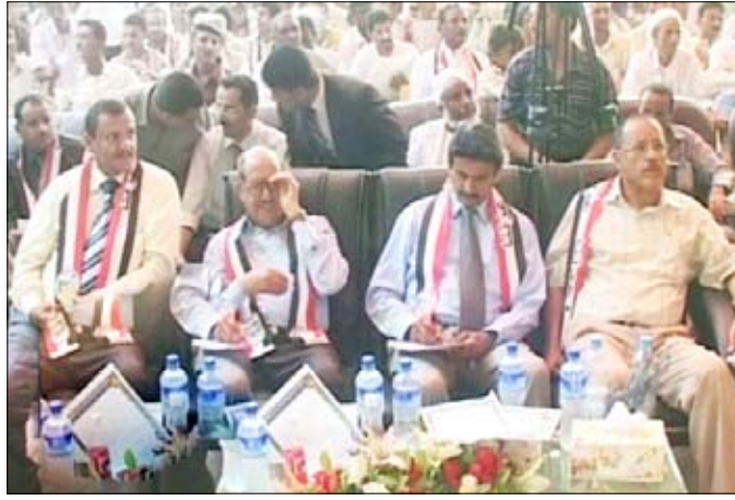
وزير التعليم الفني يحضر حفل التخرج