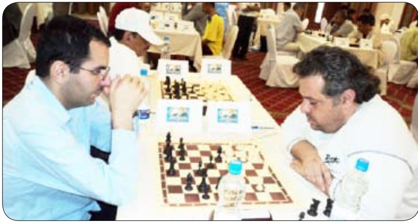
من منافسات البطولة

تعز/ نعام خالد : تواصلت يوم أمس منافسات بطولة الرئيس الصالح الدولية التاسعة للشطرنج التي ينظمها الاتحاد العام للشطرنج بمشاركة 20 دولة يمثلها أبطال اللعبة الدوليون الذين يتنافسون على كأس البطولة وجوائزها التي بلغت أربعة ملايين ريال وتقام في قاعة فندق السعيد بالعاصمة. الجولة الرابعة التي جرت مقابلتها مساء أمس اسفرت عن تصدر الجورجي ميراب جاجوناشفيلي قمة الترتيب برصيد ( 4 ) نقاط كاملة بعد فوزه على الدولي اليمني زندان الزنداني فيما حل خمسة لاعبين دوليين في المركز الثاني برصيد 3 ، 3 نقطة وهم : - سيرجي فيدوروشوك - ستاتيسلاف سافشينكو - فاديم مالاخاتكو - سيرجي فولكوف - فيدوروف اليكسي لم تكن النتائج بعيدة عن توقعات المتابعين للبطولة التي دخلت مرحلة التنافس والقوة حيث أكد الكبار انهم كبار وان كعبهم عال و تفوقهم واضح على الاخرين ولم يكن هناك أي شي يظهر ان المفاجآت قادمة رغم أن المؤشرات تبين بوجود