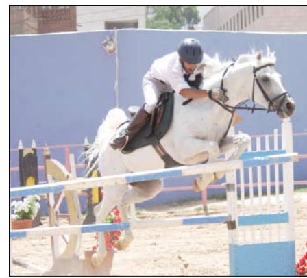
لقطات من الفروسية

يتم استبعاد الفارس ولا يحق له العودة في المرحلة الثانية وسوف يدخل الفرسان الذين سبق لهم القفز بنجاح وسوف يكون عدد المحاولات 4 محاولات. ويتألف المسلك الأساسي من أربعة حواجز الأول قائم 110سم، والحاجز الثاني أوكسر 120 سم، والحاجز الثالث مدرج 130 سم، والحاجز الرابع جدار (حائط) 125سم. بعد ذلك سيتم تكريم الفائزين في المراحل الأربع من البطولة وذلك بحضور الأخ عبدالغني عبدالغني رئيس مجلس الشورى، والشهيد حمير بن عبدالله بن حسين الأحمر نائب رئيس مجلس النواب..