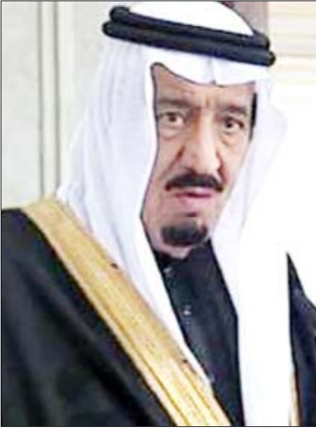
الأمير سلمان بن عبدالعزيز أمير منطقة الرياض

هذه أن تساعد على دعم وتقوية هذه العلاقات. ومن جانبه قال كلاوس بيننتر البرلماني الألماني إن «زيارة الأمير تؤكد مدى جودة العلاقات الثنائية وأنها مستمرة على الطريق الصحيح وستزداد قوة وكثافة». كما اجتمع الأمير سلمان مع وزير الخارجية الألماني الذي دعا لزيادة الاستثمارات الألمانية في السعودية، كما دعا لفتح الباب أمام وصول المساعدات لسكان غزة ولإزالة الغموض حول البرنامج النووي الإيراني، وأن تؤكد إيران أنها لا تسعى لامتلاك أسلحة نووية. وشملت جولة الأمير سلمان زيارة المتحف الإسلامي في برلين الذي يعد أقدم وأهم المتاحف الإسلامية في العالم، حيث أكد الأمير وعي المملكة بأهمية التعاون مع الجميع والتعاون مع الجميع.