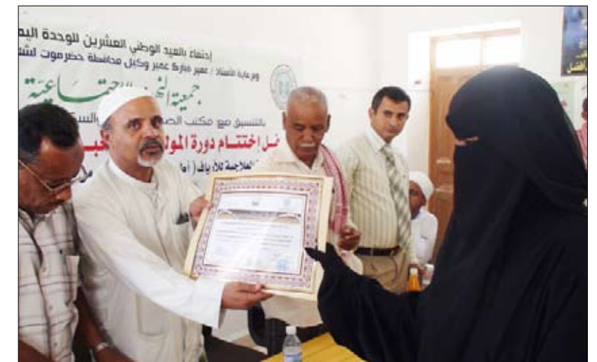
لمدى تكريم إحدى القبالات الشعيات

مهارات مختلفة حول بعض القضايا الصحية مثل (مبادئ التوليد النظيف وعوامل الخطورة التي تستوجب الإحالة للمستشفى والتعريف بالممارسات الشعبية الضارة بصحتها والمولود والتعريف بالبرامج الصحية الشاملة بصحتها وسلامتها).. وقدمت الشكر والتقدير إلى جمعية النهضة الاجتماعية بسبيلون لإقامتها العديد من الأنشطة المختلفة على صعيد خريجي السوم.