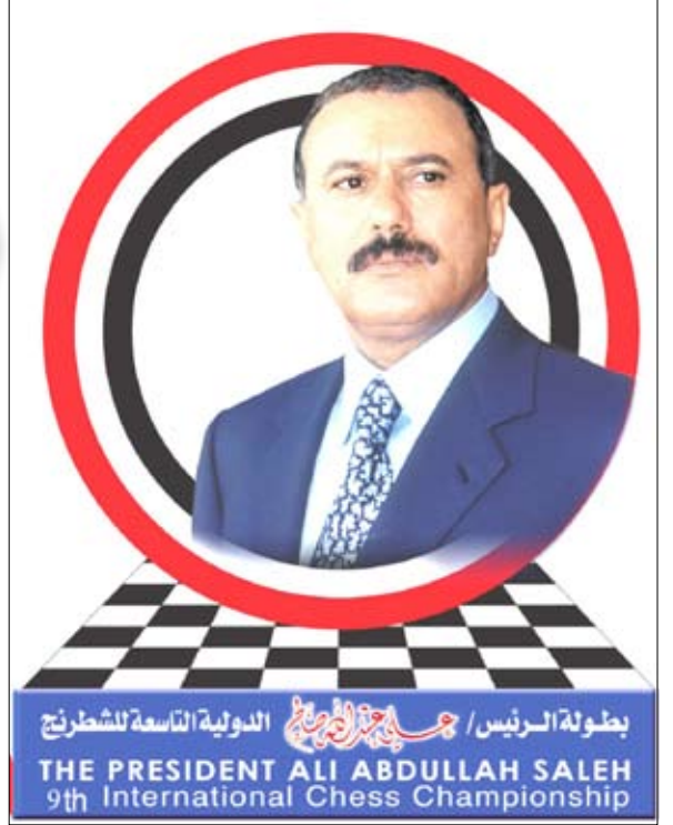
بطولة الرئيس / 9th International Chess Championship THE PRESIDENT ALI ABDULLAH SALEH 9th International Chess Championship