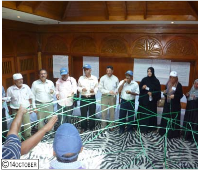
التواصل بين القيادات وفريق العمل