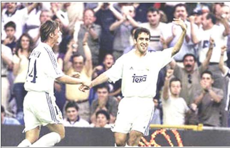
من مباريات الريال