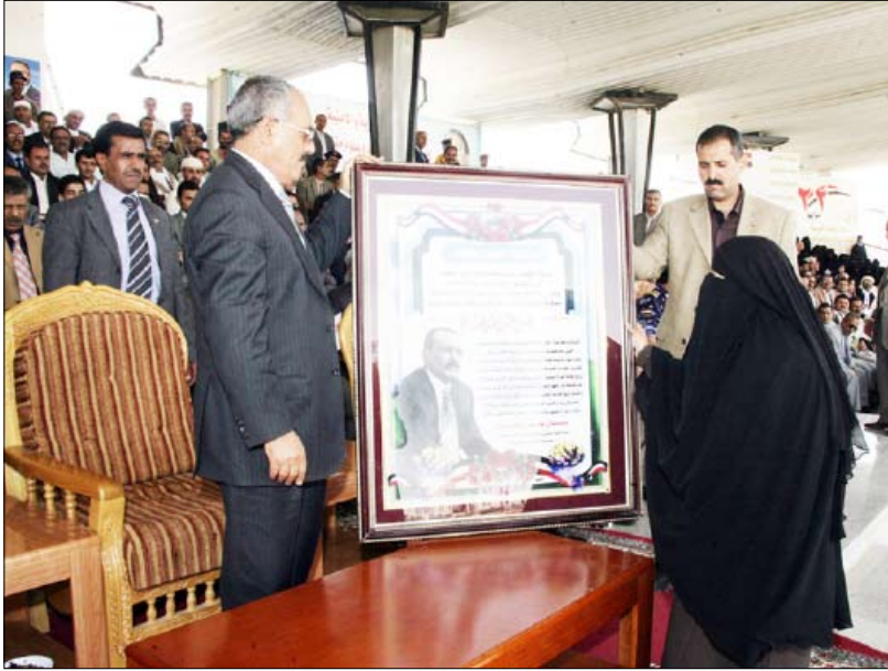
مدير عام تنمية المرأة بدمار تقدم وثيقة عهد من القطاع النسائي بالمحافظة

المناضلون هم من يستحقون الاحترام والتقدير أما بائعو الكلام فلا أحد يعيرهم أي اهتمام