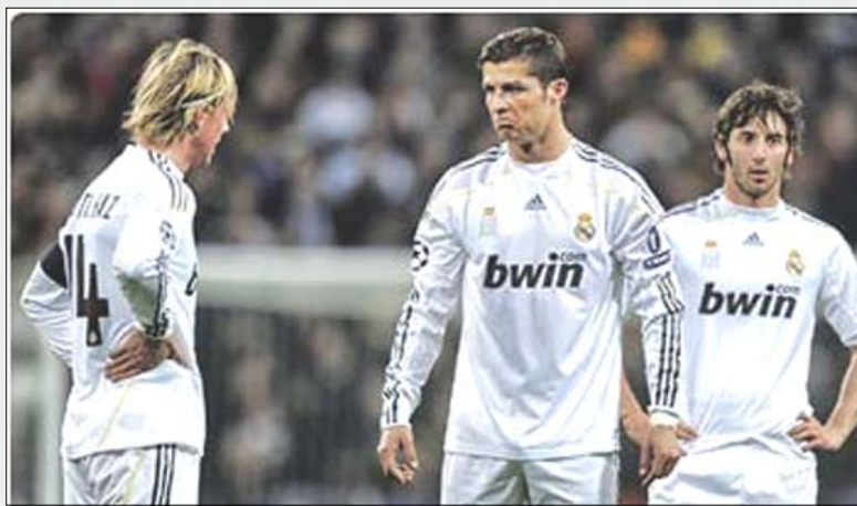
بعض لاعبي ريال مدريد

إن كثرة النجوم في فريق واحد لا يجعل منه فريقاً لا يقهر، بل أنه في حال عدم توظيف ذلك بصيغة جيدة من شأنه قهرة مستوى أي فريق كان، لأن نجوم الكرة كل منهم كان معتاداً ذات يوم على حمل مسؤولية فريق على أكتافه وهذه حال كل من كاكا مع ميلان وكريستيانو رونالدو مع مانشستر يونايتد وبنزيمة مع ليون، أما الآن فأين هم هؤلاء مع الريال؟