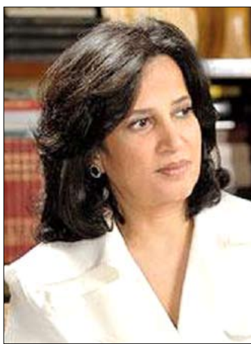
وزيرة الثقافة البحرينية

إدارة شؤون البلاد. ويعتقد مركز البحرين لحقوق الإنسان أن قرار المنع يرجع إلى سببين رئيسيين، أولهما أن وزيرة الإعلام الشخبة مي آل خليفة، التي قامت في وقت سابق بترجمة ونشر مقالات من يوميات بل . ريف بما يتوافق مع توجهات السلطة، وأخفت كل ما ينتقد السلطة الحاكمة في ذلك الوقت، وهذا الشيء الذي تجنبه هو الكتاب من خلال نقل الأحداث التاريخية، والسياسية، والقانونية المهمة التي أشار إليها المستشار في يومياته.