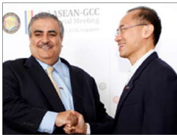
وزير خارجية البحرين مع وزير خارجية سنغافورة