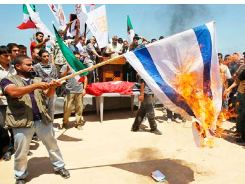
من مظاهر الغضب العالمي والعربي على القرصنة الاسرائيلية

لطاق غزة. وفي ختام المهرجان صدر بيان دعا إلى وقف المفاوضات المباشرة وغير المباشرة مع إسرائيل ما أقدمت عليه إسرائيل تجاه قافلة الحرية إرهاب وفك الارتباط وسحب اتفاقية السلام العربية ووقف جميع أشكال التطبيع مع الكيان الصهيوني المحتل. وتعريته أمام العالم.