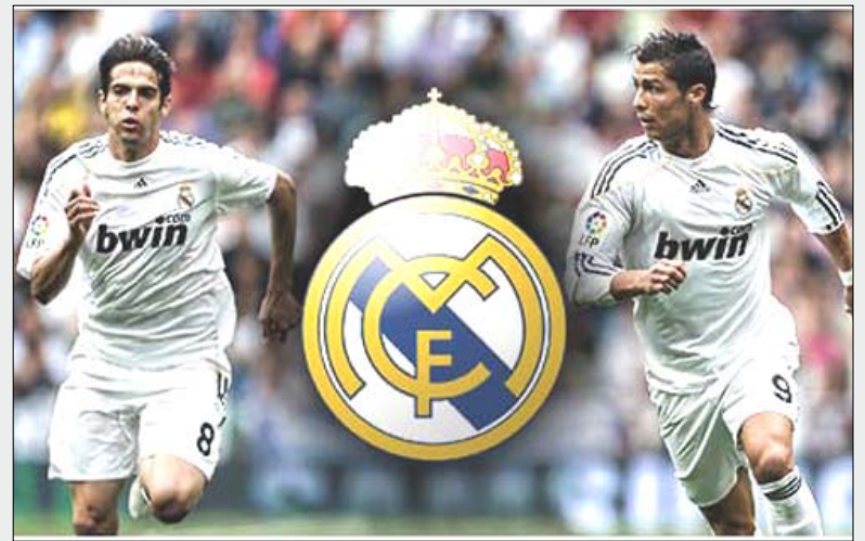
لاعبين في ريال مدريد

هذا الموسم كما كل مرة هي أسس غير متينة على الإطلاق والتي حولنا أن نلخصها في الآتي: