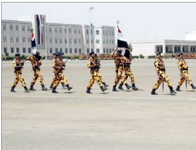
عرض لوحات رمزية من الدفعة