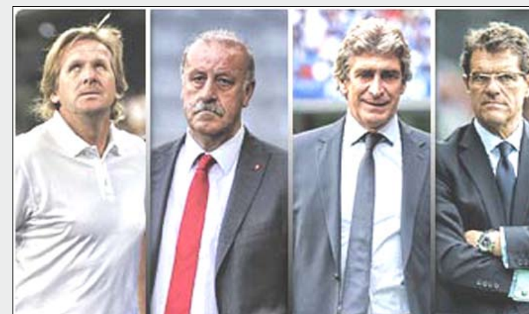
مدربون تعاقبوا على تدريب ريال مدريد

الخطأ الثاني التي تقع فيه إدارة النادي الملكي هو سياسة تبدل