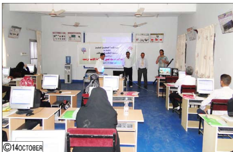
المدرسون في دورة مهارات البحث في الإنترنت