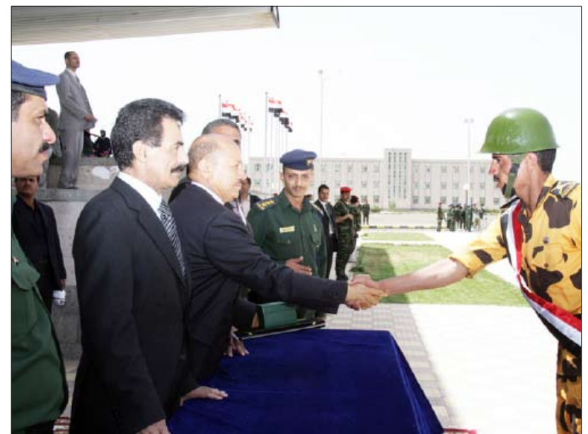
نائب رئيس الوزراء وزير الإدارة المحلية ووزير الداخلية ومحافظ ذمار خلال توزيع الشهادات والجوائز التقديرية على المتفوقين من الخريجين

وزير الداخلية: مركز تدريب الشرطة يضيء العديد من المراكز في الوطن العربي وعلى المستوى العالمي