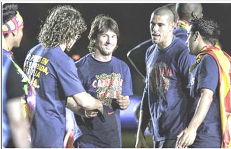
ميسي مع فريق برشلونة