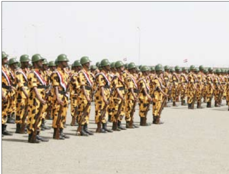
جانب من الدفعة الرابعة