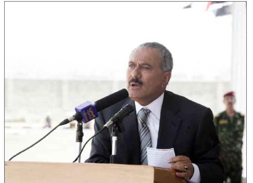
رئيس الجمهورية يلقى كلمة في حفل تخرج الدفعة الرابعة