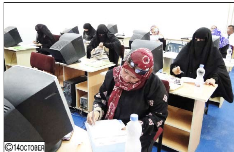
صحافيات يتدربن على مهارات البحث في شبكة الإنترنت