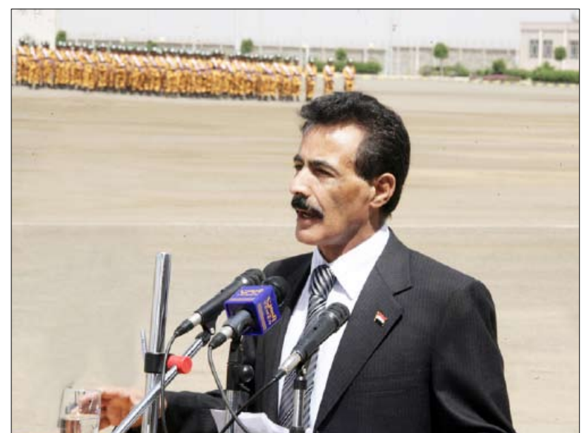
وزير الداخلية يلقي كلمة في الحفل

بمحافظة ذمار إلى فخامة الأخ رئيس الجمهورية، عبرن من خلالها عن تجديد العهد والوفاء للوطن وقائد مسيرته فخامة الأخ رئيس الجمهورية وفاء وتقديراً لما تحقّق للوطن من عطاءات وإنجازات وكذا ما نالته المرأة اليمنية في ظل راية الوحدة المباركة وعطاءات القائد علي عبدالله صالح من مكاسب مهمة على صعيد مشاركتها في مسيرة بناء الوطن.. مؤكّدت باسم كل نساء اليمن بأنهن سيبقيّن على نهج العطاء للوطن والحفاظ على مكاسبه وإنجازاته سائرًا.