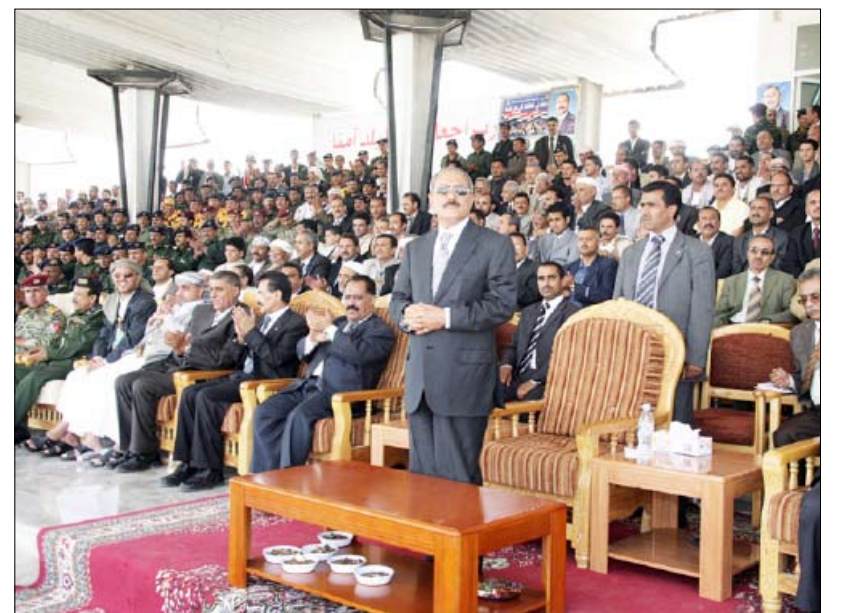
رئيس الجمهورية يشهد حفل التخرج