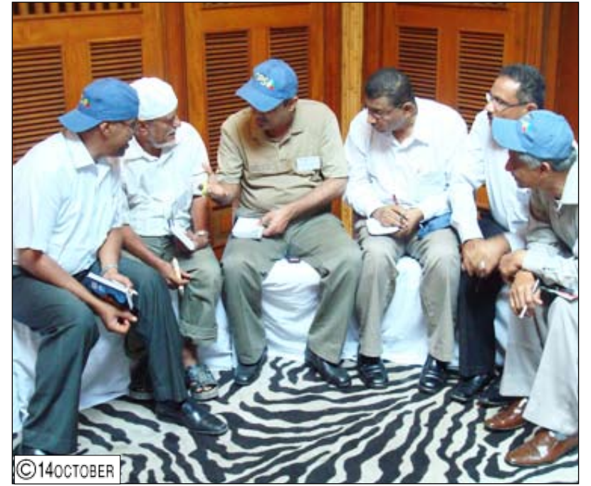
البنية الجماعية أساسها التعاون