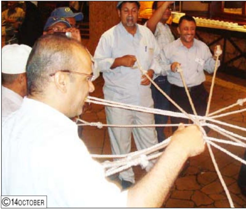
محافظ أبين مشارك في الدورات التدريبية