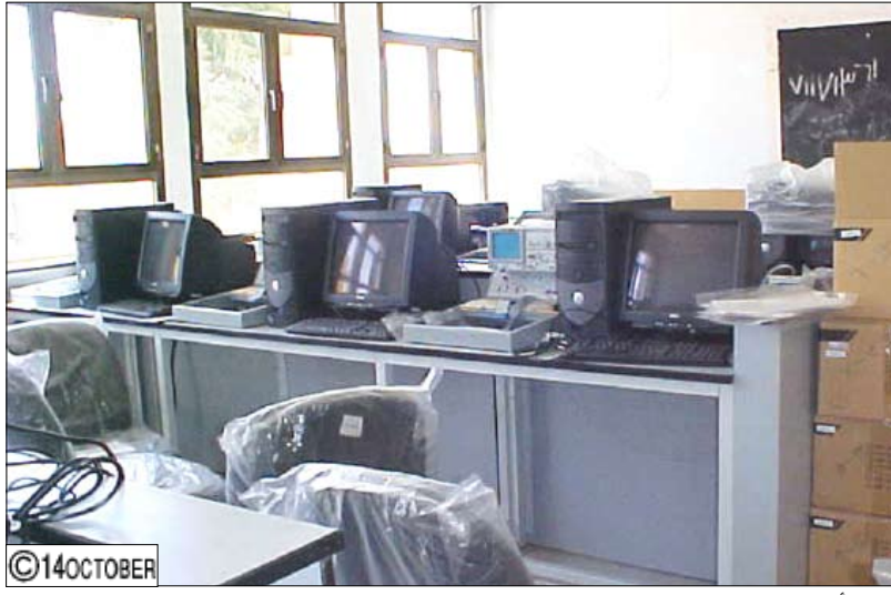
أجهزة الحاسوب المتطورة ومجال التدريب عليها