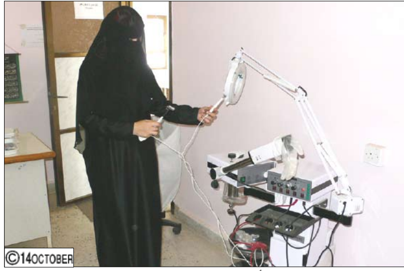
الفتاة اليمنية والتدريب على الأجهزة المتطورة