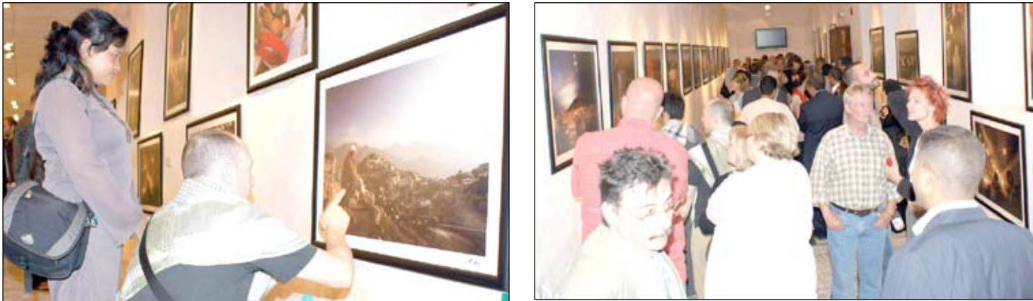
معرض « اليمن ما وراء الأخبار » للفنان الفوتوغرافي الفرنسي «جان لوبيز».