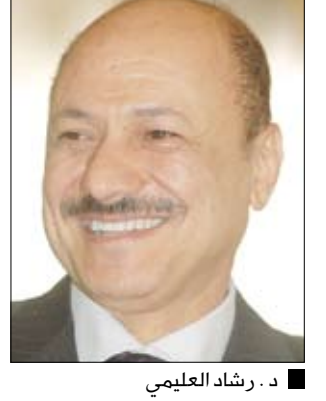
د. رشاد العليمي

عناصر تابعة لتنظيم القاعدة منتصف الأسبوع الماضي. من ناحية أخرى ذكرت صحيفة 26 سبتمبر أن الأجهزة الأمنية تكثف حالياً إجراءات ملاحقتها للعناصر التخريبية المسؤولة عن الاعتداءات المتكررة على أبراج وكابلات النقل الكهربائي من محطة مأرب الغازية وكذا المهتمون بتفجير أنبوب النفط. وأكد مصدر أمني أن أجهزة الأمن ستلاحق تلك العناصر لمحاكمتها وتقديمها إلى العدالة لثقل جزاءها الرادع جراء ما قامت به من أعمال إرهابية وتخريبية لمنشآت وطنية والإضرار بالاقتصاد الوطني.