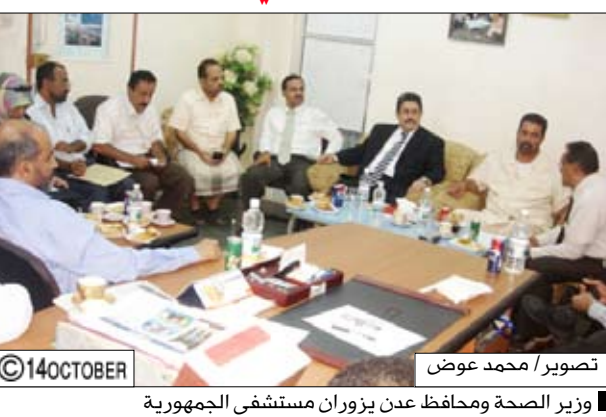
وزير الصحة ومحافظ عدن يزوران مستشفى الجمهورية