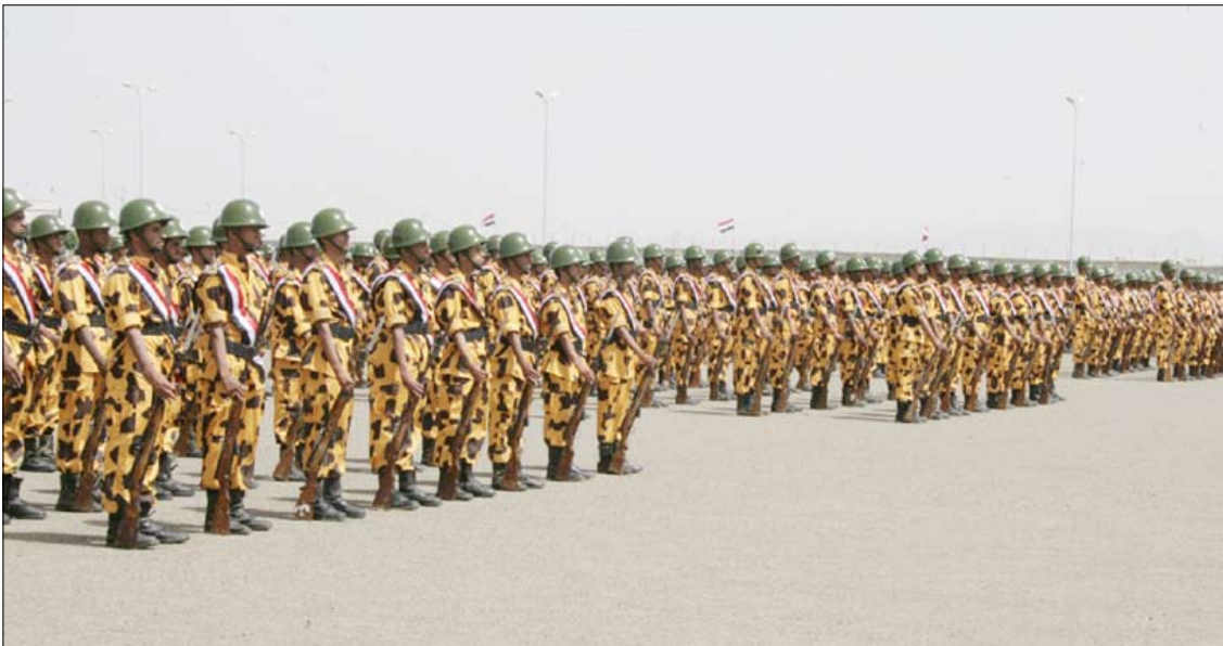
جانب من أبطال المؤسسة العسكرية والأمنية