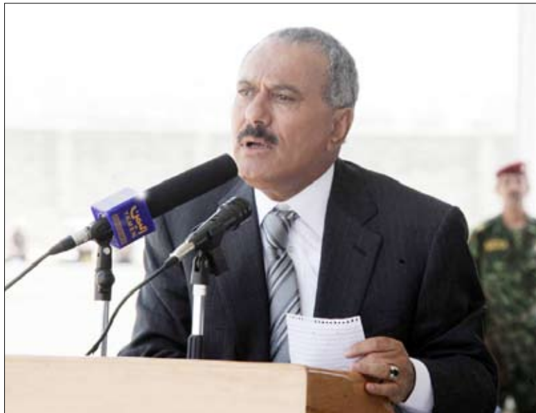
رئيس الجمهورية في كلمته أمام الخريجين

جدد فخامة الأخ الرئيس علي عبدالله صالح رئيس الجمهورية توجيه الدعوة التي كان قد أعلنها في خطابه السياسي عشية الاحتفال بالعيد الوطني الـ 20 للجمهورية اليمنية (22 مايو) إلى كافة القوى السياسية بأن يشاركوا في الحوار الوطني الشامل. وقال فخامة الرئيس علي عبدالله صالح رئيس الجمهورية - القائد الأعلى للقوات المسلحة لدى شهوده أمس حفل تخرج الدفعة الرابعة للدورة التأسيسية للمهارات والمعارف الأمنية من المركز التدريبي العام للشرطة بدمار " الحوار أفضل من استخدام المصطلحات والصحافة والألفاظ غير السليمة وعلى الجميع أن يهبوا إلى الحوار وإلى كلمة سواء من أجل مصلحة واستقرار اليمن ووحدته، فاليمين أكبر من الجميع ويتسع للجميع والشراكة مفتوحة للجميع دون أي تعنت أو كبرياء، فترحب بالحوار الجاد والمخلص دون تزيف ومماطلات". وقال: " إن أبناء اليمن الذين فجروا الثورة المباركة ضد المظالم الإمامية وهبوا للدفاع عن الجمهورية هبة رجل واحد، حرصوا منذ فجر الثورة على الالتحاق بالمعاهد والمعاهد والكلية والجامعات ليعوضوا ما فات أبائهم وأجدادهم". وأضاف: " و الآن لدينا جيل متعلم متحضر، ولذلك نتطلع إلى هؤلاء الشباب الذين تعلموا والتحقوا بالجامعات والمعاهد بأن يشاركوا بفاعلية في خدمة مسيرة البناء والتطوير في الوطن". وجدد فخامة الأخ الرئيس التهنئة لأبطال المؤسسة العسكرية والأمنية في كل مناطق اليمن ولكل الأحرار الشباب الذين ولاؤهم لهذا الوطن وجهم للوحدة والثورة والجمهورية.. مؤكداً أن المؤسسة العسكرية والأمنية هي حزب الأحرار حزب الوطن وليست ملكاً لأي حزب سياسي ولا للمتاجرة ولا للبيوع والشراء. ( التفاصيل 2 - 3 )