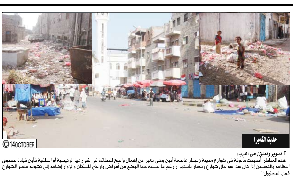
حادث الكابريا تصوير وتعليق / علي الدرب: هذه المناظر أصبحت مألوفة في شوارع مدينة زنجبار عاصمة أبين وهي تعبر عن إهمال واضح للنظافة في شوارعها الرئيسية أو الخلفية فأين قيادة صندوق النظافة والتجسس إذا كان هذا هو حال شوارع زنجبار باستمرار رغم ما يسببه هذا الوضع من أمراض وازعاج للسكان والزوار إضافة إلى تشويه منظر الشوارع فمن المسؤول!!