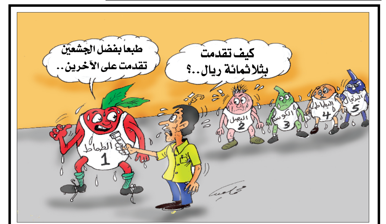
كيف تقدمت بثلاثمائة ريال؟؟ طبعاً بفضل الجشعين تقدمت على الآخرين ..