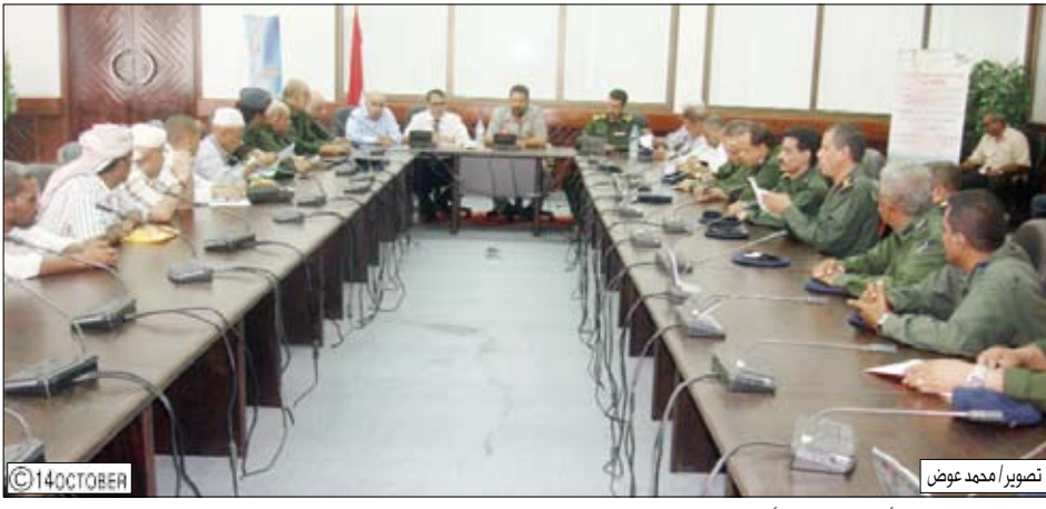
تصوير أحمد عوض © 14 OCTOBER