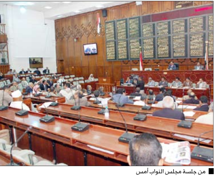
من جلسة مجلس النواب أمس

صنعاء/ سبأ: أقر مجلس النواب في جلسته أمس برئاسة رئيس المجلس يحيى علي الراعي، دعوة الحكومة إلى حضور جلسته اليوم الإثنين لاستيضاح ومناقشة عدد من القضايا المتصلة ببعض الاختلالات الأمنية، وبحث الجهود المشتركة ومضاعفاتها لتوطيد دعائم الأمن والاستقرار والحفاظ على الملكية العامة والخاصة وتعزيز سلطة القادون والنظام وهيبة الدولة في ربوع الوطن. وواصل المجلس في جلسته مناقشة تقرير اللجنة البرلمانية الخاصة بالكلفة بتقصي الحقائق في مشاكل الأراضي بمحافظة الحديدة . حيث بينت مناقشة أعضاء المجلس، أهمية التصدي والقضاء على ظاهرة الاعتداء على أملاك الدولة والمواطنين، والحد من المزايدات العقارية وضمان الملكية العقارية وثابتها وخلق بيئة استثمارية آمنة ومواتية.