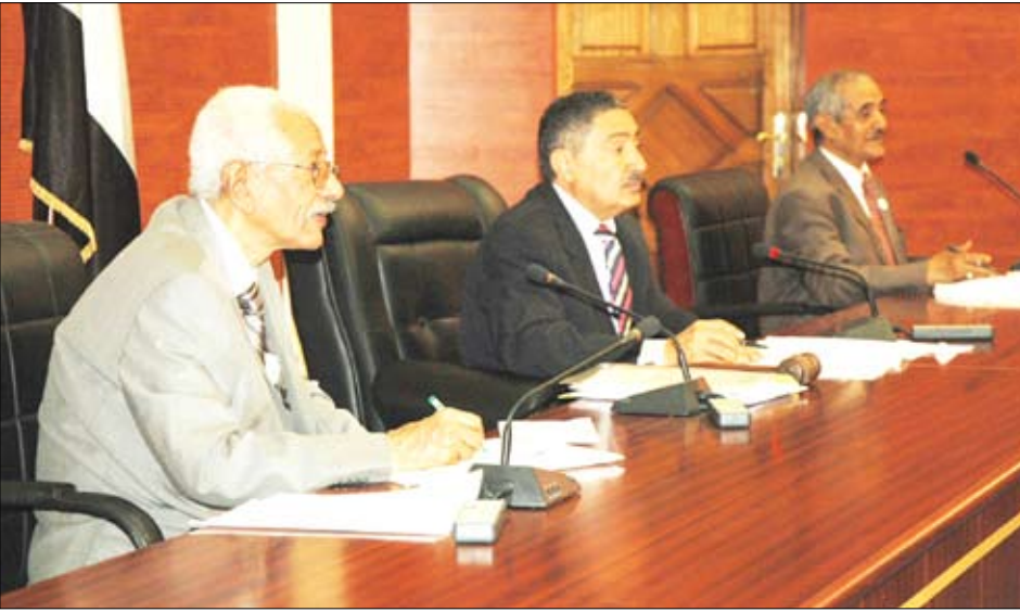
مجلس الشورى في الجلسة الثانية الأخيرة أمس

صنعاء/ سبأ: اختتم مجلس الشورى مناقشاته لموضوع المشكلة السكانية والتنمية في اليمن في الجلسة الثانية الأخيرة التي عقدها يوم أمس برئاسة رئيس المجلس عبدالعزيز عبدالغني. ودعت المناقشات إلى رفع مستوى التعامل مع المشكلة السكانية، على المستويين الرسمي والشعبي، وكذا على مستوى الفعاليات السياسية والاجتماعية، والعمل على دعم برامج التنقيف بهذه القضايا عبر هذه الفعاليات، بما يساهم في رفع مستوى الوعي الاجتماعي بها. ودعت المناقشات إلى توجيه الأهتمام بخدمات الرعاية الصحية من خلال زيادة عدد الكوادر العاملة في هذا القطاع وخصوصاً من النساء، وتوسيع نطاق هذه الخدمات لتصل إلى المناطق النائية، والعمل على تنمية الموارد اللازمة لتغطية الاحتياجات السكانية. وانتهت بعض المناقشات إلى قضية الزواج في سن مبكرة، حيث دعت في هذا السياق إلى ضرورة تحديد سن أمانة للزواج ومنع تزويج الصغيرات، وتفعيل برامج الصحة الإنجابية، وتوفير فرص العمل للشباب، وتنمية القطاعات الإنتاجية في البلاد بما فيها القطاعات الزراعية الصناعية والتجارية والسياحية، وتعظيم قيم الإنتاج على مستوى الفرد والأسرة والمجتمع، باعتباره من الوسائل الضرورية التي تؤدي إلى نتائج إيجابية لجهة خفض معدلات الزيادة السكانية في البلاد.