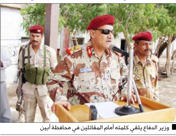
وزير الدفاع يلقي كلمته أمام المقاتلين في محافظة أبين

صنعاء/ سبأ: تفقد وزير الدفاع اللواء محمد ناصر أحمد أمس ومعه نائب رئيس الجهاز المركزي للأمن السياسي اللواء منصور رشيد ومحافظة أبين المهندس احمد بن احمد الميسري ورئيس مصلحة السجون اللواء علي ناصر لخشم عدداً من الوحدات العسكرية بمحافظة أبين. وألقي وزير الدفاع كلمة أمام المقاتلين، نقل إليهم في مستهلها تحيات وتهاني فخامة الرئيس علي عبدالله صالح رئيس الجمهورية القائد الأعلى للقوات المسلحة بمناسبة العيد الوطني العشرين للجمهورية اليمينية "22 مايو". وعبر وزير الدفاع