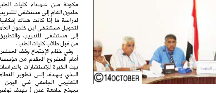
د. بن حبتور يترأس اجتماعاً لمجلس الجامعة

شدد الدكتور/ عبدالعزيز صالح بن حبتور رئيس جامعة عدن على ضرورة استبعاد جميع كليات ومراكز الجامعة لإمتحانات الفصل الدراسي الثاني للعام الجامعي الحالي من خلال نهيئة كافة الطعوف والسبل الملائمة للطلاب أداء امتحاناتهم بكل يسر وسهولة. جاء ذلك أثناء ترؤسه أمس السبت اجتماع مجلس الجامعة في دورته العاشرة لشهر مايو الذي وقف أمام العديد من المواضيع والصعوبات التي تواجهها كليات ومراكز الجامعة. وقد أقر المجلس محضر اجتماع دورته الرابعة وأيضاً خلاصة الحسابات الختامية للعام المالي 2009م ووقف أمام اللجنة التقويمية للعام الجامعي 2010-2011م والذي سيبدأ يوم 18 /9/ 2010م ، مقدراً جهود وعمل الإدارة العامة للقبول