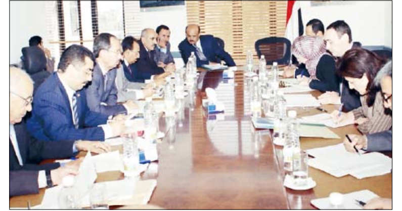
الأرجبي يلتقي بعثة البنك الدولي