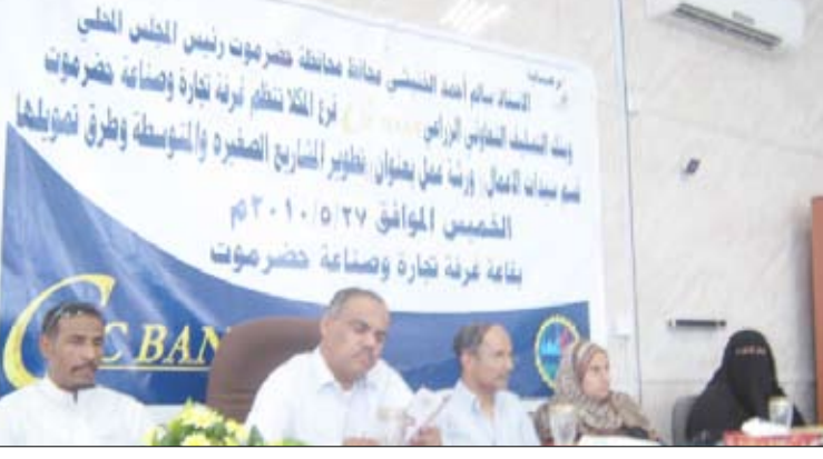
من أعمال ورشة عمل تطوير المشاريع الصغيرة والمتوسطة وطرق تمويلها