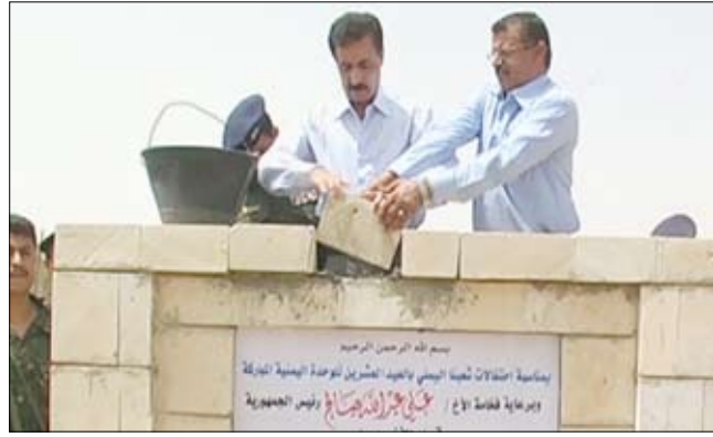
المصري والزايدي يضعان الحجر الأساس لعدد من المشاريع

شهدت محافظة مأرب افتتاح ووضع الحجر الأساس وتأسيس 188 مشروعاً خدمياً وتنموياً احتفاءً بالعيد الوطني العشرين للوحدة المباركة بكلفة إجمالية بلغت 9 مليارات و762 مليوناً و597 ألف ريال. وقام الأخ اللواء الركن مطهر رشاد المصري وزير الداخلية ومعه محافظ المحافظة ناجي بن علي الزايدي ومدير الأمن في المحافظة بوضع الحجر الأساس لمبنى إدارة الأمن في المحافظة والحجر الأساس لـ 120 مشروعاً تنموياً وخدمياً وبكلفة 7 مليارات و777 مليوناً و113 ألف ريال وتشمل محلات التربية والتعليم بواقع 15 مشروعاً بكلفة 383 مليوناً و500 ألف ريال و13 مشروعاً في مجال الصحة والسكان بكلفة 294 مليوناً و500 ألف ريال و5 مشاريع في مجال الطرق بكلفة 5 مليارات و68 مليون ريال و47 مشروعاً في المياه والبيئة بكلفة 131 مليوناً و491 ألف ريال و19 مشروعاً زراعية بكلفة 430 مليوناً و30 ألف ريال و8 مشاريع اتصالات بـ 277 مليوناً و760 ألف ريال ومشروعين في مجال الشباب والرياضة بكلفة 20 مليون ريال و8 مشاريع في الإدارة الحكومية بكلفة 78 مليون ريال و3 مشاريع في التعليم العالي بكلفة 93 مليوناً و832 ألف ريال. ويشرف المصري والزايدي ومعهما مدير عام فرع المؤسسة العامة للمياه والصرف الصحي حسين بن جلال مشروع مياه حارة السلام ومعسكر الأمن المركزي بكلفة 113 مليوناً و800 ألف ريال ويستفيد منه أكثر من 10 آلاف نسمة وافتتاح 66 مشروعاً