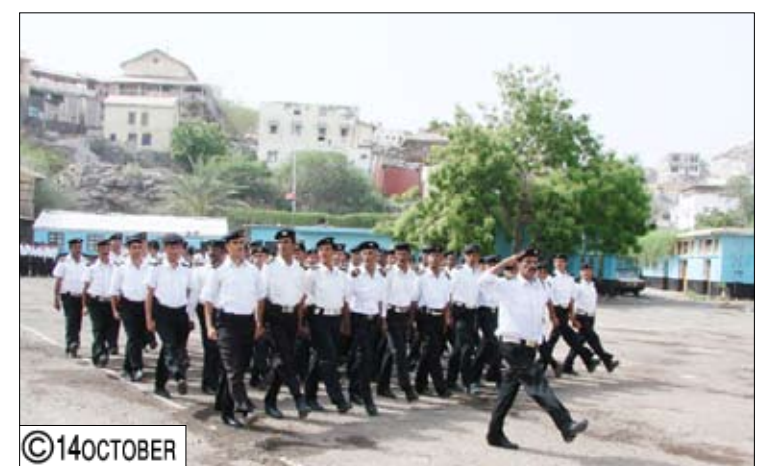
جانب من العرض

يعد إلى جميع أبناء الوطن وإلى قيادته السياسية ممثلة بزعامة الأخ الرئيس القائد معاهداً على الدفاع عن وحدة الوطن ومجزاته. مشيراً إلى الإنجازات التي تحققت للقاعدة البحرية والوحدات البحرية - عدن حيث تم تنفيذ العديد من المهام العملياتية والتدريبية والتوجيهية وكثير من العمليات الرياضية واستقبال العديد من الوفود العسكرية والبحرية والقوالم الإشرافية مؤكداً أنه قد قامت القوات البحرية بعدن بتنفيذ مئات المهام بمرافقة السفن النشطة من وإلى الموانئ اليمنية مشيداً بالتغيرات الواضحة في ملامح القاعدة وسفنها وبنياتها. وفي ختام الحفل قام قائد القوات البحرية والدفاع الساحلي بتوزيع الشهادات التقديرية والجوائز العينية على عدد من الضباط والصف والجنود في القاعدة البحرية في عدن.