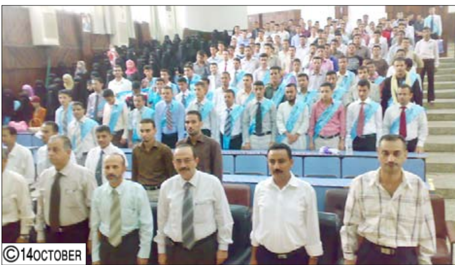
من احتفال الجامعة اليمنية بتخرج دفعتي الرئيس صالح و22 مايو

ونيز التطرف والغلو والتمسك بالثوابت الوطنية. ونوه بان الخريجين اكتسبوا خلال سنوات دراستهم العديد من المفاهيم والمبادئ وتكونت لديهم القدرة على الإدراك والتمييز في التعامل مع ما هو صالح للمجتمع وتطوره وما هو هدام وضار به. تخلل الحفل - الذي قام محافظ الحديدة في ختامه بتوزيع الشهادات على أوائل الخريجين - عدد من الوصلات الغنائية والفقرات الفنية المتنوعة التي عبرت عن الفرحة بهذه المناسبة.