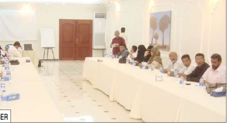
جانب من المشاركين في الاجتماع

ويناقش الاجتماع الذي يشارك فيه خمسون مشاركاً ومشاركة من خمس محافظات الأمانة وعدن وتعز والحديدة والمكلا) على مدى ثلاثة أيام عدداً من المواضيع المتعلقة بالسياسات الوطنية والاستجابة للمركزية لمكافحة الإيدز واستعرض تقارير الزيارات والمواقع العلاجية وما تم تنفيذه خلال الفترة السابقة والطرق العملية لقياس مدى الالتزام بالعلاج. كما سيتم خلال الاجتماع مناقشة نصوص المناعة (الإيدز) عند الأطفال والتشخيص المبكر والمراحل السريرية والعلاجية والعدوى الانتهازية في الأطفال ومتابعة الطفل الصحية وتقديم الدعم النفسي للأهل ومؤسسات الأداة في المواقع العلاجية ومتابعة جمع البيانات وخطة المواقع العلاجية لتحسين الأداء في