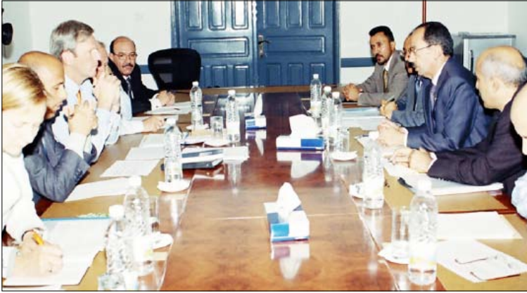
.. ويلتقي بعثة الهولندية