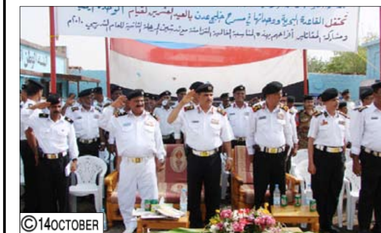
خلال تدشين المرحلة الثانية من العام التدريبي الجديد