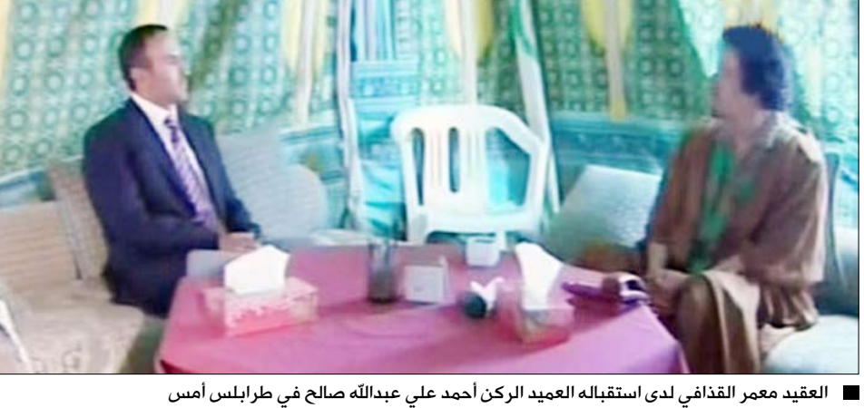
العقيد معمر القذافي لدى استقباله العميد الركن أحمد علي عبدالله صالح في طرابلس أمس

تسلم قائد ثورة الفاتح من سبتمبر الليبية العقيد معمر القذافي، خلال استقباله أمس في طرابلس قائد الحرس الجمهوري - قائد القوات الخاصة العميد الركن/ أحمد علي عبدالله صالح، رسالة من فخامة الأخ الرئيس علي عبدالله صالح رئيس الجمهورية، تتعلق بالعلاقات الأخوية الحميمة بين البلدين والشعبين الشقيقين وأفاق تعزيزها وتطويرها في المجالات كافة لما فيه خدمة المصالح المشتركة للبلدين والشعبين الشقيقين. وتناولت الرسالة المستجدهات العربية والإقليمية والدولية ذات الاهتمام المشترك.. بالإضافة إلى نتائج القمة العربية الأخيرة التي عقدت في مدينة سرت الليبية واليات تنفيذها. وجرى خلال المقابلة بحث سبل تطوير العلاقات الأخوية ومجالات التعاون الثنائي وعلى وجه الخصوص تعزيز التعاون الثنائي بين القوات المسلحة في البلدين الشقيقين.