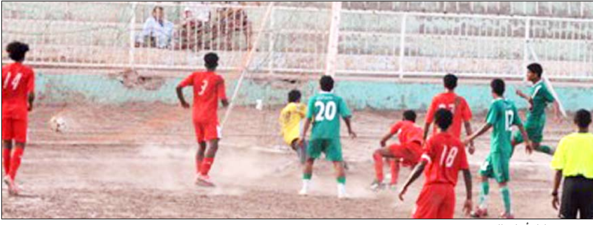
من مباراة أهلي الحديدية ووحدة عدن