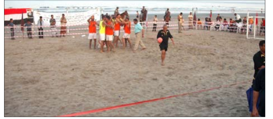
لقطة من البطولة الماضية

مشاركة ومناقشة لائحة البطولة وإجراء القرعة بعد تقسيم الأندية إلى مجموعتين، وعصر اليوم السبت تبدأ المنافسات تبدأ داخل الملعب وكل مجموعة تلعب بنظام الكل مع الكل من دور واحد ويصعد الأول والثاني من كل مجموعة إلى المربع الذهبي. يذكر أن نادي شباب رخمة نمار قد توج بطلا للبطولة الثانية العام الماضي 2009م وحل وصيفا نادي شباب الجبل من الحديدية.