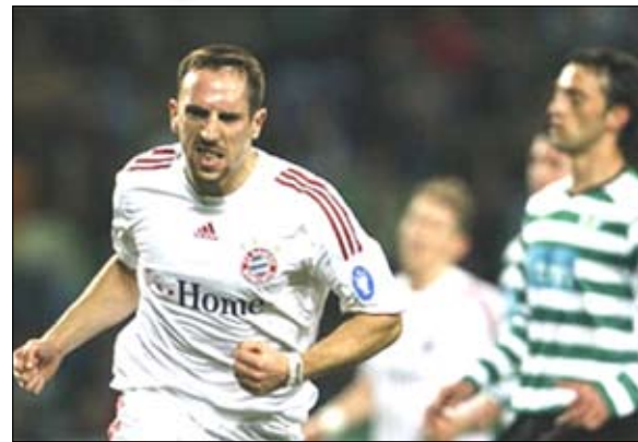
الفرنسي فرانك ريبيري