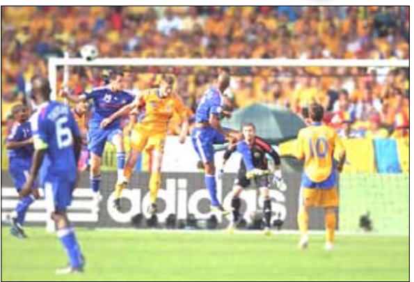
رأسية أنيلكا تعلق العارضة الرومانية