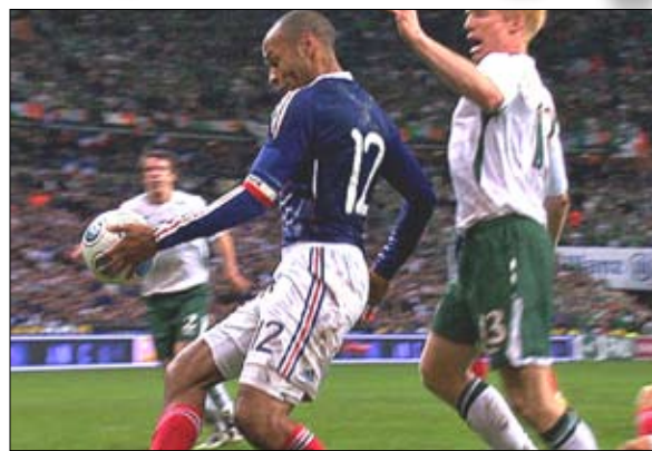
هنري يهين الكرة بيده لتأهل فرنسا إلى مونديال 2010

مونيخ الألماني شرارة الإبداع في خط وسط المنتخب الفرنسي خلال نهائيات كأس العالم 2010 بجنوب أفريقيا بشرط أن يتخلص من الإصابات. وقضى ريبيري السنوات الأربع الأولى من مسيرته الكروية في بلده فرنسا مع أربعة أندية مختلفة قبل الانتقال إلى تركيا في مطلع عام 2005 وبعدها عاد لفرنسا مارسيليا الفرنسية. وانتقل ريبيري بعد ذلك إلى بايرن مونيخ الألماني في 2007 مقابل 25 مليون يورو كما يتقاضى حالياً ثمانية ملايين يورو من الفريق سنوياً. ورغم ذلك ظل ريبيري هدفاً لمانشستر يونايتد ومانشستر سيتي الإنجليزين وبرشلونة وريال مدريد الإسبانيين بفضل موهبته الرائعة حتى جدد عقده أخيراً مع بايرن مونيخ. وكانت أول مباراة دولية لريبيري مع المنتخب الفرنسي في 27 مايو 2006 عندما فاز الفريق على نظيره المكسيكي 1 - 0. كما شارك ريبيري في المباراة النهائية لكأس العالم 2006 والتي خسرها أمام نظيره الإيطالي. وجاءت الفضيحة الجنسية الأخيرة لريبيري بمثابة صدمة لكافة عشاق وجماهير هذا اللاعب، حيث تورط اللاعب مع فتاة قاصر في منتصف الشهر الماضي، وأقر ريبيري المتأهل والأب لطفلتين أنه أقام علاقة مع الفتاة لكنه لم يعلم أنها قاصر.