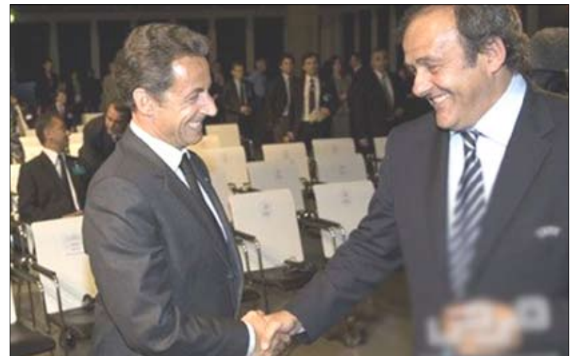
نيكولا ساركوزي الذي حضر إلى جنيف من أجل دعم ملف ترشيح بلاده.