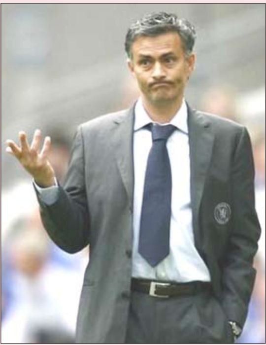
البرتغالي جوزيه مورينيو

□ مدريد / 14 أكتوبر / متابعة: أعلن نادي ريال مدريد الإسباني لكرة القدم يوم امس الجمعة رسمياً على موقعه في شبكة الانترنت تعيين البرتغالي جوزيه مورينيو - مدرب إنتر ميلان الإيطالي - خلفاً للتشيلي مانويل بيلغريني. وجاء في بيان بثه النادي الإسباني على موقعه في شبكة الانترنت «توصل ريال مدريد وإنتر ميلان إلى اتفاق على أن يكون مورينيو مدرباً جديداً للنادي الملكي». وأضاف «سبق قدم مورينيو للصحافة الأثنين المقبل عند الساعة 13.00 (11.00 ت غ) في ملعب سانتياغو برنابيو»، موضحاً أن «الاتفاق تم خلال لقاء بين رئيس النادي فلورنتينو بيريز ونظيره الإيطالي ماسيمو موراتي بعد ظهر امس (الجمعة) واتسم بعلاقات الصداقة والود القائمة بين النادييين». وكان رئيس ريال مدريد فلورنتينو بيريز أكد الأربعاء بعد اجتماع لمجلس الإدارة أن النادي الملكي قرر إقالة بيلغريني من منصبه وسيعين البرتغالي مورينيو في منصب المدرب بعد أن ينهي الأخير وضعه مع إنتر ميلان الإيطالي. وقال بيريز «إدارة ريال مدريد تؤكد انتهاء مرحلة مانويل بيلغريني كمدرّب وستعين جوزيه مورينيو بعد حل وضعه وأضاف «مورينيو هو أحد أفضل المدربين في العالم إن لم يكن الأفضل، وسيطفي قيمة كبيرة لعناصر الفريق أهم بكثير مما نحن عليه الآن». وأكد رئيس إنتر ميلان ماسيمو موراتي يوم امس الجمعة أن الإيطالي فايو كابيللو مدرب منتخب انكلترا هو أحد المرشحين لخلافة مورينيو.