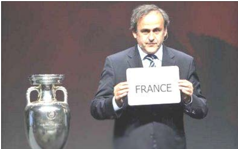
الفرنسي ميشيل بلاتيني رئيس (الويفا) يرفع اسم فرنسا كمستضيف يورو 2016