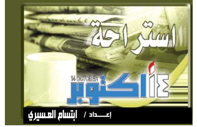
إعداد / إيشام العسيري

نن / متابعة : توصلت دراسة بريطانية حديثة إلى أن التوتر يعتبر أحد الأسباب المعروفة للتعبيل بالتجاعيد في الوجه، لكن أظهرت دوراً هاماً لأحد الهرمونات المضادة للتوتر في تأخير زحف الشيخوخة، والمحافظة على قوة وسلامة العضلات لدى المسنين. وفي بحث مشترك أجراه باحثون من جامعتي ليفربول البريطانية وكاليفورنيا الأمريكية لدراسة دور هرمون «إتش. إس. بي. 10»