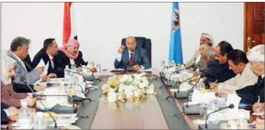
اجتماع المجلس الأعلى لأحزاب التحالف الوطني الديمقراطي

صنعاء / سيا ■ عقد المجلس الأعلى لأحزاب التحالف الوطني الديمقراطي اجتماعاً أمس في صنعاء برئاسة الأخ عبدربه منصور هادي نائب رئيس الجمهورية - النائب الأول لرئيس المؤتمر الشعبي العام - الأمين العام للمؤتمر. ووقف المجلس أمام المستجندات على الساحة الوطنية وعلى وجه الخصوص مضامين الخطاب التاريخي لفخامة الأخ الرئيس علي عبدالله صالح رئيس الجمهورية بمناسبة العيد الوطني الـ 20 لإعادة تحقيق وحدة الوطن وقيام الجمهورية اليمنية. وبهذه المناسبة هنأ المجلس الأعلى قائد الوطن وأبناء شعبنا اليمني في الداخل والخارج بهذه المناسبة الوطنية العظيمة والغالية على نفوسنا جميعاً.. مشيداً بالدور الوطني الكبير الذي اضطلعت به قيادة الوطن