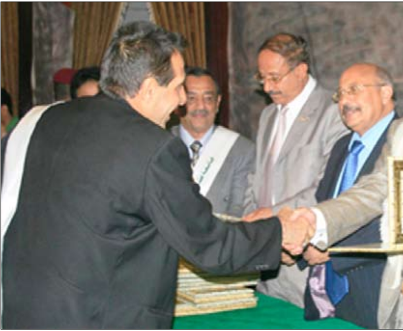
أثناء تكريم الرعيل الاول من قيادات كلية التربية والاداب والعلوم