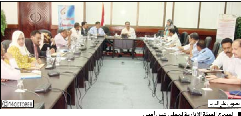
اجتماع الهيئة الادارية لمحلي عدن أمس