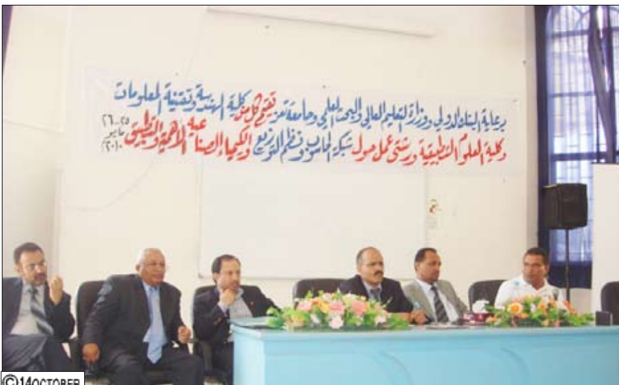
خلال افتتاح ورشة عمل حول شبكة الحاسوب ونظم التوزيع والكيمياء الصناعية

بإشراف /عبدالله بن كده، بدأت في جامعة تعز أمس ورشستا عمل حول (شبكة الحاسوب ونظم التوزيع والكيمياء الصناعية.. الأهمية والتطبيق) نظمتها كليات الهندسة وتقنية المعلومات والعلوم التطبيقية بدعم من البنك الدولي والقطاع الخاص وبمشاركة (30) أكاديمياً وهدفان تعزيز الروابط بين الجامعة وأرباب العمل وربط مخرجات التعليم العالي بالتنمية وبمطلوبات سوق العمل. وفي افتتاح الورشتين اللتين تستمران يومين أكد الدكتور محمد عبدالله الصوفي رئيس الجامعة على إن البرنامجين التكنولوجيين يمثلان إضافة نوعية في إستراتيجية الجامعة وخاصة في عالم شبكة الحاسوب ونظم التوزيع مشيراً إلى أن سوق العمل تحتاج دائماً إلى التطور والنماء والتكنولوجيا والعمل بروح الفريق الواحد وإيجاد أرضية خصبة للشراكة المجتمعية والقطاع الخاص للإنتاج وتطوير وتنمية الخدمة المجتمعية الإنتاجية. من جانبه أشار الدكتور عزيز الحدي منسق