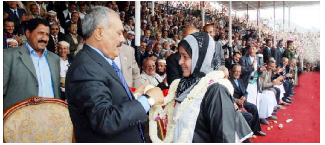
رئيس الجمهورية يرحب بإحدى فتيات إب تلبس العلم الوطني في المهرجان الجماهيري أمس الأول

صنعاء / سيا ■ عاد فخامة الأخ الرئيس علي عبدالله صالح رئيس الجمهورية أمس وبسلامة الله وحفظه إلى العاصمة صنعاء بعد زيارته لمحافظات عدن، إبين، تعز، واب تفقد خلالها أحوال المواطنين وشارحهم أفرهم والاحتفال بالعيد الوطني الـ 20 للجمهورية اليمنية (22 مايو) وإعادة تحقيق وحدة الوطن. كما دشّن خلال تلك الزيارات العديد من المشاريع الخدمية والإنمائية في تلك المحافظات.