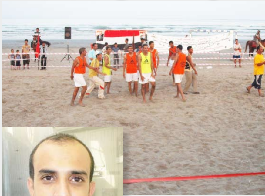
لقطة من البطولة الماضية