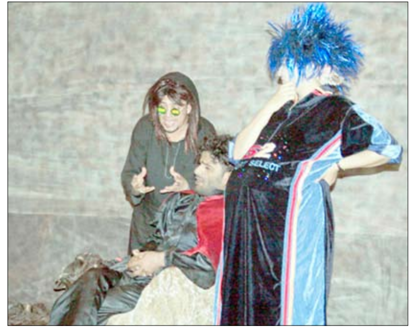
من فعاليات الحفل

وأشاد بالدور الريادي لليمن بزعامه فخامة رئيس الجمهورية في تقديم الدعم للشعب الفلسطيني .. داعياً مختلف الفصائل الفلسطينية إلى الوحدة ونبذ الفرقة والنزق التي لا تخدم إلا العدو الصهيوني . وتضمنت الفقرات الفنية في الحفل أوبريتاً بعنوان (عيد صاغه الظفر) لطلاب الكلية ومسرحية «ما تقدروش واليمن أبقي» لفرقتي مسرح جامعة صنعاء والنادي الفنية وقصيدتين شعريتين تغنتا بالوطن ووحده ومنجزاته. وفي الختام كرم محافظ صنعاء ورئيس الجامعة الرعيل الأول من قيادات الكلية والمبرزين من أعضاء هيئة التدريس والطلاب. حضر الاحتفال نواب رئيس الجامعة وأساتذة وطلاب من الكلية والجامعة.