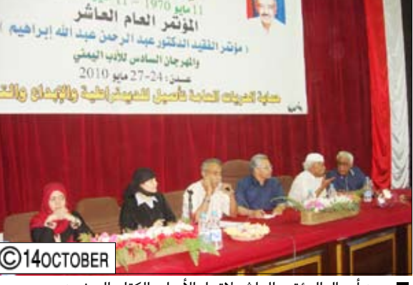
من أعمال المؤتمر العاشر لاتحاد الأدباء والكتاب اليمنيين