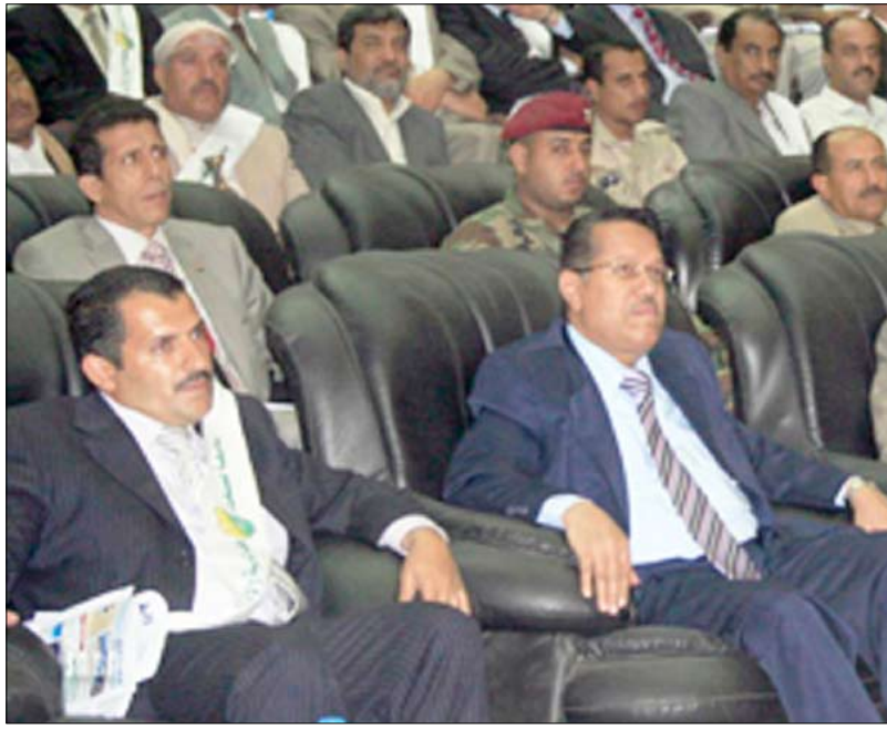
جانب من حضور الحفل