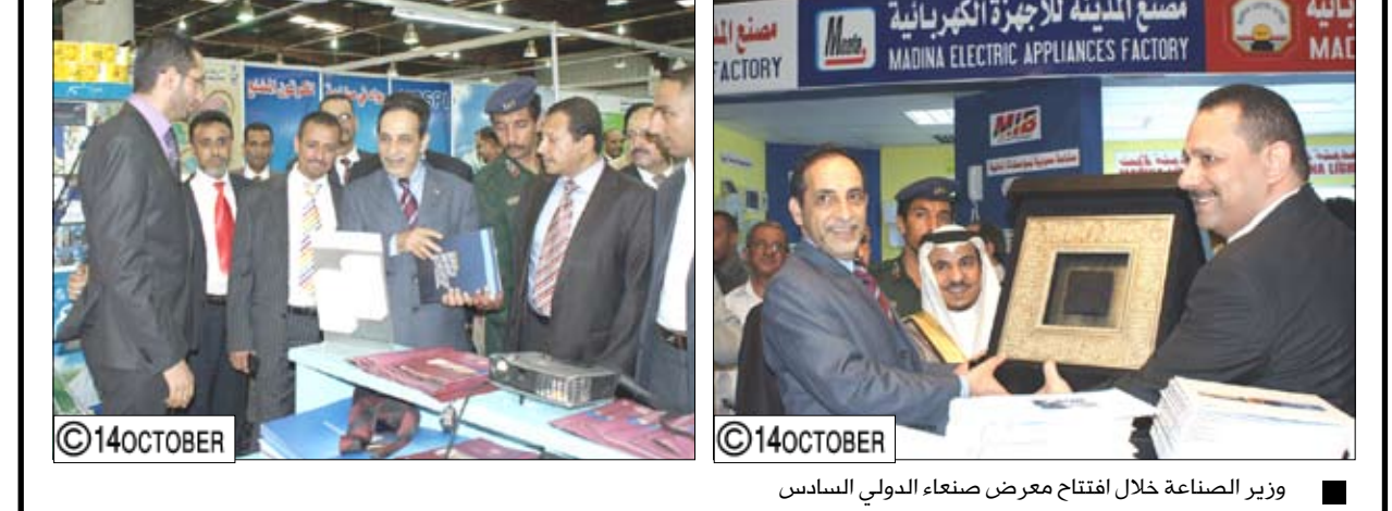
وزير الصناعة خلال افتتاح معرض صنعاء الدولي السادس

ومعه قيادة الغرفة الصناعية والأثرية وأمانة العاصمة وعدد من سفراء الدول الشقيقة المشاركة في المعرض والتجول في أرجاء المعرض والإطلاع على أجنحته المختلفة، مشيداً بالمستوى العالي والمميز الذي وصلت إليه الصناعات الوطنية والعربية التي تمكنها من المنافسة في الأسواق المحلية والإقليمية والدولية. ورحب بالأشقاء العرب