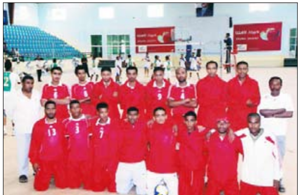
فريق حسان لكرة الطائرة