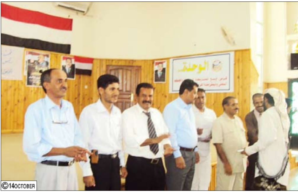
خلال تكريم الفائزين بجوائز الرئيس للشباب في آيين