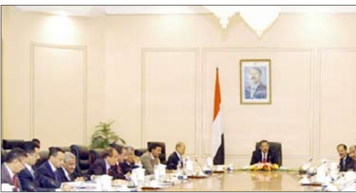
اجتماع مجلس الوزراء برئاسة د. مجور أمس

صنعاء / سيا ■ دعا مجلس الوزراء كافة القوى السياسية التي خاطبها فخامة الأخ رئيس الجمهورية إلى الاستجابة العقلانية الصادقة والمخلصة لهذه الدعوة الحكيمة باعتبارها فرصة تاريخية ثمينة ينبغي اغتنامها بعقول منفتحة وضمائر وطنية حية من أجل الانحياز للوطن والانتصار للمصلحة العليا للشعب والتحرر من النزوح الذاتية والأناحية والابتعاد عن المشاريع الصغيرة والمكائيد السياسية. وأكد مجلس الوزراء في اجتماعه الأسبوعي أمس برئاسة رئيس المجلس الدكتور علي محمد مجور أن الحكومة ستعمل على تحقيق كل متطلبات العمل من أجل إجراء انتخابات نيابية في موعدها المحدد ومواصلة مسيرة الإصلاحات والدفع بعجلة التنمية. وأقر المجلس الخطة العاجلة لمواجهة ومحاصرة حمى الضنك في المحافظات التي سجلت ظهور لهذا المرض ووجه باستكمال الإجراءات القانونية اللازمة لإصدار لائحة تسويق المواد البترولية ومكافحة تهريبها. ووافق المجلس على المعالجات العاجلة بشأن أوضاع معهد جميل غانم للفنون بمحافظة عدن ووجه بخصم عشرين مليون ريال من موازنة وزارة الثقافة لهذا العام لصالح ترميم المعهد وشراء المعدات المناقصة.