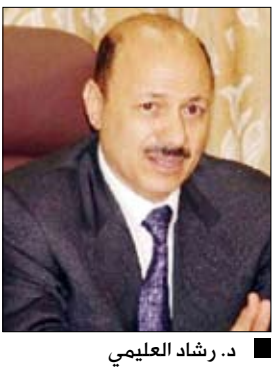
د. رشاد العلمي

صنعاء / متابعة ■ نفى مصدر مسؤول الأنباء التي تحدثت عن تعرض نائب رئيس الوزراء لشئون الدفاع والأمن الدكتور رشاد محمد العلمي لمحاولة اغتيال أثناء حضوره ومعه عدد من المسؤولين المهرجان الجماهيري الكبير الذي أقيم في محافظة الجوف بمناسبة العيد الوطني العشرين للجمهورية اليمنية. وقال المصدر إن تلك المزاعم لا أساس لها من الصحة وتفتقر إلى المصداقية، مضيفاً أن من روح تلك الإشاعة هم من ساءهم النجاح الكبير الذي حققه المهرجان مشيراً إلى أن المهرجان سار على ما يرام وفي أجواء فرحانية غمرت أبناء المحافظة وهم يحتفون بالعيد الوطني العشرين للجمهورية اليمنية من خلال حضورهم الكبير وتفاعلهم وحماستهم الرائع مع فعاليات المهرجان.. مؤكداً من خلال ذلك التفاهم حول القيادة السياسية، وحرصهم على أمن واستقرار ووحدة اليمن.