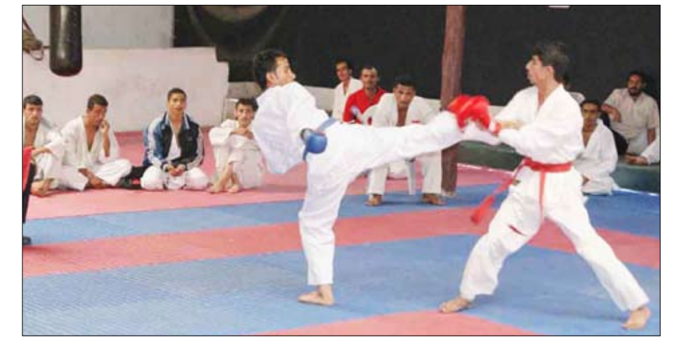
لقطات من البطولة