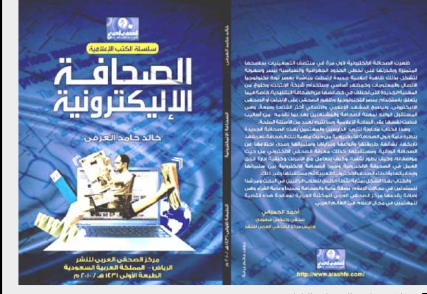
غلاف كتاب « الصحافة الإلكترونية »

من المعروف أن الآثار التي نتجت عن ظهور شبكة الإنترنت تتعدد وتنوع، ولكن لعل أهمها على الإطلاق ليس فقط كونها وسيلة اتصال بل لأنها باتت وسيلة للحصول على المعلومات ومنها الأنباء والأخبار وهي وظيفة تقوم بها الصحافة ودور بنائها بها، وبذلك اتسعت الحريات الصحفية بشكل غير مسبوق، بعد أن أثبتت الظاهرة الإعلامية الجديدة قدرتها على تخطي الحدود الجغرافية والسياسية بيسر وسهولة.