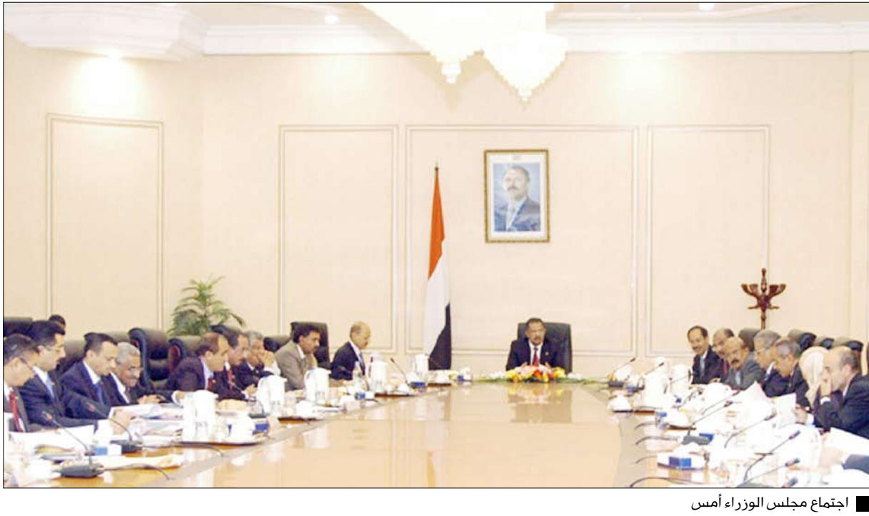
اجتماع مجلس الوزراء أمس

ودعا المجلس بهذا الصدد كافة القوى السياسية التي خاطبها فخامة الأخ رئيس الجمهورية إلى الاستجابة العقلانية الصادقة والمخلصة لهذه الدعوة الحكيمة باعتبارها فرصة تاريخية ثمينة ينبغي اغتنامها بعقول منفتحة وضمائر وطنية حية من أجل الانحياز للوطن والانتصار للمصلحة العليا للشعب والتحرر من النزاع الذاتية والأناية والابتعاد عن المشاريع الصغيرة والمكائد السياسية .