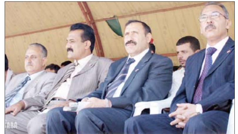
وصلات إنشادية وغنائية ورقصات شعبية في الحفل الفني والخطابي بمناسبة عيد الوحدة