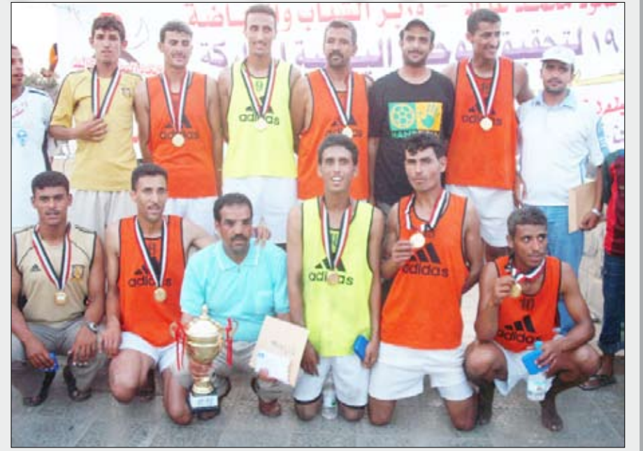
فريق رخمة بطل البطولة الماضية

اللعبة على رمال ثغر اليمن الباسم.. وأضاف حمزة أن كرة اليد الشاطئية بدأت تحظى بإقبال العديد من الأندية واللاعبين وقال : إن الانجاز الذي حققه منتخب الشباب بكره اليد في بنجلادش وحصوله على المركز الرابع من بين (6) دول مشاركة وانسحاب سيرلانكا الدولة المشاركة رقم (7) حفز الكثير من هواة كرة اليد على أن يواظبوا على اللعبة كون إتاحة الفرصة للاتحاد في المشاركات الخارجية هي ما كان يفقده في الفترة الماضية .