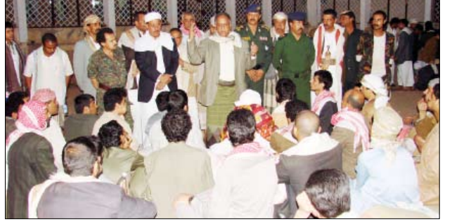
عدد من المفرج عنهم

مخاضات / سيا - علي مقراط - احمد كفتاني ■ وصلت الأمانة القضائية والأمنية أمس الإفراج عن العناصر المحتجزة على ذمة أحداث فتنه التخريب والتفرد في محافظة صنعاء والعناصر المحتجزة على ذمة أحداث الشعب والأعمال الخارجه على القانون في بعض مديريات المحافظات الجنوبية. وذلك تنفيذاً للتوجيهات التي أصدرها فخامة الأخ الرئيس علي عبدالله صالح رئيس الجمهورية بهذا الشأن في خطابه المهم بمناسبة العيد الوطني الـ 20 للجمهورية اليمنية. ففي محافظة الحديدة أفرج أمس عن 40 شخصاً من العناصر المحتجزة على ذمة أحداث فتنه التخريب والتفرد في محافظة صنعاء. وخلال عملية الإفراج دعا رئيس اللجنة المكلفة بالإشراف على تطبيق اليات النقاط الست لإنهاء فتنه التمرد في محور الملاحظ علي بن علي القيسي، المفرج عنهم إلى الاستفادة من العفو الرئاسي، مشيراً إلى أن هذا العفو يعكس الحكمة التي يتحلّى بها دوماً فخامة الرئيس في مثل هذه الحالات