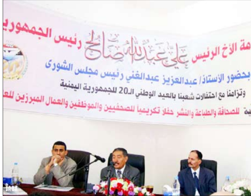
رئيس مجلس الشورى لدى حضوره حفل التكريم