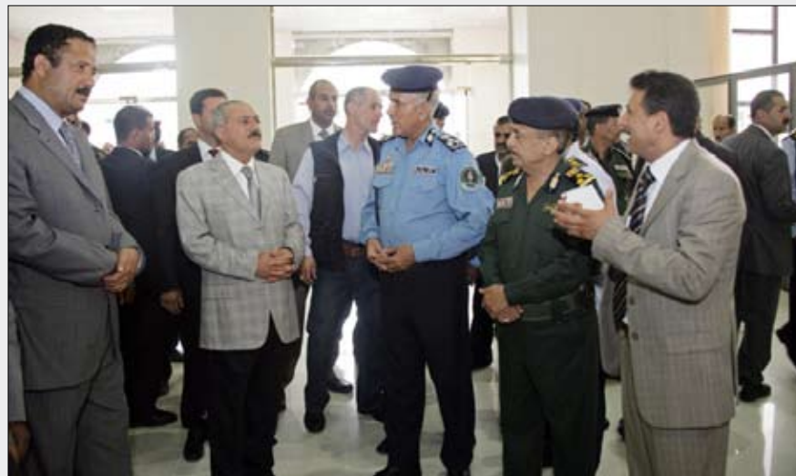
.. ويستمع إلى شرح حول عمل المركز

تعز / سيا، قام فخامة الأخ الرئيس علي عبدالله صالح رئيس الجمهورية يوم أمس الأحد بافتتاح مركز الإصدار الآلي الموحد لخدمات الشرطة (مرور - جوازات - أحوال مدنية) في محافظة تعز.