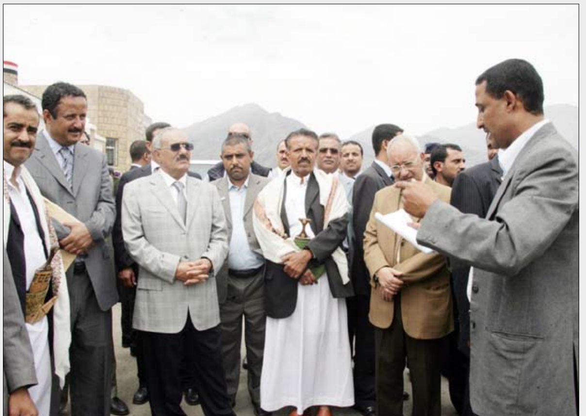
.. ويستمع إلى قصيدة ترحيب من أحد شعراء المديرية