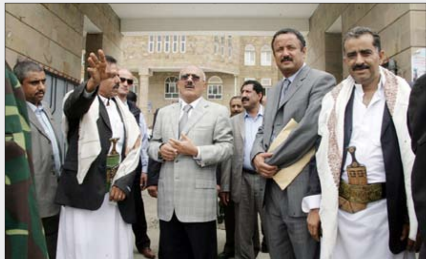
رئيس الجمهورية لدى استقباله في مديرية سامع