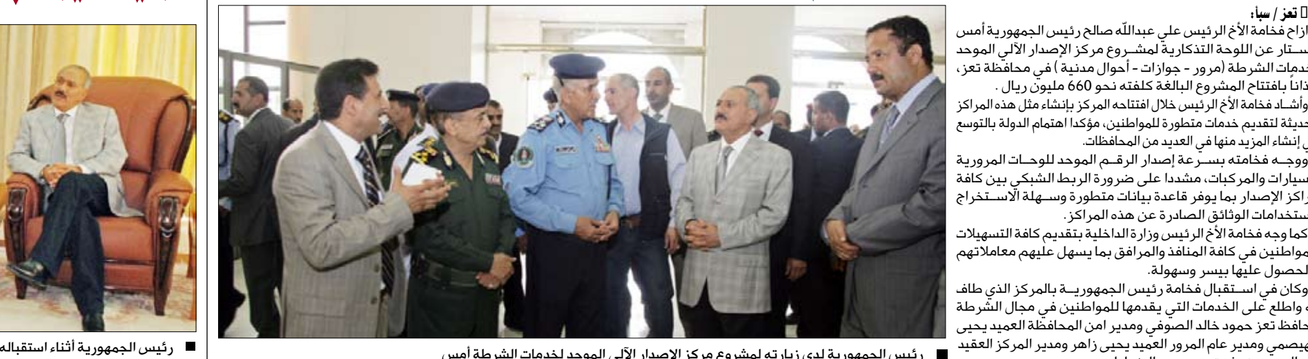
رئيس الجمهورية لدى زيارته لمشروع مركز الاصدار الآلي الموحد لخدمات الشرطة أمس

ومنها طريق خدير العين البالغ طوله 28 كيلو متراً، وبكلفة مليار و300 مليون ريال. واستمع فخامة الرئيس إلى تقرير عن نشاطات المجلس المحلي في المديرية.. في حين التقى فخامته بعدد من المواطنين، واستمع منهم إلى قضاياهم وتطلعاتهم، ووجه الجهات المعنية بتفحصها.