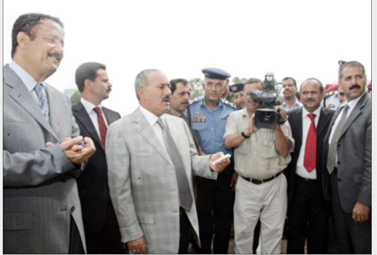
رئيس الجمهورية لدى وصوله إلى مركز الإصدار الآلي