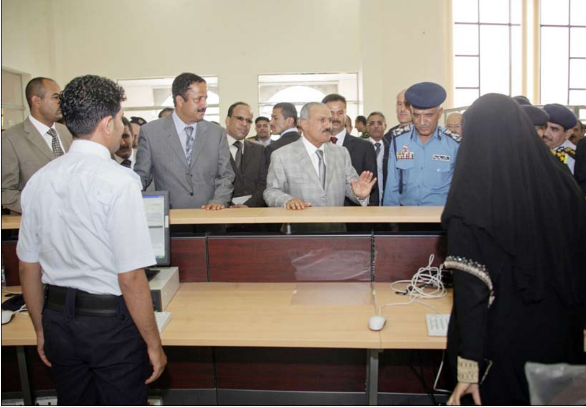
.. ويتفقد أقسام مركز الإصدار الآلي

التوجيه بإصدار الرقم الموحد للوحات المرورية للسيارات والمركبات