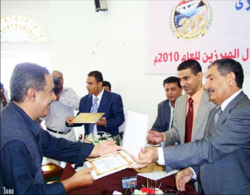
.. ولدى تكريمه أحد الزملاء في مؤسسة (الجمهورية)

للاهتمام بهذه المؤسسة الإعلامية الرائدة.