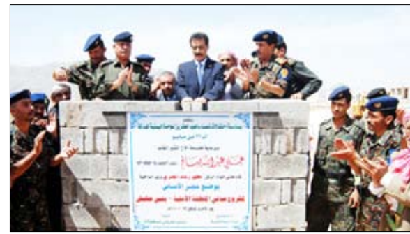
وزير الداخلية يضع حجر الأساس لمشروع مباني المنطقة الأمنية

وتابع قائلاً : «ولقد تميزت المبادرة بتحديد أهدافها وأبعاد الحوار بحيث ينطلق من اتفاق فبراير وينعقد تحت سقف الدستور والوحدة محددة مساراً إجرائياً واضحاً ينتهي إلى أهداف أكثر وضوحاً وغير قابلة للتشكيك أو التحويل تتمثل في تشكيل حكومة ائتلافية وشراكة واسعة في الحكم تضم الحزب الشريك في إقامة الوحدة والحزب المشارك في