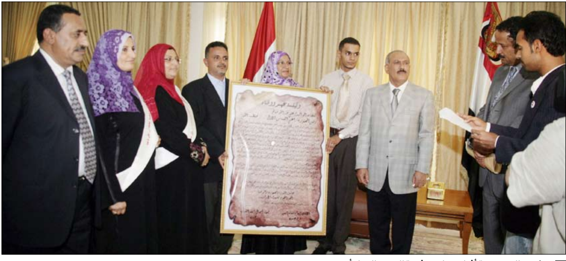
رئيس الجمهورية أثناء تسلمه وثيقة العهد والوفاء أمس

المشرق الوفاء، ودرست مرحلة جديدة من النهوض اليمني الشامل نحو صنع دولة اليمن الحديثة دولة النظام والقانون والمؤسسات، الدولة الديمقراطية الحديثة التي ظلت أمل جماهير الشعب وفي مختلف المراحل. لقد أخرجت الوحدة اليمنية المباركة شعبنا اليمني من الظلام الدامس إلى النور المبين، ووضعت أمامه طريق النجاح والمستقبل بعد التشرد الذي عاناه اليمن طوال قرون مضت، وارتقت باليمن إلى سماء المعالي، فكانت الوحدة بحق حدثاً حضارياً عظيماً نال احترام وتقدير مختلف شعوب المعمورة. وتنحى يا فخامة الأخ الرئيس تجدد لكم العهد والوفاء والولاء، ونؤكد لكم بأننا على نهجكم وخطاكم سائرنا وسنكون جنوداً أوفياء لحماية الثورة والوحدة، فامض بنا يا قائد المسيرة ونحن معكم والله برعاكم. عاشت الثورة والجمهورية والوحدة.. المجد والخلود للشهداء الأبرار. وقد أشاد فخامة الأخ رئيس الجمهورية بعطاءات الشباب وحماستهم وتفانيهم الصادق من أجل الوطن ووحدته.. مؤكداً اهتمام الدولة بالشباب باعتبارهم عماد التغيير وهران المستقبل.