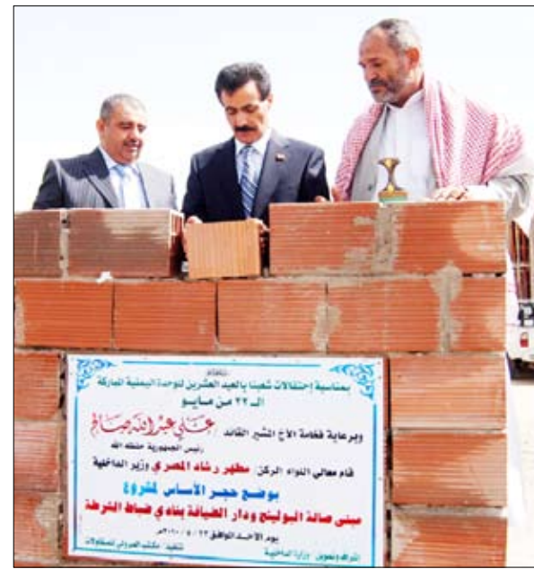
... ويضع الحجر الأساس لمشروع مبنى دار الضيافة

وكان وزير الداخلية قد تفقد خلال وضعه الحجر الأساس والمشروع مباني المنطقة الأمنية في مديرية بني حشيش متمسكاً باحتياجاتها ومتطلباتها.