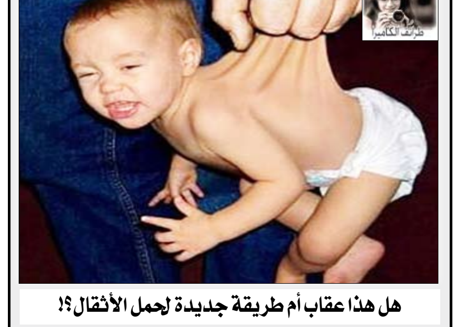
هل هذا عقاب أم طريقة جديدة لحمل الأثقال؟! طريف الكاميرون