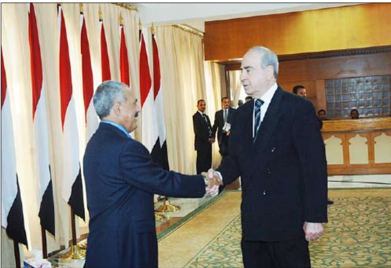
... ويستقبل طاهر المصري رئيس مجلس الأعيان الأردني