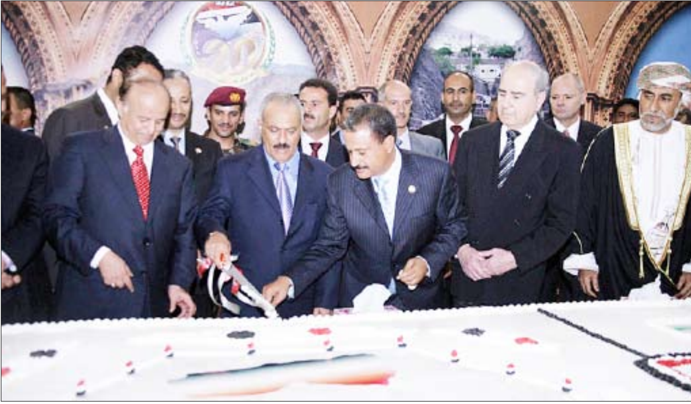
رئيس الجمهورية يقطع تورتة العيد الوطني الـ(20) للجمهورية اليمنية