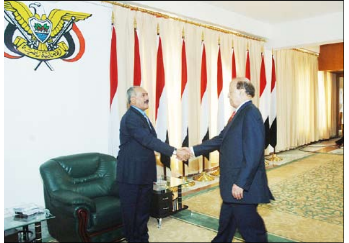
رئيس الجمهورية يستقبل عبدربه منصور في حفل الاستقبال