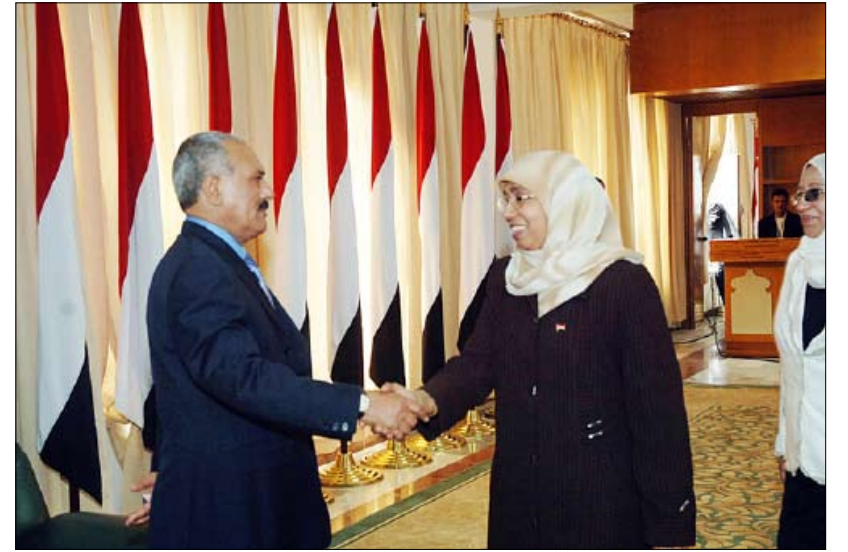
... ويستقبل أمة الزراق حُمد

لوحدة الشعب اليمني وأمنه واستقراره ودعم صموده في وجه التحديات التي تواجهه في هذه المرحلة من تاريخ الوطن . ووسط مشاعر الفرح الغامرة قام فخامة الأخ رئيس الجمهورية والمشاركون بقطع تورتة العيد الوطني الـ20 للجمهورية اليمنية 22 مايو.