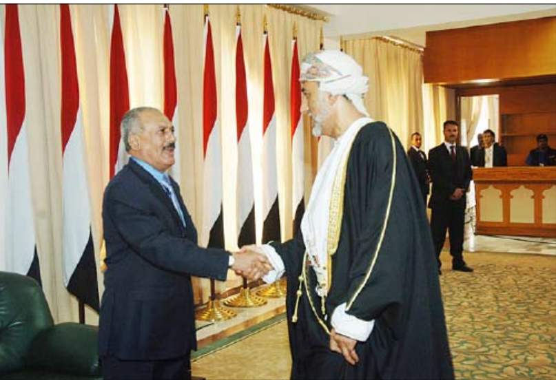
... ويستقبل مبعوث جلالة السلطان قابوس بن سعيد سلطنة عمان صاحب السمو شهاب بن طارق آل سعيد