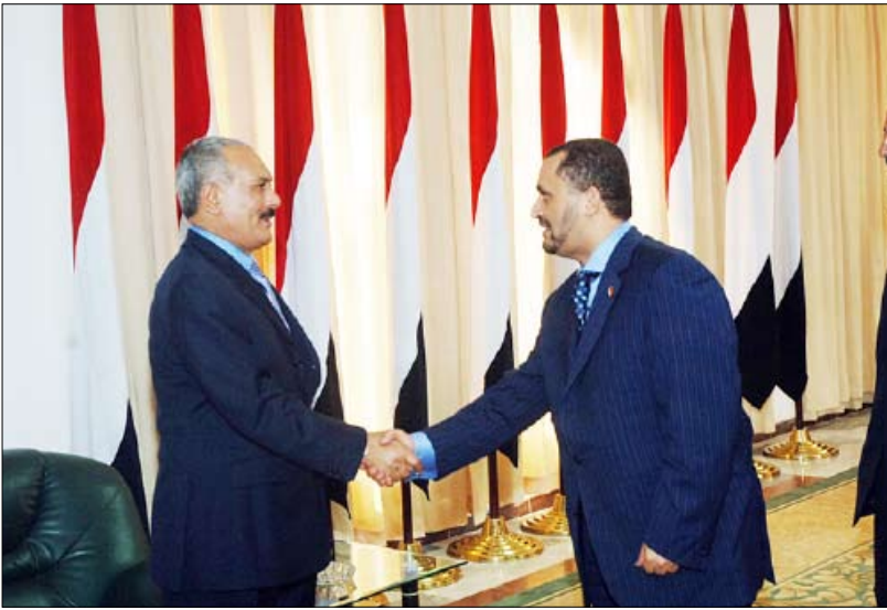
... ويستقبل نائب رئيس مجلس النواب