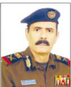
صالح حسين الزورعي

أعمال اللجان الوحدوية لتنجز مهام أعمالها في تواريخ محددة. وأضاف: يتذكر الجيل الحاضر والمعاصر للحدث التاريخي بإزالة التشظية، مخاطبة فخامة الرئيس علي عبدالله صالح لأعضاء مجلس الشورى في صنعاء عشية زيارته التاريخية لععدن في 21 مايو 1990م عندما قالها وبوضوح إنه ستواجه بعد الانتهاء من كلمته بمجلس الشورى إلى عدن ليعلمنا لشعبنا اليمني وللعالم عن قيام الجمهورية اليمنية ويرفع علمها من هناك "غدا في 22 مايو 90م ومن يريد أن يراقبني لإنجاز هذا الحلم والحدث أهلا وسهلا ومن لا يريد فعليه البقاء". وقد تفاجأ الكثير من نواب الشعب في مجلس الشورى بصنعاء بالقرار الجري والشجاع لفخامة وكثير منهم رحبوا به فقاموا