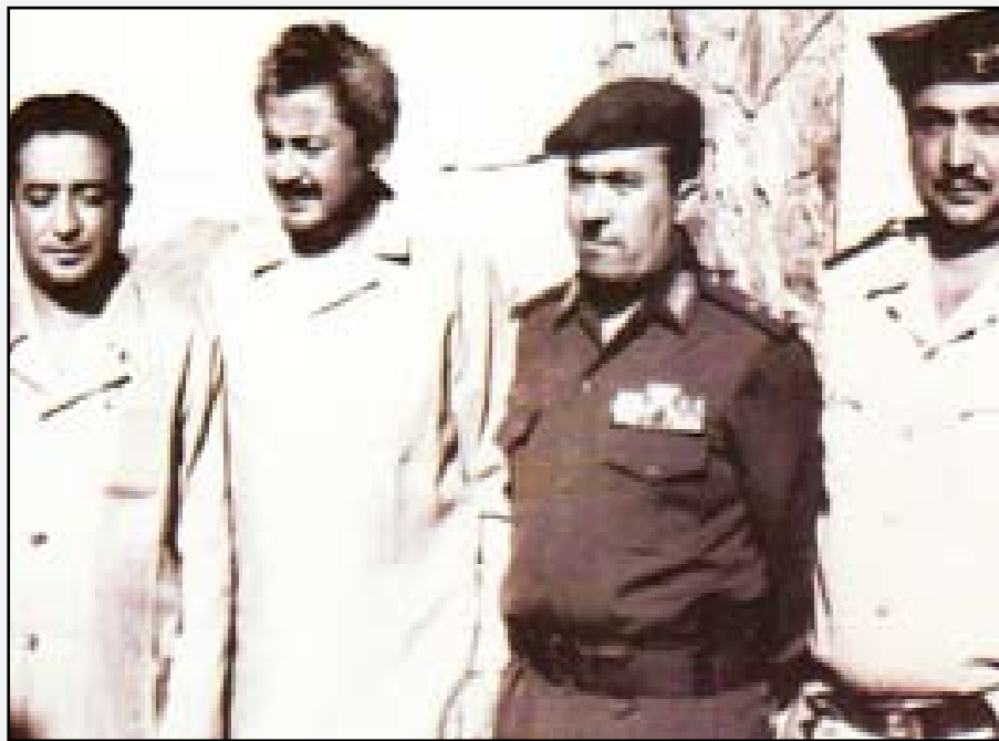
سالمين يتوسط الحمدي والغشمي في قعطبة

في الخامس عشر من فبراير 1977م عقد لقاء قمة بين الرئيسين سالم ربيع علي رئيس مجلس الرئاسة في الشطر الجنوبي من الوطن والمقدم إبراهيم محمد الحمدي رئيس مجلس القيادة في الشطر الشمالي، وهو أول لقاء يعقد بين الرئيسين. وشكل هذا اللقاء حدثاً مهماً في المسار الوحدوي بما خرج به من خطوات وحدوية مهمة أهمها الاتفاق على تشكيل مجلس تنسيق رئاسي بين الشطرين. وصادر عن هذا اللقاء البلاغ الصحفي التالي:-