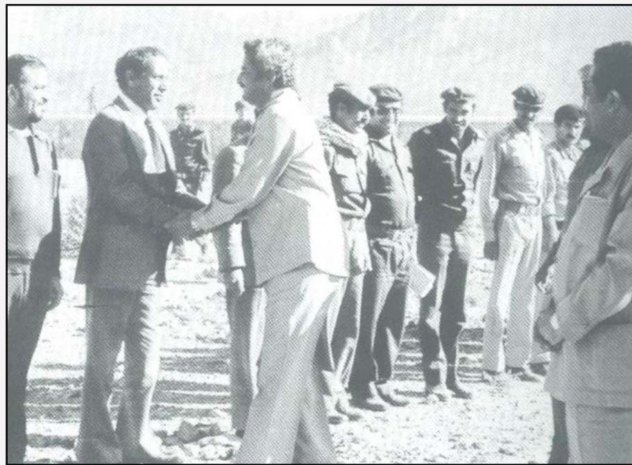
سالمين يصافح مستقبليه في قعطبة عام 1977م

تهدم الشعب اليمني وسير أعمال اللجان المشتركة في مختلف المجالات وتشكيل لجنة فرعية من الاقتصاد والتخطيط والتجارة في الشطرين مهمتها دراسة ومتابعة المشاريع الإنمائية والاقتصادية في الشطرين ورفع التقارير عنها إلى الرئيسين مع الاقتراحات بشأنها.. كما تم الاتفاق أيضاً على أن يمثل أحد الشطرين الآخر في البلدان التي لا توجد له فيها سفارات. هذا وسيعقد أول اجتماع للمجلس يوم الخامس عشر من يوليو القادم.