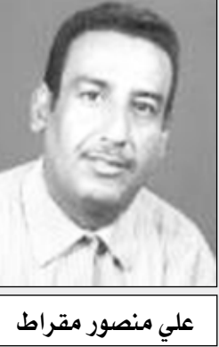
علي منصور مقرات

كانت محافظة أبين المناضلة وبوابة النصر الوحدوي كما أطلق عليها فخامة الرئيس علي عبدالله صالح عقب معركة الدفاع عن الوحدة العام 94م.. كانت أبين الثورة والوحدة والوفاء على موعد مع لحظات مباركة ونادرة بزياره فخامة الرئيس علي عبدالله صالح لتفقد أحوال أبنائها وتلمس همومهم واحتياجاتهم والتوجيه بمعالجتها مثلما عدوه في كل زيارة للمحافظة منذ عشرين عاماً.. وانتظر أبناء أبين الشرفاء صغيرهم وكبيرهم نساء ورجالا منذ الصباح الباكر مقدم الرئيس صالح بكل حرارة وشوق حقيقي ومع تباشير الساعة التاسعة صباحاً أطل الزعيم بصورته البهية على الجميع وفي موقع الصرح الاقتصادي الكبير مصنع الوحدة لاسمنت باتيس كانت وجهة الرئيس الأولى لتدشين أو بالأصح افتتاح مصنع الوحدة للإسمنت الشطري السابق للجنوب أول مشروع استثماري حيوي كبير لصناعة الإسمنت في المحافظة الغنية بهذه المادة لصاحبه المستثمر المعروف علي عبدالله العيسائي وفي ذلك المشهد الاستثنائي الرائع قصص القائد الشريط إيماناً بافتتاح الصنعة، وكان محافظ أبين أحمد الجبيري الذي استيقظ مبكراً كعادته ومعه قيادات المحافظة والمشايخ والأعيان والشيخ محمد علي العيسائي المدير التنفيذي للمصنع في استقبال الرئيس ومشاعر الجميع متبهاة