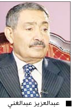
عبد العزيز عبد الغني

صنعاء / 14 أكتوبر : قال الأخ عبد العزيز عبد الغني رئيس مجلس الشورى عضو اللجنة العامة للمؤتمر الشعبي العام إن الوحدة اليمنية ليست في خطر وإنما محروسة بإرادة الله وبالتفاهد الشعب حولها . وأضاف عبد الغني أن الاحتفاء بالوحدة سيظل مناسبة تجسد الإرادة القوية لليمنيين ومفترتهم على إنجاز استحقاقات إستراتيجية وتاريخية بحجم الوحدة وهزيمة المشاريع الشاذة عن الإجماع الوطني . وأكد عبد الغني في حوار مع صحيفة الميثاق- ينشر يوم غد إن اليمن تمتلك إمكانيات متعددة لمواجهة قوى الشر وإجهاض مشاريعها الهامة وحماية مكتسبات الثورة والوحدة والديمقراطية . وأوضح الأخ عبد العزيز عبد الغني رئيس مجلس الشورى عضو اللجنة العامة للمؤتمر الشعبي العام إن جرائم القتل والتفريط واستهداف الثوابت الوطنية لن تنجح في إيقاف المسيرة الوحدوية أو إعادة عجلة التاريخ