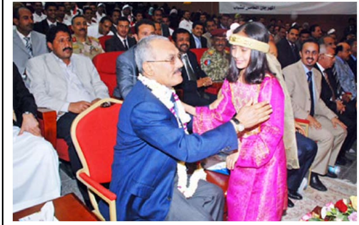
طفلة من صغيرات وطن 22 مايو تعبر عن الوفاء للقائد المسيرة الديمقراطية والوحدوية فخامة الرئيس علي عبدالله صالح رئيس الجمهورية .