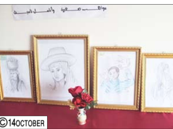
جانب من قسم الفن التشكيلي

حجة / عبد الواسع راجح : اختتمت أمس بحفاوة حجة أعمال المعرض السنوي الأول للمبدعين من الطلاب والمدرسين والذي نظمه على مدى ستة أيام مدرسة النصر الأساسية بالمدينة احتفاءً بأعياد الوحدة اليمنية المباركة وبمشاركة من جمعيته المستقبل بکلان عفار وجمعية الإصلاح بالمحافظة . المعرض الذي أقيم تحت شعار "وحدتنا نبض قلوبنا" ضم مشغولات يدوية ومسوحات متنوعة ،