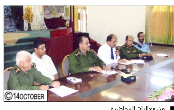
■ من فعاليات المحاضرة