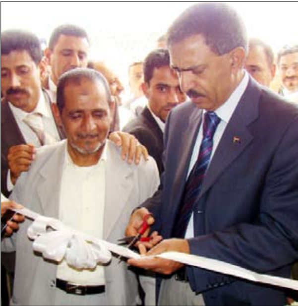
الأكووع لدى افتتاحه أحد المشاريع في أمانة العاصمة