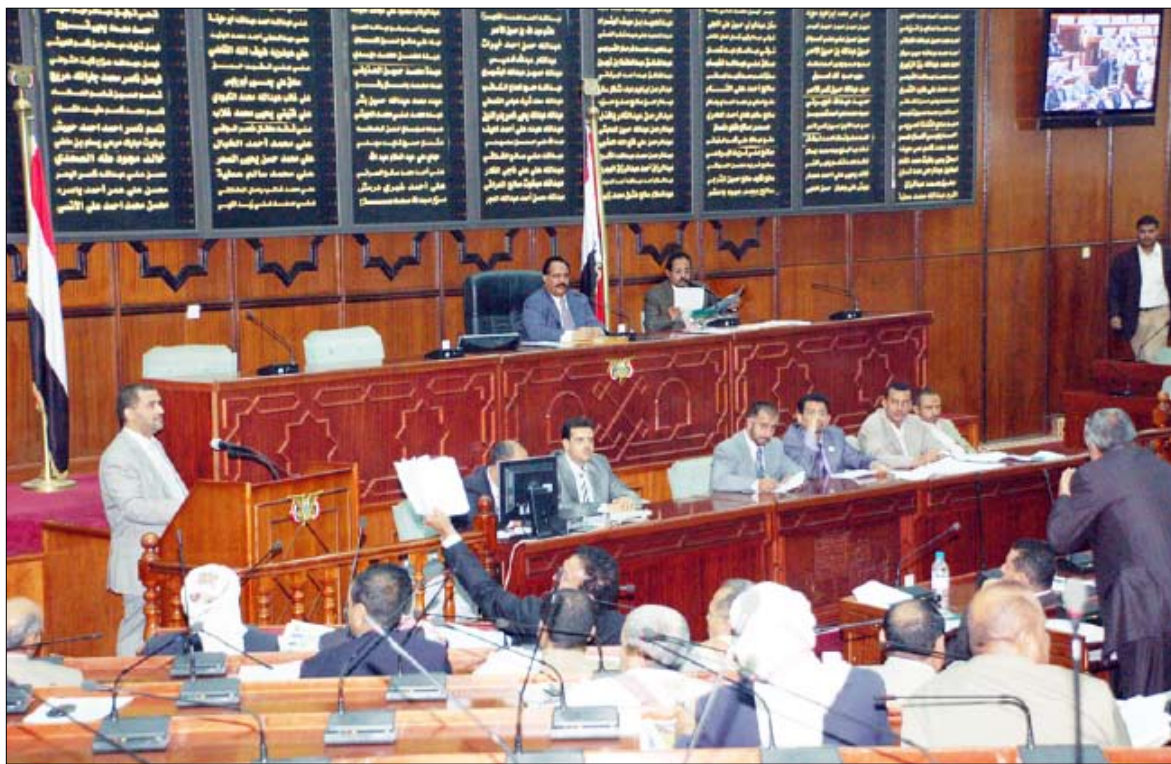
مجلس النواب في اجتماعه أمس