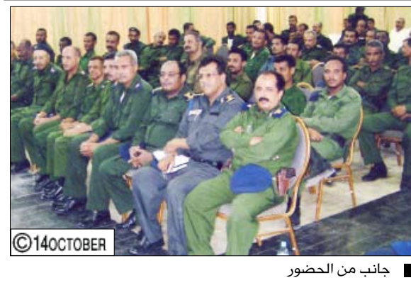
■ جانب من الحضور

النضالية الوطنية التي مرت بها اليمن إلى أن استعادت وحدتها الخالدة في 22 مايو 1990م وهي ذكرى عزيزة يستعيد فيها أبناء شعبنا اليمني العظيم ذكريات تلك اللحظات التي رفرف فيها علم الوحدة في سماء اليمن الواحد الموحد.