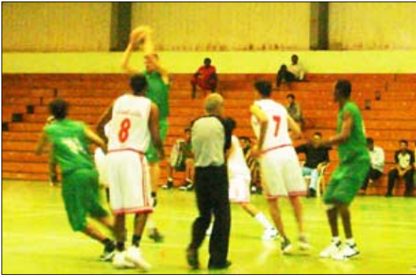
لقطات من المباراة

14 أكتوبر / فرحان التنصر : انطلقت أمس - الثلاثاء على ملعب الصالة المغلقة بعدن بطولة نخبة لكرة السلة "فئة الرجال" التي تقام بمشاركة الفرق الحاصلة على المراكز الأولى الأربعة في الدوري، وأسفرت مباراة الافتتاح التي جمعت الأهلي صنعاء بطل الدوري بشعب إب صاحب المركز الرابع، عن فوز الأهلي بـ (89 نقطة) مقابل (70 نقطة للشعب) بعد مباراة شهدت انطلاقاً قوية للشعب الذي تقدم بنهاية الفترة الثانية حتى 31 / 41 قبل أن يتراجع المررد البيني للاعبيه ويخسر أمام أقوى وأفضل الفرق اليمنية.