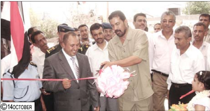
■ الجفري أثناء افتتاحه مشروع أبراج (سام للشقق)

يقدم المشروع العديد من الخدمات المتميزة للسكانين والنزلاء، بالإضافة إلى نظام أمني ونظام إطفاء الحرائق ومواقف للسيارات. وأشاد الدكتور عدنان الجفري محافظ عدن بما شاهده من إنجاز في هذا المشروع الذي يمثل ظاهرة حضارية متميزة فضلاً عن كونه يضاف إلى مشاريع الإيواء في محافظة عدن لاستضافة فعاليات خليجي (20). واعتبر الأخ المحافظ أن جملة المشاريع الاستثمارية التي تشهدها مدينة عدن تتمتع بفعاليتها من إنجاز فعاليات خليجي (20) .. داعياً كافة المستثمرين إلى إنجاز مشاريعهم في مواعيدها المحددة. حضر الافتتاح الشيخ محمد عمر بامشوموس مدير عام الغرفة التجارية والصناعية في عدن والدكتور محمد حسن عبده الشيخ مدير عام مديرية العلا وعدد آخر من المسؤولين في المديرية والمحافظ.