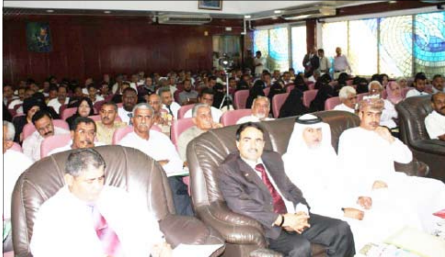
■ جانب من الحضور