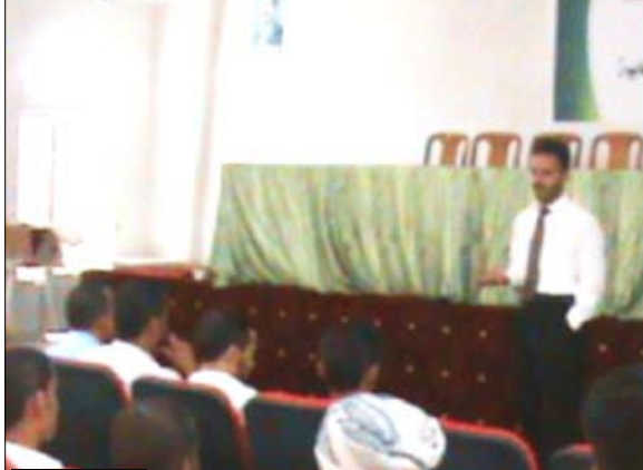
من فعاليات اختتام البرنامج التدريبي لدورة المشورة لتقديم خدمات الصحة الإنجابية

الصحة الإنجابية بمكتب الصحة، لإعطاء إلى أن الدورة خلصت إلى تعزيز العمل بمفهوم الصحة الإنجابية وتنظيم الأسرة.