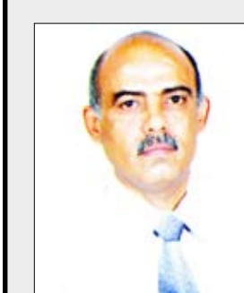
علي محمد راجح

في 22 مايو 1990م تم الإعلان عن قيام الوحدة اليمنية المباركة بأيادي أبناء اليمن الشرفاء الأحرار على قاعدة الحوار السلمي والاتفاق في 30 نوفمبر 1989م بزعامة ابن اليمن البار قائد المسيرة الوجودية البطل فخامة الأخ/ الرئيس علي عبدالله صالح رئيس الجمهورية الذي رفع علم الجمهورية اليمنية شامخاً فوق القصر الجمهوري في مدينة عدن الباسلة إيذاناً ببدء المشروع النهضوي الحديث وبداية حقيقية لمرحلة عصريّة