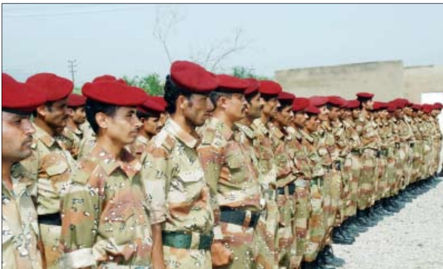
جانب من أفراد اللواء (33 مدرع)