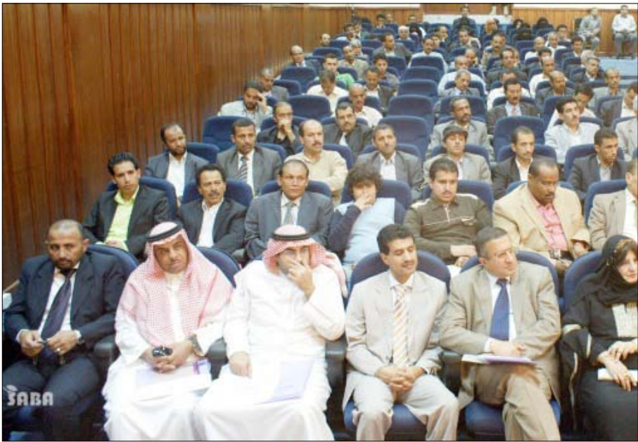
■ جانب من الحضور