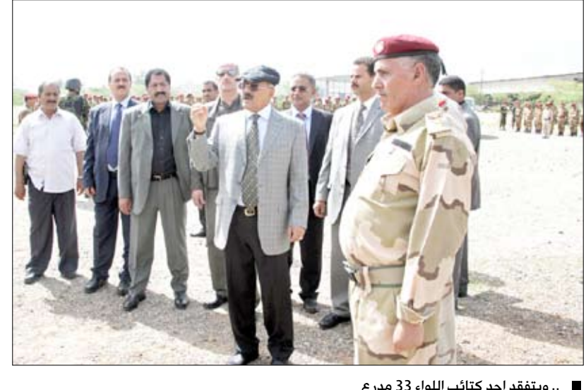
.. ويتفقد احد كتائب اللواء 33 مدرع

تعز / سيا، اشاد الأخ الرئيس علي عبدالله صالح رئيس الجمهورية القائد الأعلى للقوات المسلحة بمواقف اللواء 33 مدرع وبطولات منتسبيه وبما لمسه من روح معنوية عالية لدى منتسبيه اللواء.. مؤكداً الاهتمام بجوانب التدريب والتأهيل المستمر ومواكبة كل جديد في هذا المجال، جاء ذلك لدى قيام فخامته أمس بزيارة تفقدية لأحد كتائب اللواء 33 مدرع. وأشار فخامته رئيس الجمهورية إلى ضرورة بناء المقاتلين البناء النوعي المتطور الذي يعزز من قدراتهم ومهاراتهم القتالية منوهاً بالأدوار البطولية لأبناء القوات المسلحة والأمن في أداء الواجب والحفاظ على الأمن والاستقرار والسكينة العامة في المجتمع.