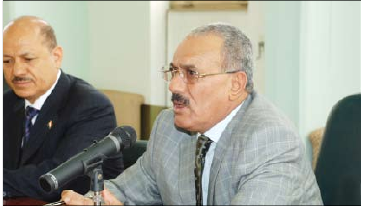
رئيس الجمهورية لدى لقائه قيادة السلطة المحلية والشخصيات الاجتماعية بلحج و ردفان