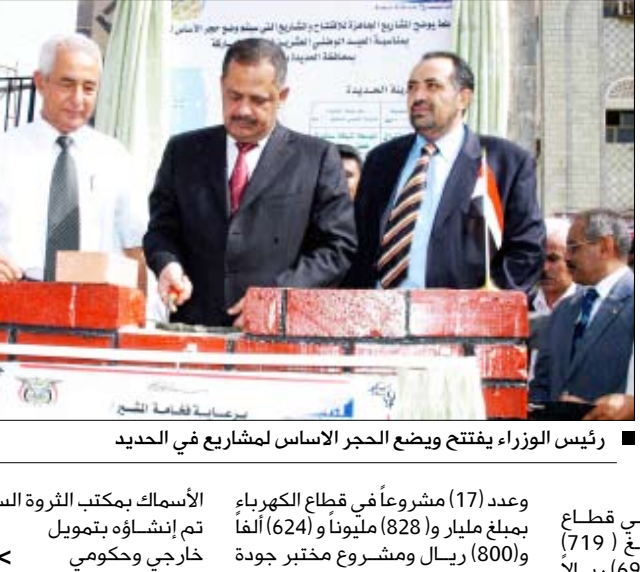
رئيس الوزراء يفتتح ويضع الحجر الأساس لمشاريع في الحديدة

العديدة / أحمد كفتاني، افتتح معالي دولة رئيس الوزراء الدكتور / علي محمد مجور ووضع الحجر الأساس لمسرح في محافظة الحديدة لأكثر من (600) مشروعاً تنموي وخدمي يكلفه (30) مليار ريال بمناسبة العيد الوطني العشرين للجمهورية اليمنية الثاني والعشرين من مايو المجيد. وقد أراح الستار ومعه وزير الاتصالات وتقنية المعلومات المهندس / كمال حسين الجبري / الهامه ووسيلته المثلثي لتحقيق الرخاء والتقدم والازدهار.