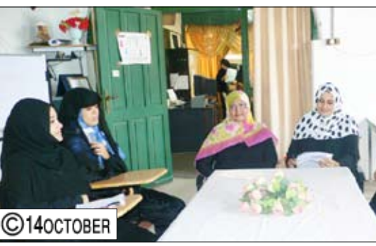
ام الخير ترأس اجتماع لجنة الحماية القانونية والمناصرة

صعاء / سبأ، أعلنت وزارة الخدمة المدنية والتأمينات أن يوم السبت القادم 22 مايو 2010م إجازة رسمية لجميع موظفي وحدات الجهاز الإداري للدولة والقطاع العام والمختلط. وبهذه المناسبة الوطنية تقفتم وزارات الخدمة المدنية والتأمينات والإعلام الفرصة لترفعوا أجمل التهاني وأطيب التبريكات إلى القيادة السياسية ممثلة بفخامة الأخ الرئيس علي عبدالله صالح رئيس الجمهورية وإلى كافة أبناء شعبنا اليمني سائليهم المولى عز وجل أن يعيد هذه المناسبة على بلادنا وأمتنا بالخير واليمن، مثل الشركة الوطنية للغاز « وكل عام وجميع بخير».