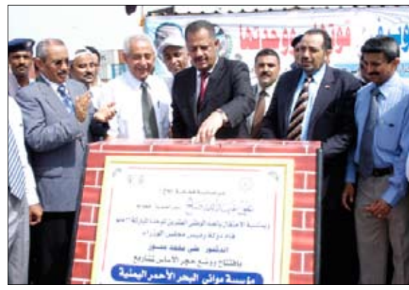
رئيس الوزراء يفتتح ويضع الحجر الأساس لمشاريع بالحديدة