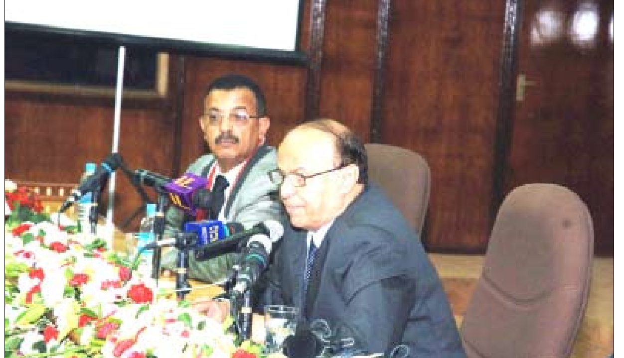
نائب الرئيس يلقي كلمته في افتتاح الملتقى التربوي