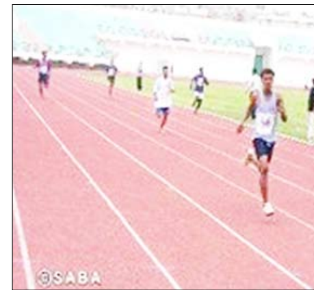
لقطة من سباق اختراق الضاحية

فيه علم الوحدة المباركة في 22 مايو 1990 م ومن أجل ذلك فإن بطولتنا وفعاليتنا تحمل مدلولاً كبيراً لان الوحدة اليمنية تسري في دماننا وارواحنا ونحتفي بها اليوم في عدن .