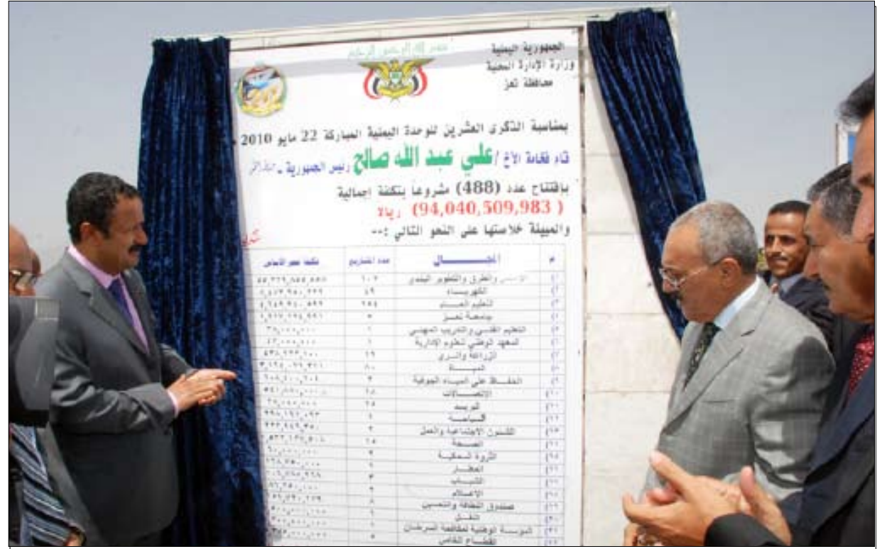
رئيس الجمهورية يفتتح ويضع الحجر الأساس لعدد من المشاريع