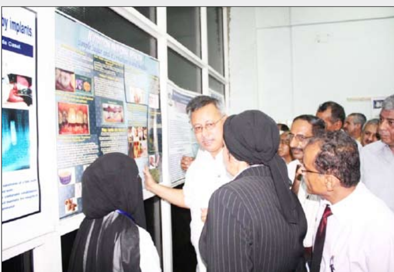
■ جانب من إبداعات طلاب كلية الأسنان