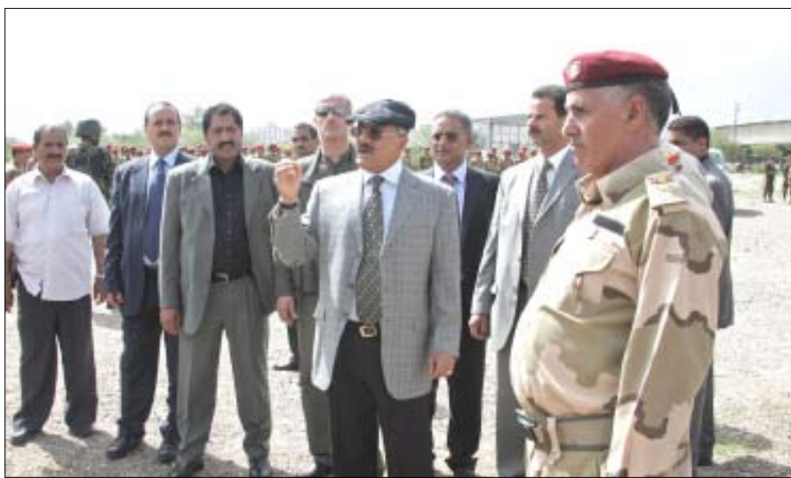
رئيس الجمهورية يتفقد إحدى كتائب (33 مدرع)