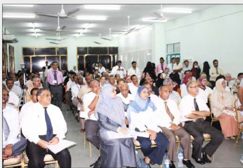
■ جانب من المشاركين في المؤتمر