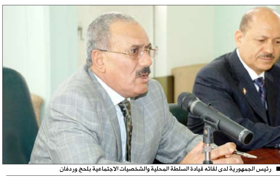
رئيس الجمهورية لدى لقائه قيادة السلطة المحلية والشخصيات الاجتماعية بلحج وردفان

تعز / سيا، قام فخامة الأخ الرئيس علي عبدالله صالح رئيس الجمهورية أمس بافتتاح ووضع الحجر الأساس لعدد 902 مشروعاً في محافظة تعز بكلفة 203 مليارات و666 مليون ريال وذلك في إطار احتفالات شعبنا بالعيد الوطني العشرين للجمهورية 22 مايو. وقد قام فخامة الأخ الرئيس فور وصوله بتدشين المشاريع حيث بلغ عدد المشاريع التي تم افتتاحها 485 مشروعاً بكلفة 93 مليارات و226 مليوناً و892 ألف ريال بتمويل حكومي ومحلي وخارجي.