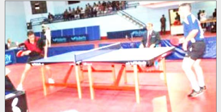
لقطة تنس طاولة

المحافظات، التي ينظمها الاتحاد العام للعبة حتى 21 من الشهر الجاري، بمشاركة 110 مشاركين بين لاعبي واداري