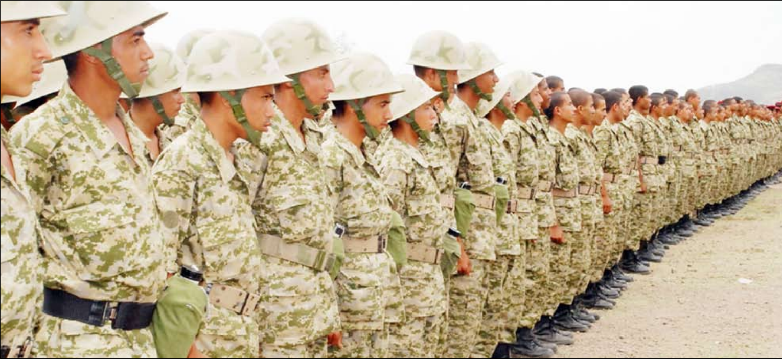
جانب من منتسبو معسكر اللواء 14 مدرع حرس جمهوري