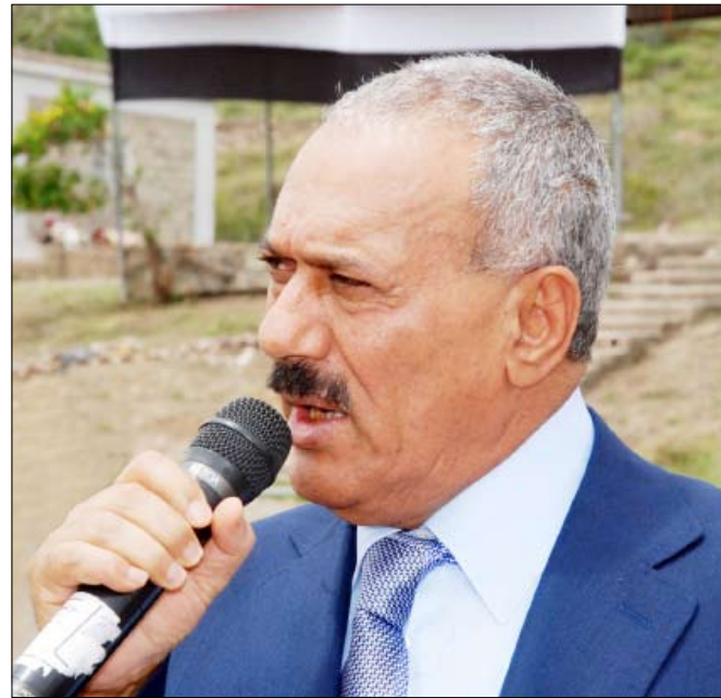
رئيس الجمهورية يلقي كلمته أثناء زيارته معسكر اللواء 14 مدرع حرس جمهوري بتعز أمس

تعز / سبأ: أكد فخامة الأخ الرئيس علي عبدالله صالح رئيس الجمهورية القائد الأعلى للقوات المسلحة أهمية مواصلة الجهود في مسيرة البناء والتحديث للمؤسسة الوطنية البطلية وعلى مختلف الأصعدة تجهيزاً واعداداً وتسليحاً ورفدها بكل ما هو حديث ومتطور في مجال البناء العسكري .. مشدداً على ضرورة التحلي باليقظة والاستعداد والوعي في أداء الواجب. جاء ذلك خلال زيارة امس إلى معسكر اللواء 14 مدرع حرس جمهوري واطلاعه على سير برامج التدريب والتأهيل فيه. وحت فخامته منسب المعسكر على المزيد من التدريب والتأهيل واكتساب الخبرات والمهارات القتالية في ميادين التدريب وأداء الواجب والمزيد من الانضباط والاهتمام بالمظهر العسكري .. مشيراً إلى ما يتمتع به المقاتلون في صفوف القوات المسلحة اليوم من تدريب عال ونوعي يؤهلهم لأداء واجباتهم ومهامهم تحت مختلف الظروف. وعبر عن تقديره للجهود التي تبذلها قيادة المركز والمدربين في تأهيل الأفراد واعدادهم الاعداد النوعي الرفع في المجال العسكري واكتساب المهارات القتالية .. مؤكداً أن البناء النوعي هو المرتكز في عملية البناء والتحديث التي تشهدها القوات المسلحة .