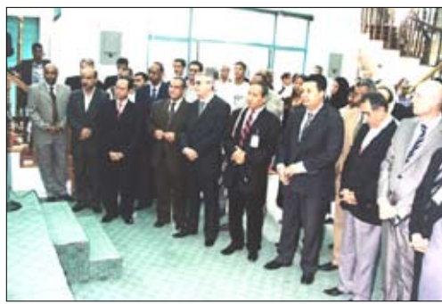
من فعاليات ملتقى صنعاء الدولي الثالث للفنون التشكيلية

الجمهورية.. متمنياً أن يحقق الملتقى أهدافه المنشودة وان يكمل بالإنجاح. من جهته أنقى مدير عام الفنون بوزارة الثقافة الفرنسية جورج فرانسوا هيرش كلمة أشاد فيها بمستوى العلاقات اليمنية الفرنسية وخاصة التعاون في المجالات الثقافية والفنية.. مؤكداً حرص الحكومة الفرنسية على تقوية علاقات التعاون الثنائي في المجالات الثقافية من خلال العديد من الأفكار والأنشطة في مجال المسرح والموسيقى وغيرها من المجالات التي من شأنها تعزيز وتطوير علاقات التعاون بين البلدين الصديقين.