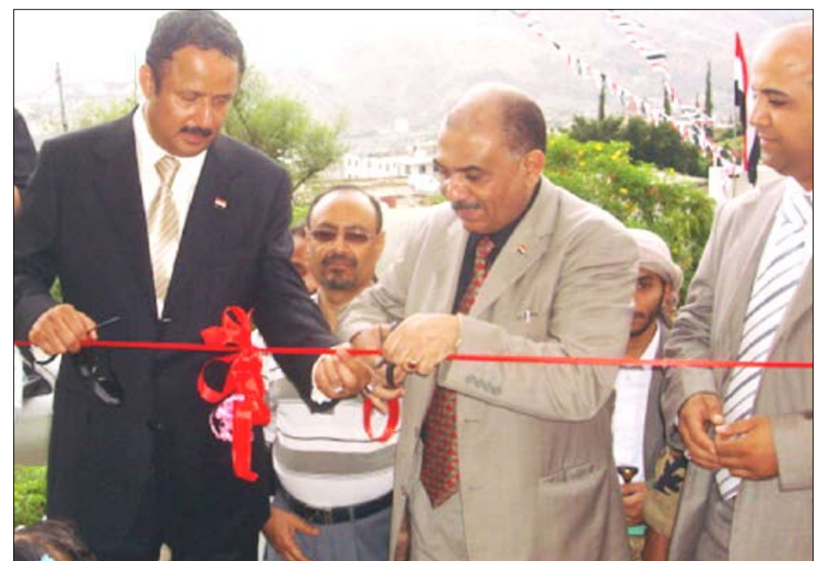
وزير الإعلام يفتتح محطة الإرسال التابعة للإذاعة تعز

وقد عبر الوزير اللوزي في برنامج البث المباشر من إذاعة تعز عقب الافتتاح والتدشين عن سعاده بتدشين هذا المشروع الجوي الهام والذي سيضيف قيمة نوعية ومعنى جليلاً لإذاعة تعز ودورها في حياة الثورة والوحدة والتنمية. وأستعرض اللوزي الدور العظيم للكلمة في إذاعة تعز إبان الثورة وما تبعها من تطورات والتي كان لها وقع شديد التأثير على أعداء الثورة كما كان لها الأثر أيضا في صنع تاريخ الوحدة والدفاع عنها في حرب صيف 94. وقال ان هذا الإنجاز الكبير في العيد الوطني الكبير يعطي التأكيد على الرؤية التغييرية لدى فخامة الأخ الرئيس علي عبدالله صالح والتحديث والتطوير في صلب الحياة الثقافية من خلال توجيهات فخامته في التوسع بإنشاء الإذاعات. من جانبه قال محافظ تعز حمود خالد الصوفي بابتهاج كبير نستهل احتفالنا بهذا الإنجاز النوعي الرابع بإذاعة تعز التي ارتبطت ارتباطاً مباشراً بالجمهور.