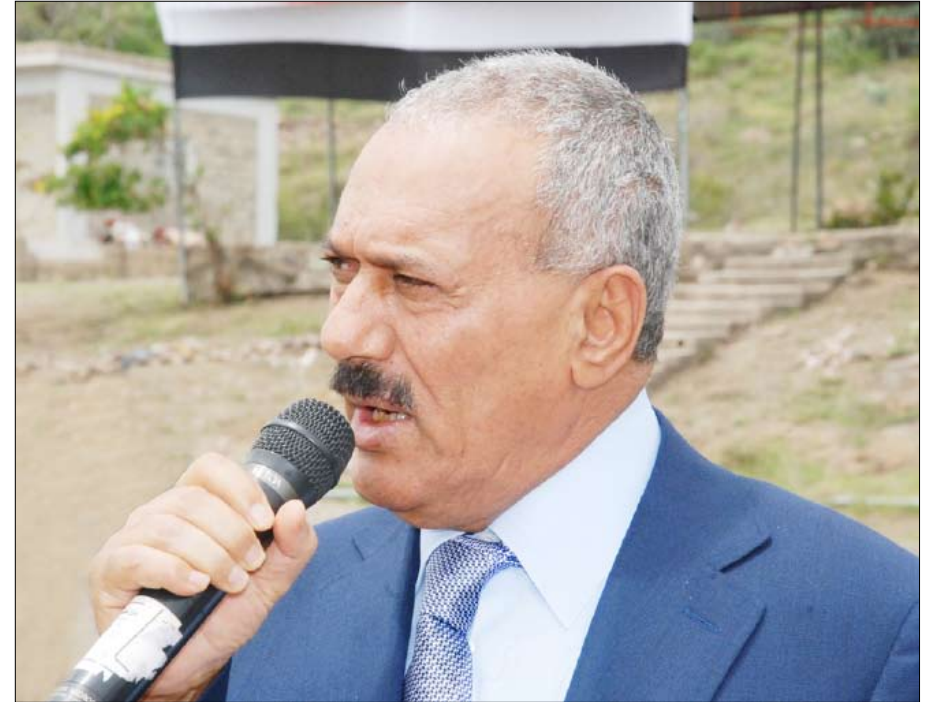
رئيس الجمهورية يتحدث إلى الإخوة الضباط والصف والجنود في معسكر اللواء 14 مدرع حرس جمهوري