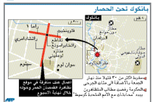
مسلوب أكثر من 30 قتيلاً منذ تدهور الجمعة بالإضافة إلى مئات الجرحى الحكومة رفضت مطالب المتظاهرين ببدء محادثات مع الأمم المتحدة كوسيلة خلال نهاية الأسبوع

بانكوك / منابع: انتهت المهمة التي حددتها الحكومة التايلاندية للمحتجين من أصحاب القمصان الأحمر لإخلاء مواقع الاحتجاج في قلب العاصمة بانكوك أمس، في حين لم يتوصل طرفا النزاع إلى اتفاق لوقف هذه الاحتجاجات التي أوقعت 66 قتيلاً منهم 37 سقطوا خلال الأربعة أيام الماضية فقط إضافة إلى 1600 جريح.