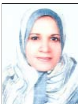
أمل عبد المولى

كنت قد تناولت في عدد سابق حكاية تتكلم عن معنى الصمت في حياتنا وكيف أن السكوت يكون أحياناً ذهباً حقيقياً، واليوم وأصل لكم حكاية جديدة فيها العبرة عن نعمة السكوت وكيف أن الكلام قد يؤدي صاحبه. يحكى أن ثلاثة أشخاص حكم عليهم بالإعدام بالمقصلة، وهم عالم دين- ومحام- وفيزيائي وعند لحظة الإعدام تقدم ( عالم الدين ) ووضعوا رأسه تحت المقصلة ، وسألوه : هل هناك كلمة أخيرة تود قولها؟ فقال ( عالم الدين ) : الله.. هو من سينقذني وعند ذلك أنزلوا المقصلة، فنزلت المقصلة وعندما وصلت لرأس عالم الدين توقفت . فتعجب الناس، وقالوا: أطلقوا سراخ عالم الدين فقد قال الله كلمته. ونجا عالم الدين .. وجاء دور المحامي إلى المقصلة .. فسألوه : هل هناك كلمة أخيرة تود قولها؟ فقال : العدالة.. هي من سينقذني. ونزلت المقصلة على رأس المحامي ، وعندما وصلت لرأسه توقفت . فقال الناس: أطلقوا سراخ المحامي ، فقد قالت العدالة كلمتها ، ونجا المحامي وأخيراً جاء دور الفيزيائي .. فسألوه : هل هناك كلمة أخيرة تود قولها؟ فقال : أنا لا أعرف الله كعالم الدين ، ولا أعرف العدالة كالمحامي ، ولكني أعرف أن هناك عقدة في حبل المقصلة تمنع المقصلة من النزول .. فنظروا للمقصلة ووجدوا فملاً عقدة تمنع المقصلة من النزول ، فأصلحوا العقدة وانزلوا المقصلة على رأس الفيزيائي وقطع رأسه وكانت نهايته بكلمة من لسانه. وفيما يلي بعض الحكم عن الصمت.. * ندمن على السكوت مرة .. وندمن على الكلام مرارا. * الصمت هو العلم الأصعب من علم الكلام. * الصمت إجابة بارعة لا يتقنها الكثيرون. * الألفاظ هي الثياب التي ترتديها أفكارنا . . فيجب ألا تظهر أفكارنا في ثياب رثة بالية. * إذا تكلمت بالكلمة ملكتك وإذا لم تكلم بها ملكتها.