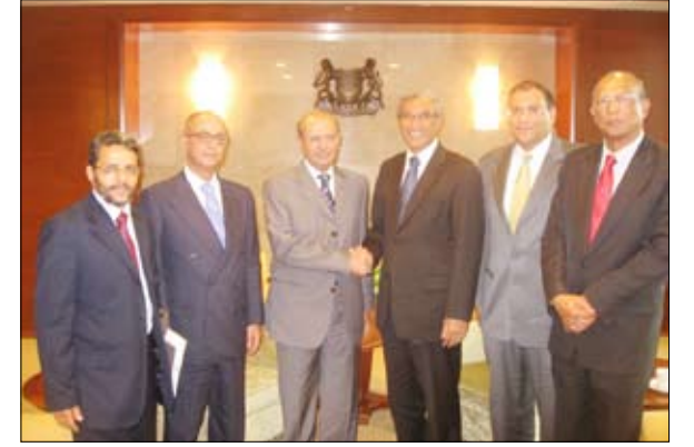
وزير الخارجية يلتقي وزير الدولة للشؤون الخارجية السنغافورية

□ سنغافورا / سبأ: دشن وزير الخارجية الدكتور أبو بكر عبدالله القري أمس مع وزير الدولة للشؤون الخارجية السنغافورية زين العابدين راشد علاقات التعاون الثنائي بين البلدين وسبل تعزيزها وتطويرها. كما استعرض الجانبان مجمل القضايا الإقليمية والدولية ذات الاهتمام المشترك.