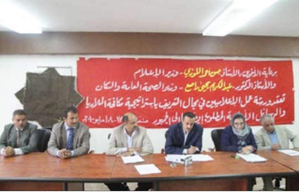
ورشة عمل الاعلاميين في مجال التعريف باستراتيجية مكافحة الملاريا