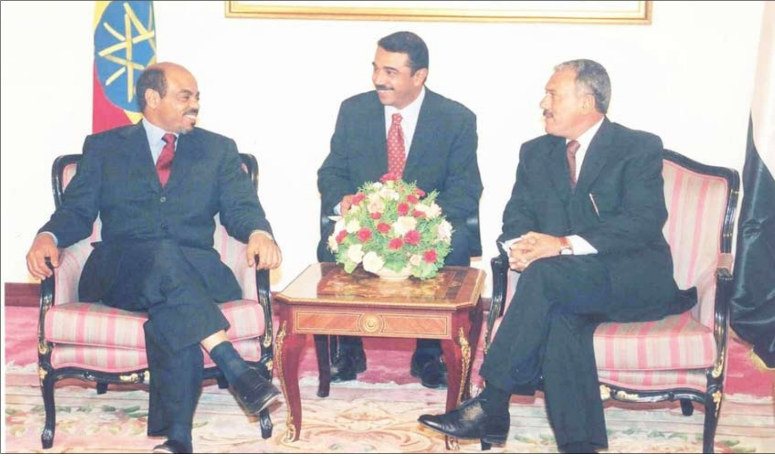
رئيس الجمهورية لدى لقائه ميليس زيناوي رئيس وزراء أثيوبيا

في الـ 27 من شهر آيار "مايو" الجاري 2010م تحتفل جمهورية أثيوبيا الديمقراطية الفدرالية الصديقة - قيادة وشعباً - بعيدها الوطني الـ 19 الذي تحقق في مثل هذا التاريخ المجيد عقب الإطاحة بنظام حكم "الدرق" العسكري الديكتاتوري المخلوع بقيادة الكولونيل منجستو هيلما ماريام عام 1991م.. وبهدف تسليط المزيد من الأضواء حول الدلالات والأبعاد الحقيقية لهذه المناسبة والتعرف عن كثب على طبيعة الإنجازات والتحول التي شهدتها هذه الدولة الصديقة والمجاورة "أثيوبيا" خلال الأعوام المنصرمة، التقت صحيفة "14 أكتوبر" سعادة الأخ الدكتور توفيق عبدالله أحمد ، سفير جمهورية أثيوبيا الديمقراطية الفيدرالية الصديقة بصنعاء جرى خلاله استعراض وتقييم العلاقات الثنائية اليمنية - الأثيوبية الحاضر والآفاق التطويرية بالإضافة إلى تناول عدد من القضايا والمواضيع المهمة الأخرى .. وفيما يأتي نص المقابلة.