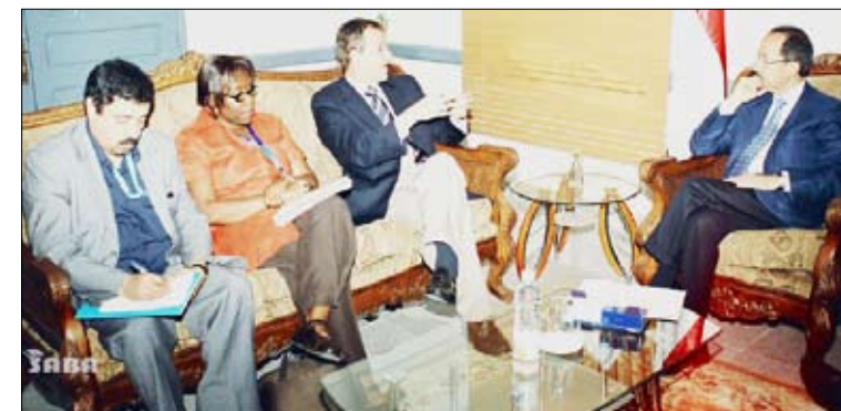
... ويلتقي الممثل المقيم الجديد لمنظمة اليونيسيف بصنعاء جيت كابيليري