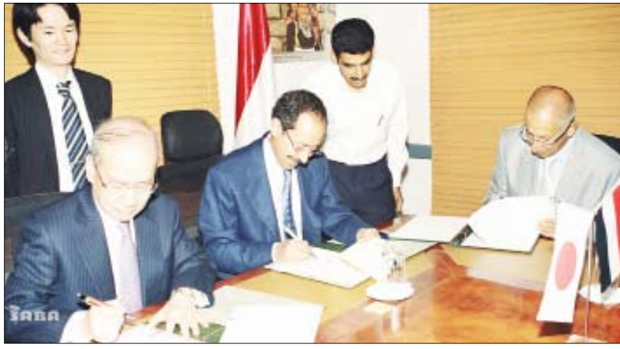
أثناء توقيع اتفاقية المنحة اليابانية المقدمة لمشروع مياه الريف

□ صنعاء / سبأ: وقع أمس بوزارة التخطيط والتعاون الدولي على اتفاقية المنحة اليابانية المقدمة لمشروع مياه الريف بقيمة 17 مليون دولار. وتقتضي الاتفاقية التي وقعها نائب رئيس الوزراء للشؤون الاقتصادية وزير التخطيط والتعاون الدولي عبد الكريم إسماعيل الاحريبي ووزير المياه والبيئة عبد الرحمن الإرياني وعن الجانب الياباني السفير الياباني بصنعاء " ميتسونوري ناميا" بتقديم الحكومة اليابانية مبلغ "17 مليون دولار تكريس في تنفيذ مشاريع مياه الريف في خمس محافظات هي صنعاء والمحويت ودمار واب وتغز بهدف تسهيل حصول المواطنين على المياه في المحافظات الخمس المذكورة. وعقد التوقيع أشاد نائب رئيس الوزراء للشؤون الاقتصادية بإسهامات الحكومة اليابانية في دعم جهود الحكومة اليمنية الهادفة إلى تطوير مشاريع مياه الريف وتأهيل مرافق امدادات المياه. مؤكداً حرص اليمن على