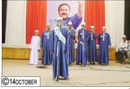
من الحفل الخطابي والتكريمي للشباب الفائزين بجوائز رئيس الجمهورية

اللّه. مضيفاً ان اعتماد هذه المنافسة سنوية ولمرة واحدة في مجال الإبداع الشبابي في تقديرنا ليست كافية، بل ينبغي أن يعتمد المجتمع والسلطات المحلية أشكالاً أخرى للمنافسة وتقديم وعرض المنتجات الإبداعية للشباب وتقديمها للمجتمع للتعرف على أفكارهم وهمومهم ومعاناتهم تلك التي عبروا عنها وصاغوها في قوالب أدبية وفنية في شكل قصيدة أو قصة أو مسرحية ولوحة فنية ولحن وتلك التي تتكشف مهاراتهم وقدراتهم في التمثيل والغناء.