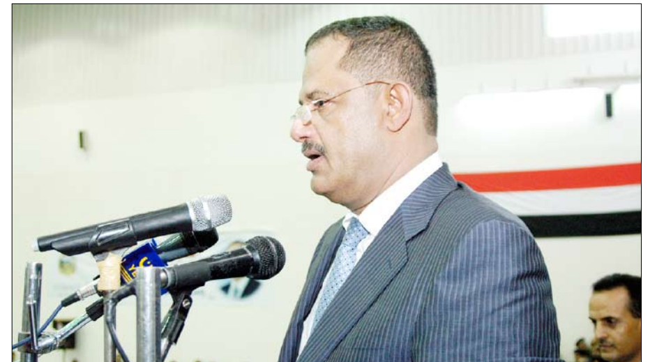
■ رئيس الوزراء في المهرجان الجماهيري في حجة