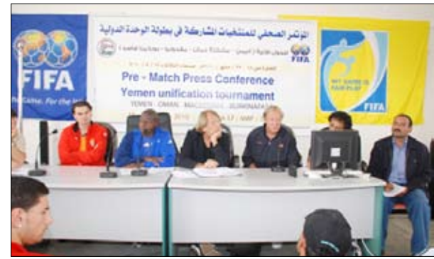
الاجتماع الفني والمؤتمر الصحفي