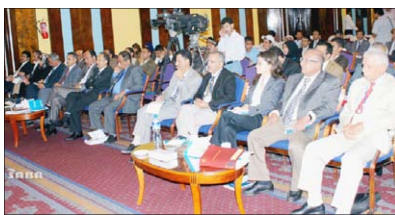
■ جانب من الحضور في المؤتمر

المواضيع التي تتناولها هي مواضيع الساعة التي تتطلب منا جميعاً أن نشغل بروج المثابرة والعلم. من جانبه أشار الدكتور حسين العمري رئيس