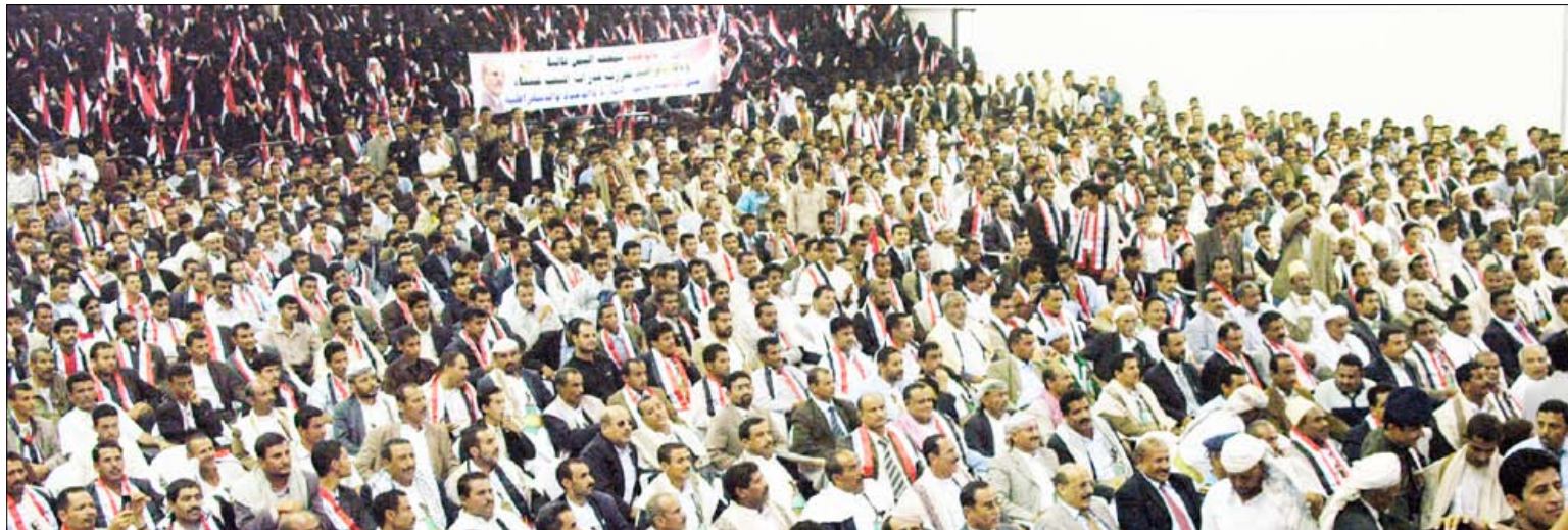
■ جانب من المشاركين في المهرجان