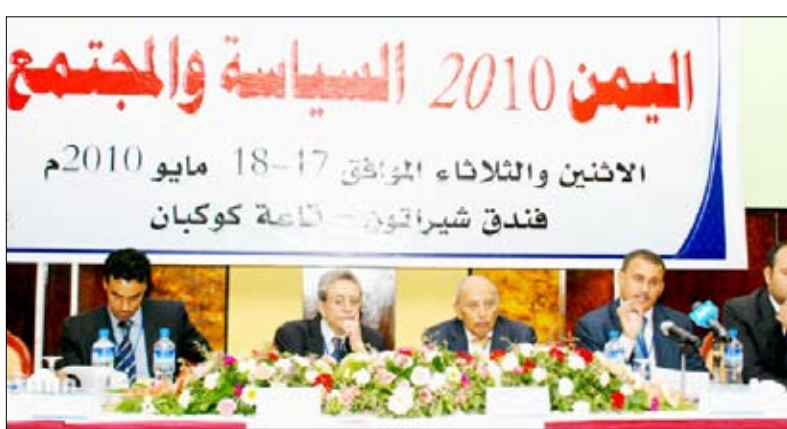
■ د. الإرياني يفتتح مؤتمر اليمن 2010م السياسية والمجتمع

وسيقدم المؤتمر أعماله اليوم الثلاثاء بعدد من التوصيات المنبثقة عن أوراق العمل المقدمة.