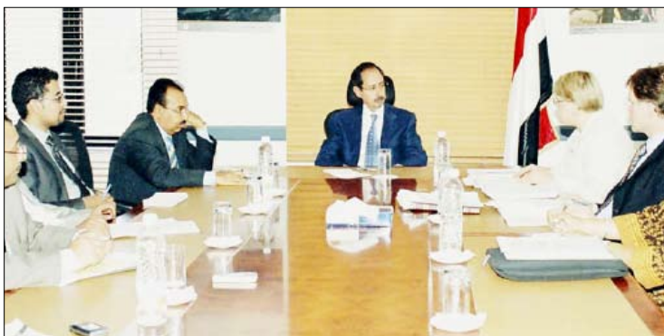
... الأرحبي يلتقي المدير الإقليمي لمنطقة الشرق الأوسط وشمال أفريقيا بالبنك الدولي ديفيد كريك

وزير التخطيط والتعاون الدولي عبد الكريم إسماعيل الأرحبي أمس المدير الإقليمي لمنطقة الشرق الأدنى وشمال أفريقيا بالبنك الدولي ديفيد كريك. وجرى خلال اللقاء استعراض أوجه التعاون القائم بين اليمن والبنك الدولي وسبل تعزيزه وتطويره بما يخدم الأهداف المشتركة. وفي اللقاء أشاد نائب رئيس الوزراء للشؤون الاقتصادية بإسهامات البنك الدولي في دعم وتعزيز جهود الحكومة اليمنية في مجال تطبيق الإصلاحات مؤكدا حرص اليمن على تعزيز وتطوير أطر التعاون الثلاثي مع البنك الدولي. وجدد المدير الإقليمي لمنطقة الشرق الأدنى وشمال أفريقيا بالبنك الدولي حرص البنك الدولي على تقديم كافة أوجه الدعم المتاح لليمن مشيدا بمستوى التعاون القائم بين اليمن والبنك الدولي.