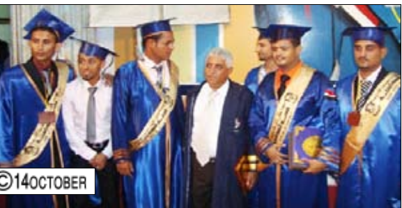
من الحفل التكريمي بتخرج دفعة من قسم المحاسبة بكلية العلوم الإدارية