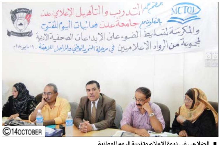
الضلاحي في ندوة الإعلام وتنمية الروح الوطنية