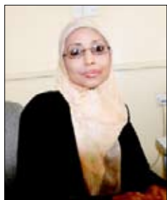
إيفاق سلطان سبأ

كشفت دراسة حديثة عن ارتفاع معدل البطالة في أوساط الشباب في اليمن إلى 37% من العاملين الداخليين حديثاً إلى سوق العمل، والذين لم يسبق لهم العمل من قبل. وأظهرت الدراسة التي أعدها منظمة العمل الدولية المكتب الإقليمي للدول العربية - خلال العام 2009م - أن اليمن تشكل نسبة عالية من جيل الشباب، وتعتبر من أكثر الدول عرضة لارتفاع معدل البطالة فيها، وذلك بسبب ضعف نظام التعليم وغياب المهارات لدى الشباب، فضلاً عن الفجوة القائمة بين العرض والطلب للقوى العاملة، وضعف فرص تهئية الشباب لدخول سوق العمل.