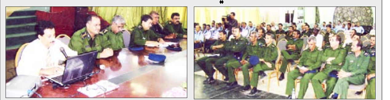
من ندوة تاريخ الوحدة اليمنية ومنجزاتها بنادي ضباط الشرطة