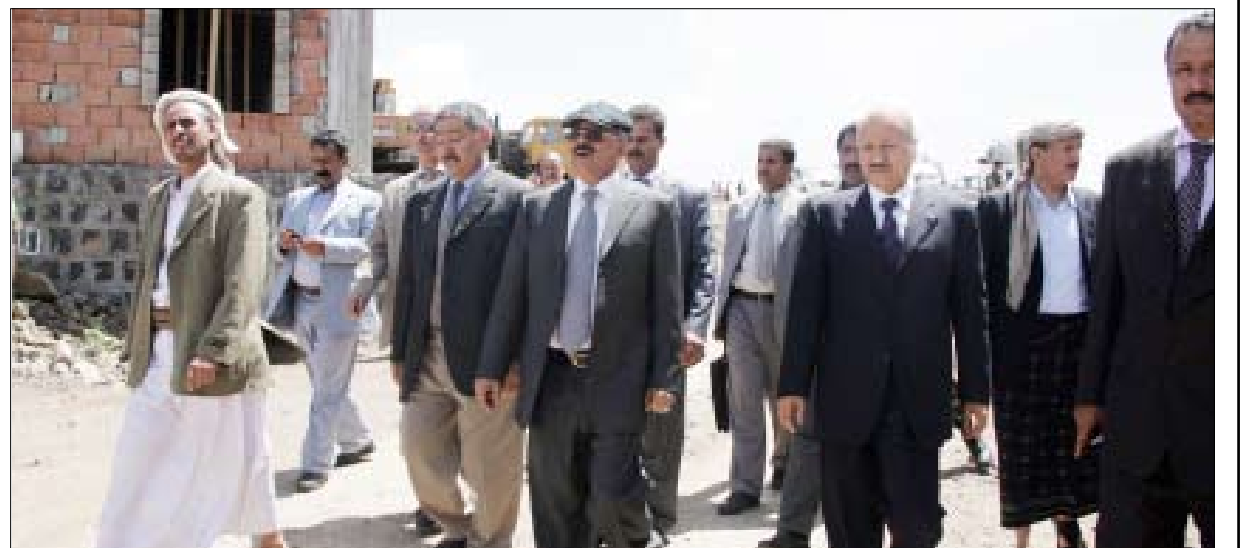
رئيس الجمهورية في زيارته الميدانية لمشروع الصالح السكني