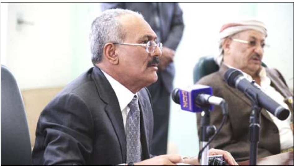
رئيس الجمهورية يتحدث إلى أعضاء ملتقى "رجال من أجل اليمن"