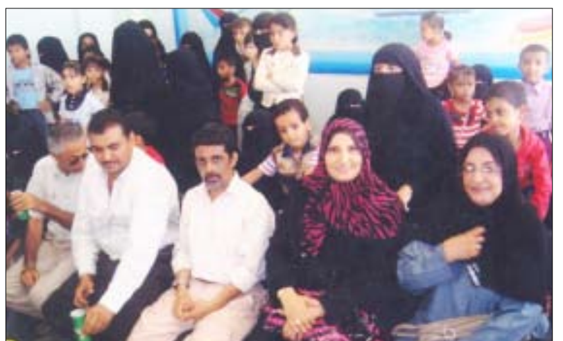
جانب من الضيوف