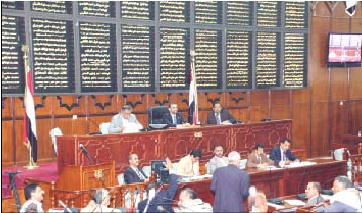
البرلمان في جلسته أمس

مسئولي تلك الجهات وإعداد مشاريع تقارير اللجان الفرعية والتي تضمنت تحليلاً للأرقام والمؤشرات التي أسفر عنها تنفيذ موازنات عام 2008م مقارنة بالمستهدف في الموازنات مع إبراز الاختلالات التي ظهرت من واقع عملية الدراسة التي قامت بها اللجان الفرعية، ووفقاً لما أورده الجهاز المركزي للرقابة والمحاسبة في تقاريره عن الحسابات الختامية. واختتمت تلك التقارير بالتوصيات الهادفة إلى معالجة الاختلالات وجوانب القصور التي رافقت تنفيذ الموازنات العامة وإحالة مشاريع تقارير اللجان الفرعية إلى لجنة الصياغة التي قامت بدورها بتهيئة تقرير اللجنة في ثلاثة أجزاء تضمنت نتائج دراسة حسابات الموازنة العامة للدولة وحسابات موازنات كل من السلطة المركزية والسلطة المحلية وتتلخ نتائج دراسة حسابات موازنات الوحدات المستقلة والمحلفة والصناديق الخاصة. وكذا نتائج دراسة حسابات موازنات وحدات القطاع الاقتصادي العام والمختلط. وكان المجلس قد استهل جلسته باستعراض محضر جلسته السابقة ووافق عليه، وسيواصل أعماله صباح اليوم الاثنين بمشيئة الله تعالى.