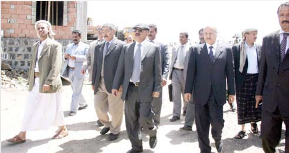
رئيس الجمهورية يتفقد عدداً من المشاريع الخدمية والإنمائية بتعز

تعزيز سيا: قام فخامة الأخ رئيس الجمهورية بزيارة تفقدية لعدد من المشاريع الخدمية والإنمائية التي يجري تنفيذها في محافظة تعز. وقد زار مشروع الخط الدائري السادس الذي يربط بين المطار الجديد ومنطقة حذران طريق الحديدية تعز بطول 26 كيلومتراً و100 متر وبكلفة 4 مليارات ريال. ويستهدف المشروع تخفيف الضغط على حركة السير داخل المدينة، بالإضافة إلى إيجاد تجمعات سكنية جديدة خارج مناطق الازدحام السكاني. وزار فخامة الأخ رئيس الجمهورية مشروع الصالح السكني في منطقة الحويان مفرق ماوية، واطلع على سير العمل في المرحلة الأولى من المشروع التي تتكون من 860 شقة بكلفة أربعة مليارات وخمسمائة مليون ريال، وتتكون من 43 عمارة كل عمارة تحتوي على خمسة أدوار وكل دور يضم أربع شقق وتبلغ نسبة الإنجاز في المشروع حتى الآن حوالي 50 بالمائة. وخت فخامة الأخ الرئيس على سرعة إنجاز المشروع طبقاً للمواصفات المحددة وأن يتم توزيعه على ذوي الدخل المحدود المستحقين للسكن طبقاً لشروط ميسرة.