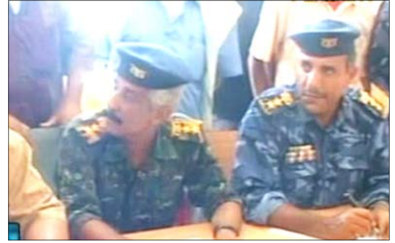
محافظ لحج لدى اجتماعه أمس بمدراء مديريات ردفان وعدد من الشخصيات الاجتماعية والمشايخ والأعيان

الأعمال التخريبية التي يرفضها أبناء مديريات ردفان. إلى ذلك عقدت اللجنة الأمنية الفرعية بمحافظة لحج اجتماعاً برئاسة الأخ/محسن النقيب محافظ المحافظة تم فيه تقييم الموقف الأمني في مديريات ردفان الأربع والسبل الكفيلة بحفظ الأمن والإجراءات المتخذة لملاحقة وضبط الجماعات المسلحة من العناصر التخريبية الخارجة على النظام والقانون لضبطهم وتقديمهم للعدالة لينالوا جزاءهم وليكونوا عبرة لمن تسول له نفسه المساس بأمن واستقرار الوطن ومنجزاته والمساس بالتراث الوطني وفي مقدمتها الوحدة الوطنية. وقد خرج الاجتماع بجملة من الاستنتاجات الهادفة لتعزيز الأمن والاستقرار في ردفان بشكل عام.