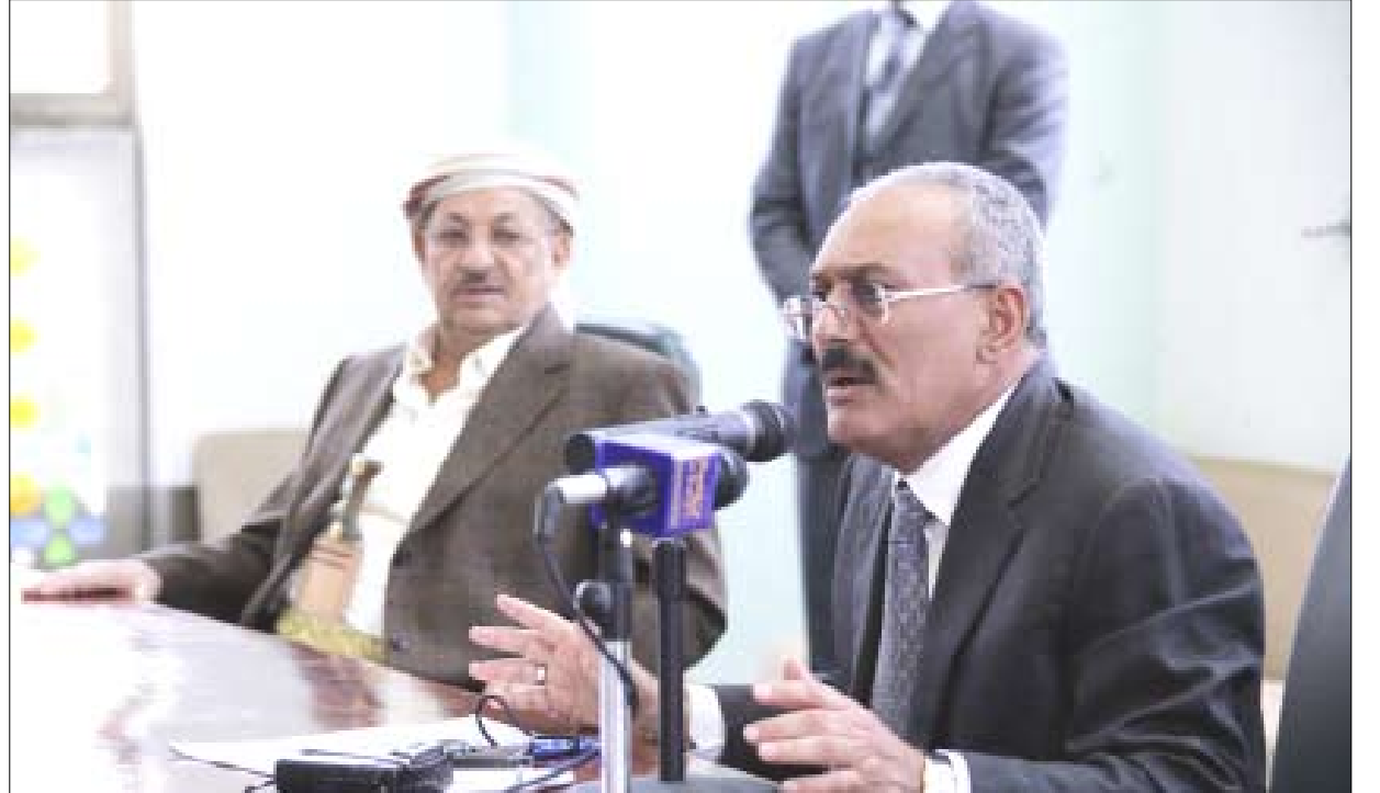
رئيس الجمهورية يتحدث إلى أعضاء ملتقى (رجال من أجل اليمن)