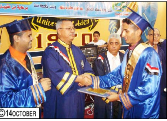
من الحفل التكريمي بتخرج دفعة من قسم المحاسبة بكلية العلوم الإدارية