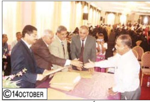
شائف يكرم عدداً من العاملين المتميزين في عدن