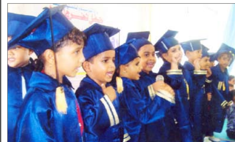
جانب من الأطفال المتخرجين