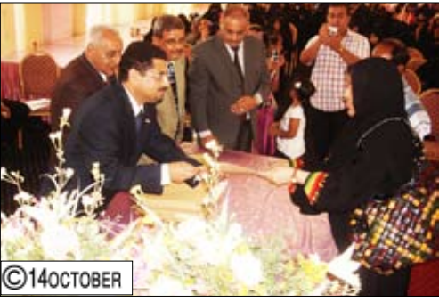
شائف يكرم عدداً من العاملين المتميزين في عدن