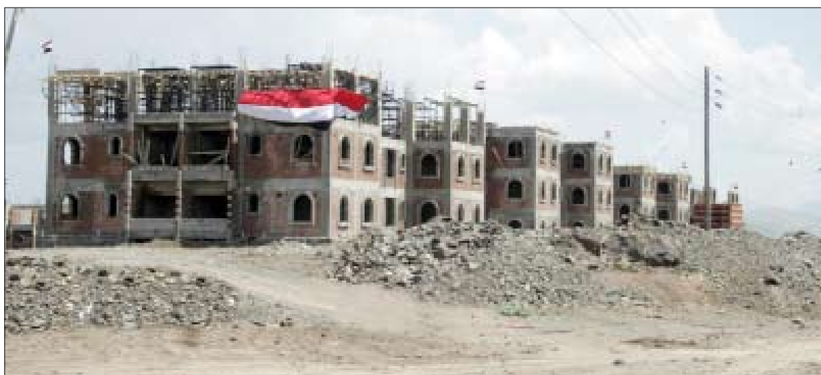
مشاريع الصالح السكنية