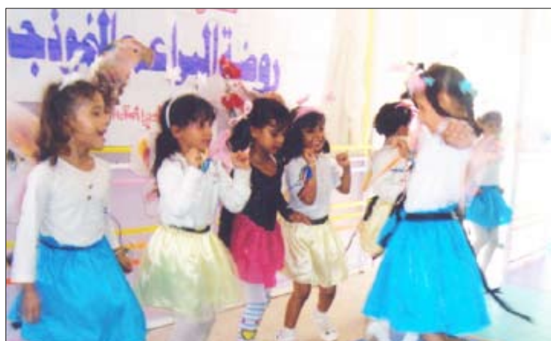
مجموعة الفرائشات تقدم إحدى الرقصات