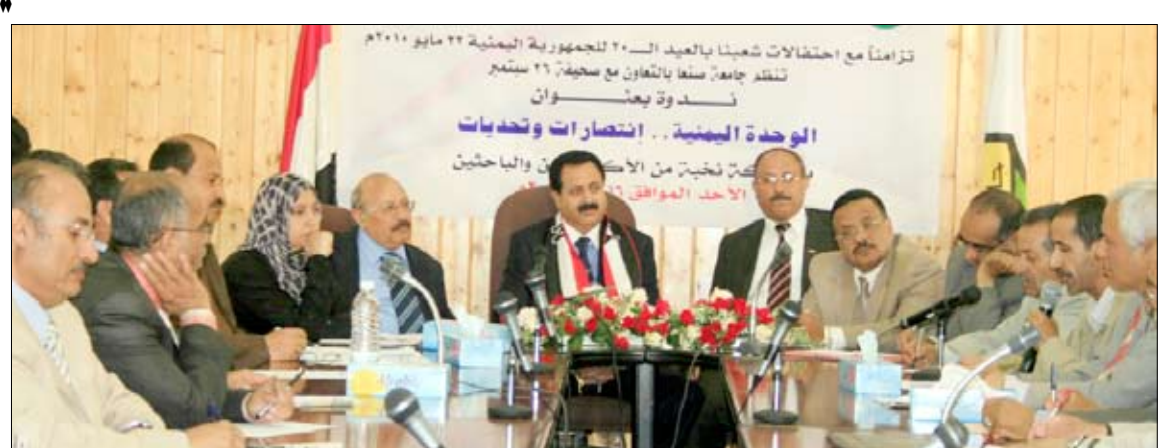
الندوة الخاصة باستعراض انتصارات الوحدة اليمنية وتحدياتها